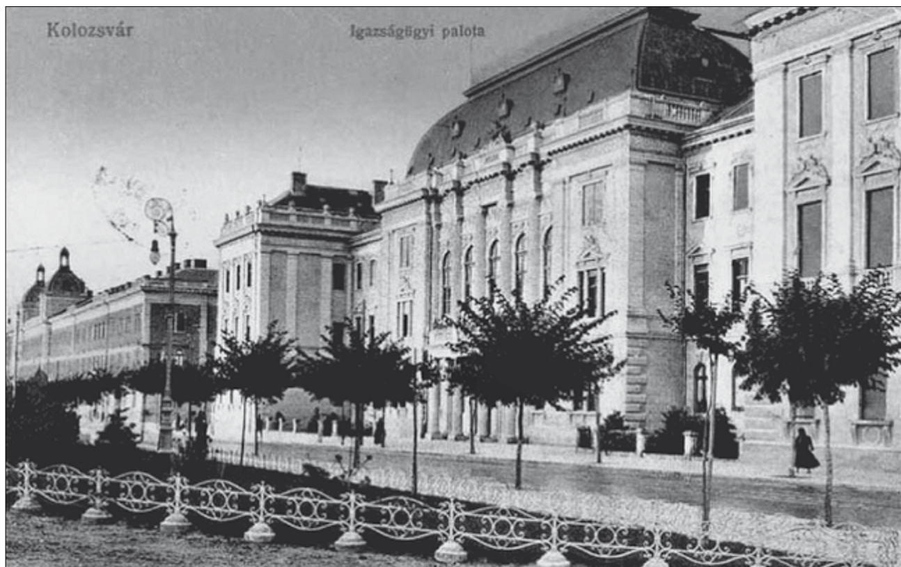
A kolozsvári Igazságügyi Palota 61

lényegében az Mtj. 1737. és 1742. szakaszait alkalmazva utasította el a felperesek keresetét a Besztercei Kir. Törvényszék, mivel a megállapított tényállás szerint a baleset kizárólag az elhunyt (férj és apa) hibájából következett be, így a felperesek méltányossági alapon nem követelhetek kártérítést. Kizárta ezt továbbá az a körülmény, hogy a balesetet gépjárművel (veszélyes üzemmel) okozták, amelynél a bírói gyakorlat a méltányossági szabály alkalmazását nem tette lehetővé. 56 Ezzel egyező álláspontot foglalt el a Nagyváradai Kir. Ítéletábla, noha ez ügyben egyedül a sérült kizárólagos hibája jelentette az elutasítás okát. 57