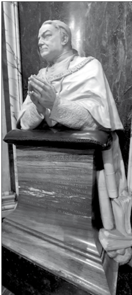
Pietro Gasparri bíboros szobra a lateráni bazilikában, mellette a lateráni egyezmény (b) és az 1917. évi Codex Iuris Canonici (j) 31

A római kérdés rendezése már a legkevésbé sem XI. Piusz pápa hozzáállásán múlt, 1922 tavaszán még azt gondolhatta bárki, hogy államtitkára, Pietro Gasparri bíboros támogatásával beteljesítik XV. Benedek pápa azon vágyát, hogy közvetlen utódja ténylegesen véghez viszi azt a folyamatot, amit ő korábban elindított. Ráadásul, amikor a francia kormány ismét felállította a Szentszékhez akkreditált követségét, akkor az olasz kormány 1921-ben egy zöld könyvet bocsátott ki, melyben a római kérdés rendezését Olaszország érdekében is kívánatosnak tartotta, feladva ezáltal azt a korábbi konzekvens felfogást, mely szerint az 1871. május 13-án kelt garanciatörvény érinthetlenségét hirdették. 32 Azonban még XI. Piusz pápa megválasztásának évében jelentős politikai fordulat következett be Olaszországban, nevezetesen 1922. október 31-én megtörtént a marcia su Roma , és Benito Mussolini lett a miniszterelnök, az ezt követő években pedig fokozatosan megkezdődött a diktatúra kiszélesítése. Nem sokkal ezt követően, 1922. december 23-án adta ki XI. Piusz pápa az első apostoli körlevelét. Az Ubi arcano Dei kezdetű enciklikában hangsúlyozta a pápa, hogy a pápai szuverenitás biztosítása nemhogy veszteséget nem jelentene Olaszor-