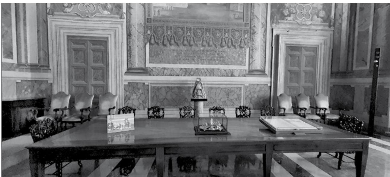
Az asztal, ahol Gasparri és Mussolini aláírták a szerződéseket 45

A lateráni szerződés 1929. június 7-én lépett hatályba a ratifikációs okiratok kicserélését követően, ezen a napon létrejött a Vatikánvárosi Állam, XI. Piusz pápa pedig ki-rogatót adott ki ebből az alkalomból államtitkárának címezve, mely tartalmazta a III. Viktor Emánuel királyhoz intézett első táviratát. 46 Több más törvénnyel együtt szintén aznap adta ki XI. Piusz pápa motu proprio formájában