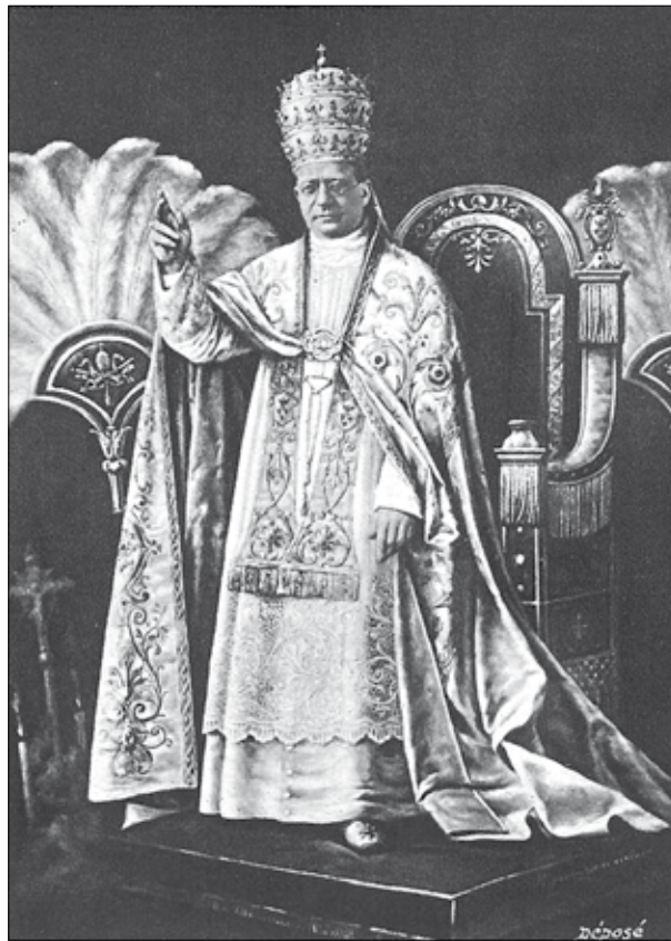
XI. Piusz pápa 2

Az olasz nacionalizmus fokozatos kiszélesedésén túlmenően a Pápai Állam annexiójában a francia–porosz háború kitörése is közrejátszott, hiszen a francia katonák ekkor távoztak véglegesen Rómából, így IX. Piusz pápa már nem számíthatott a francia csapatok támogatására. Még közel egy évtizeddel korábban, Camillo Benso di Cavour miniszterelnöksége idején határozott szándék állt fenn a Pápai Állam szuverenitásának fenntartására, ezt tükrözi az 1864. évi paktum aláírása is. Olyan elgondolás is létezett, hogy Rómának csak a Tevere folyó nyugati oldalán elterülő része, vagyis