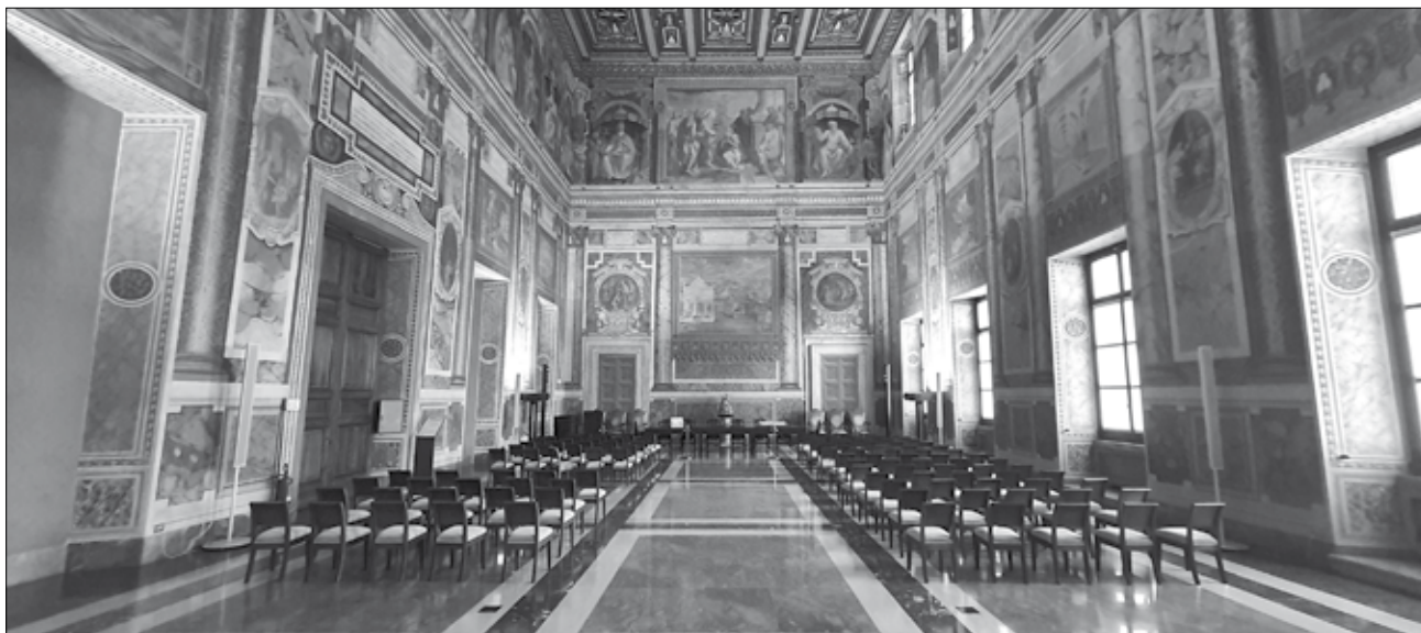
A Pápa Terme 41

meggyőződése, azok a kormányok, akik korábban úgy képviselték magukat, hogy a vatikáni palotának a pusztán használata illette meg a pápát, a későbbiekben még szívesebben teszik majd ezt, amikor az egyházfő szabad és független uralkodó lesz a saját kis államában. 39 A lateráni Apostoli Palota legnagyobb terme a Pápa Terme elnevezést viseli, mely nevét a mennyezet alatti frízen körbefutó tizenkilenc pápa ábrázolásáról kapta, és a monumentális építkezéseket végrehajtó V. Szixtusz pápa (1585–1590) idején nyerte el végleges formáját. XI. Piusz pápa képviseletében Pietro Gasparri bíboros, a Szentszék államtitkára és III. Viktor Emánuel király képviseletében Mussolini itt írták alá a római kérdést véglegesen lezáró három szerződést, 1929. február 11-én 12 órakor. 40