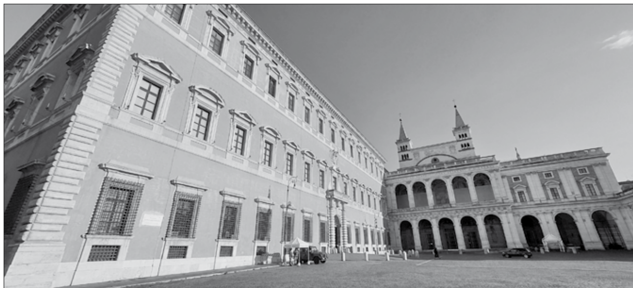
A lateráni Apostoli Palota (b) és az Áldások erkélye, ahonnan 1300-ban VIII. Bonifác pápa megnyitotta az első jubileumi szentévet (j) 38