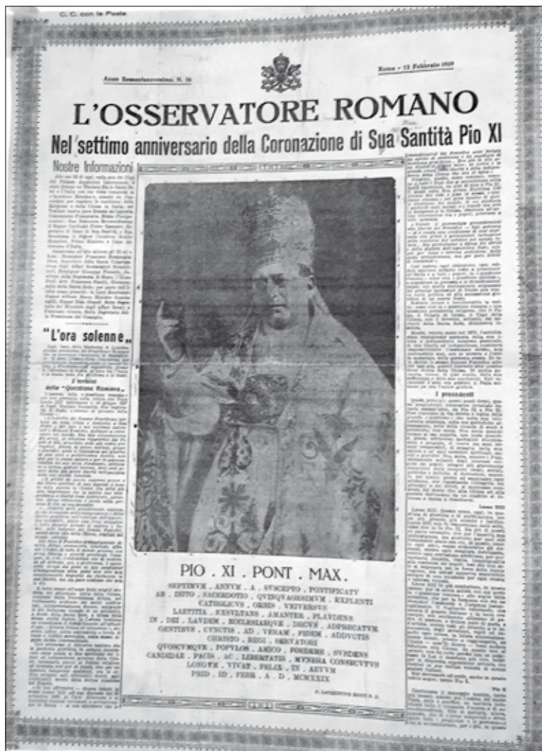
A lateráni egyezmény aláírását követő napon, a L'Osservatore Romano 1929. február 12-én, kedden megjelent lapszámának címlapján XI. Piusz pápa koronázásának hetedik évfordulójáról emlékezik meg, és a római kérdés lezárásáról cikkez 51

Fontos kiemelni, hogy XI. Piusz pápa pontifikátusa alatt az úgynevezett római kérdés rendezésén túlmenően igen élénk diplomáciai erőfeszítések folytak a Szentszék részéről, hogy az első világháborút követő, megváltozott európai viszonyok közepette minél több állammal lehessen rendezni az állam és az egyház viszonyát.