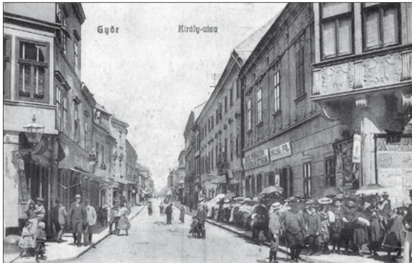
A régi Győr 44