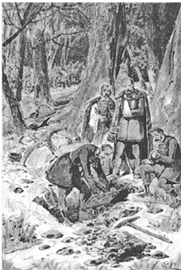
A Szent Korona megtalálása