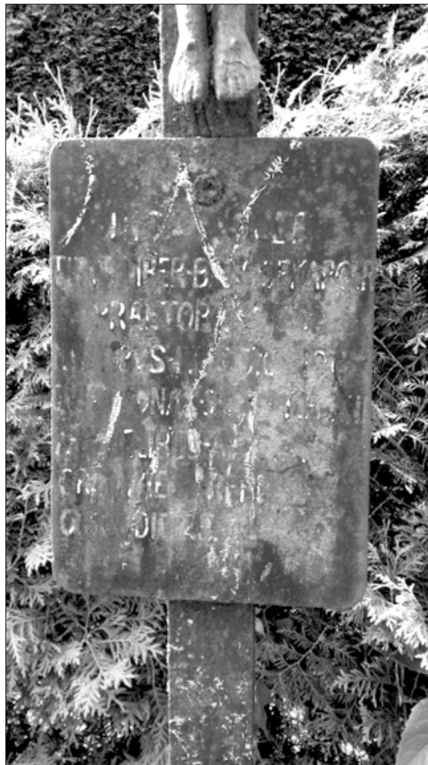
A feszület alatti aranyozott latin felirat 16