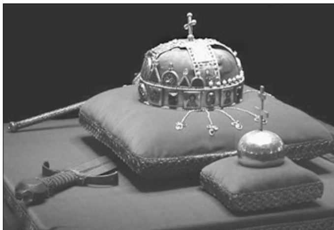
A magyar koronázási jelvények 4

1849 augusztusában Kossuth Lajos (1802–1894) kormányzó elnök és kormányának tagjai menekülésre kényszerültek. Az első felelős ministerium ban belügyminiszteri pozíciót betöltő, ekkor már miniszterelnök Szemere Bertalan (1812–1869) tette el a koronázási jelvényeket tartalmazó ládát Erdélyben. Mivel a láda pontos helyét sokáig homály fedte, az osztrákok jó ideig nem bukkantak a koronázási jelvények nyomára. Szemere a láda helyéről először Bathyány Kázmért (1807–1854) tájékoztatta, aki azt később elmondta az akkortájt Londonban tartózkodó Kossuthnak, valamint Teleki Lászlónak (1811–1861) is.