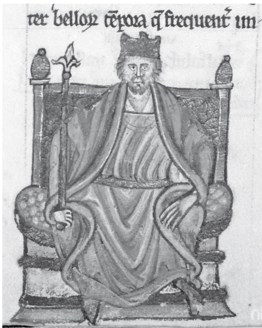
II. Henrik ( Topographia Hibernica , ca. 1186–1188)