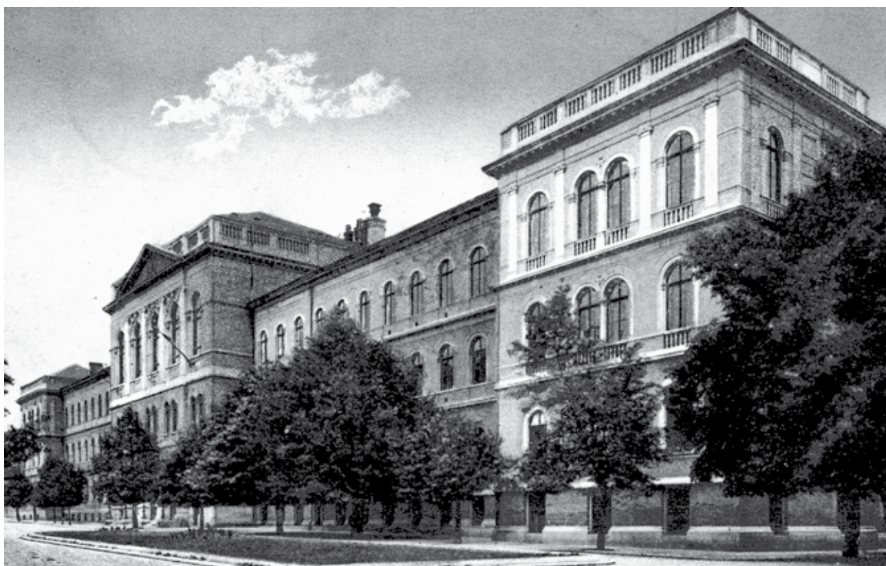
Az egyetem épülete

Az első világháború kezdetekor a mozgósítások eredményeként 800 hallgatót szólítottak zászló alá, és a tanársegédek, a gyakornokok, az egyetemi alkalmazottak nagy része azonnal bevonult. Főképp katonarvosokra volt szükség, ezért a hadügyminiszter már az első hónapban szabadságolta azokat az orvosjelölteket, akiknek csak egy szigorlatuk volt hátra, hogy orvosi oklevelüket megsze-