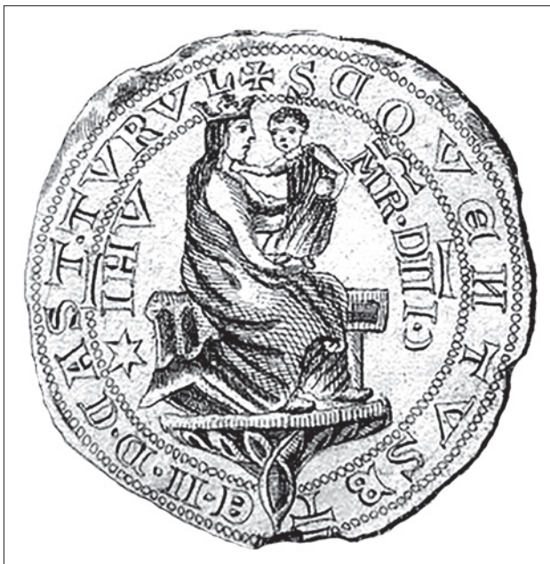
A turóci premontrei konvent pecsétje 1291-ből. Körirata: S[IGILLVM] CO[N]VENTVS B[EA]TE [V]I[RG]I[NIS] D[E] CAST[RO] TVRVL (Turul vári boldogságos Szűz konventjének pecsétje). Belül: M[ATE]R D[OM]I[N]I [NOSTR]I JH[ES]V (Márunk, Jézus anyja) 9

A király az egyházi földesurak számára hospes közösségeik felett gyakorolt joghatóságuk megállapításán, a megyésispánok és más bírók ítélkezése alóli mentesítésén, és néhány különös kedvezményen kívül a közösség belső viszonyairól ritkán rendelkezett. A hatalmuk alatt álló, illetve hatalmunknak alávetett vendégek életviszonyait az egyházi személyek, főpapok, káptalanok, konventek maguk rendezték szabályok