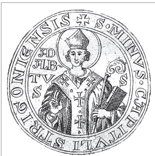
Az esztergomi káptalan pecsétje 1285-ből. Körirata: S[IGILLVM] MINVS CAPITVLI STRIGONIENSIS (ESZTERGOMI KÁPTALAN KISEBB PECSÉTJE). BELÜL: ADALB[ER]TVS S[ANCTVS] (Szent Adalbert) 12