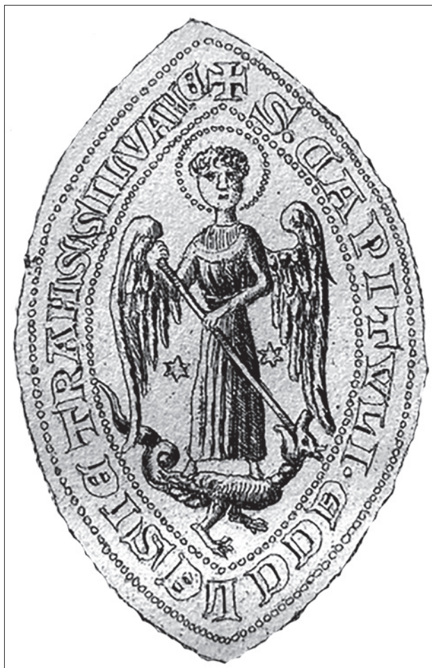
A gyulafehérvári káptalan pecsétje 1291-ből. Körirata: S[IGILLUM] CAPITVLI ECCLESIE TRANSSILVANIAE (Erdélyi egyháza káptalanának pecsétje) 35