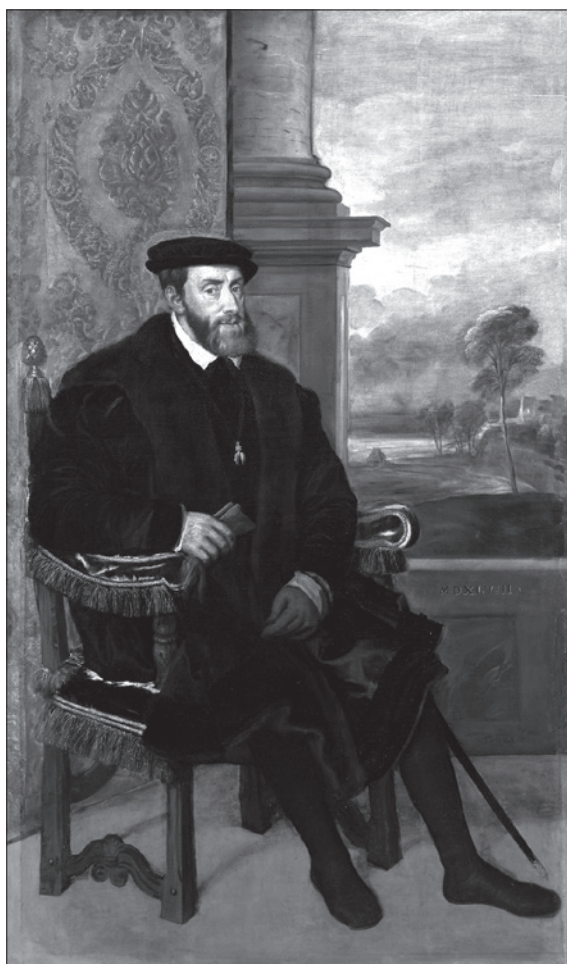
Habsburg V. Károly római császár, spanyol király (1518/19–1556) Tiziano festménye (1548) 18