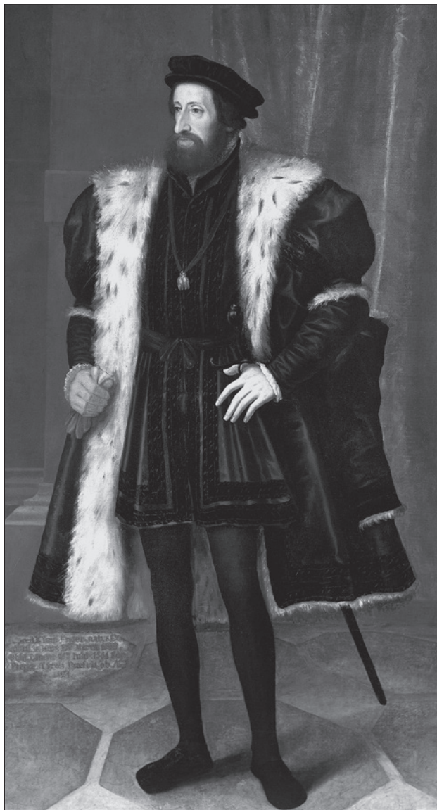
Habsburg I. Ferdinánd spanyol infáns, magyar- és cseh király, választott római császár (1526/1558–1564), idősebb Hans Bocksberger festménye (1550) 27

A Habsburgokat ibériai királyságaik jelentős részében – Aragónia, Katalónia, Valencia, Navarra, Portugália, Nápoly, illetve az Indiák esetében is – alkirályok képviselték, mint alter egok , míg Milánóban és Németalföldön kormányzók. Izabella királynő halála után egyébként többször kormányzók álltak Kasztília élén is, közvetlenül utána férje, Aragóniai Ferdinánd (1504/1506), majd I. Fülöp király halála után Aragóniai Ferdinánd visszatéréseig Cisneros toledói érsek (1506/1507), majd Aragóniai Ferdinánd halála után Károly főherceg megérkezéséig Cisneros érsek (1516/1517). Károly főherceg nem a trónt vette át anyjától, ahogy spanyol földre érkezett, hanem mellette csak a kormányzóságot (1517/1518), majd nem sokkal később megtörtént társuralkodóvá való felavatása. Mivel Károly nemsokára római császár is lett, sokat tartózkodott távol az Ibériai-félszigettől, ezért sokszor helyette kormányzók álltak Kasztília élén, ezek sorában többek között Izabella császárné két ízben is (1529–1533, valamint 1537–1539), Juan Pardo de Tavera