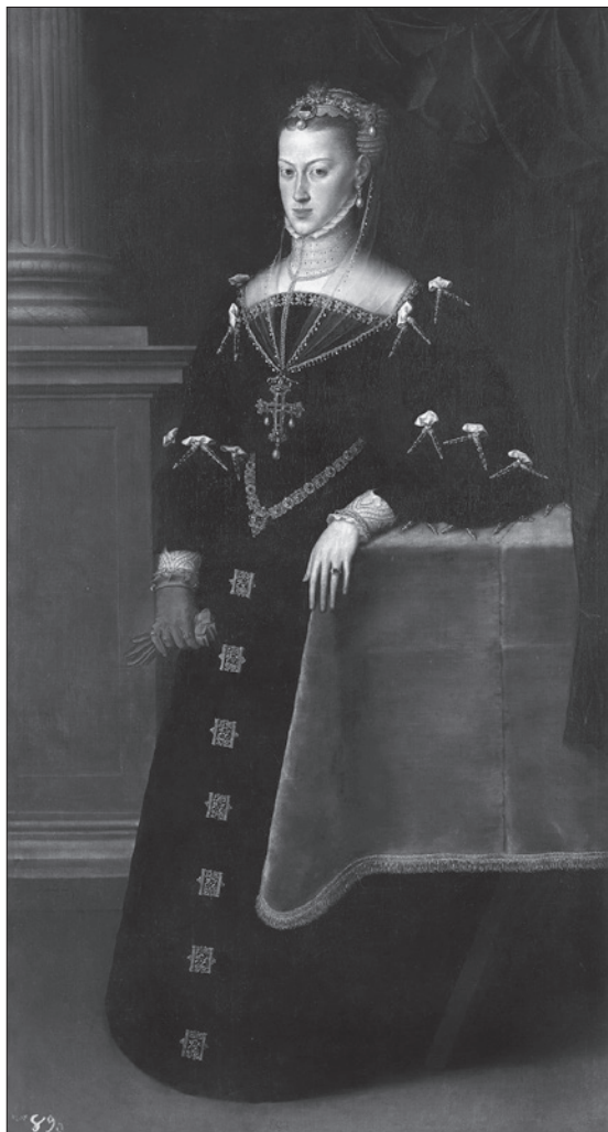
Habsburg Mária infánsnő, a spanyol birodalom társkormányzója (1548–1551), később római császárné, magyar és cseh királyné, Antonio Moro festménye (1551) 41

szági ügyeket testvére, Ernő főhercegre bízta, a magyar tanácsosokkal is ő tárgyalt, míg a horvátországi ügyeket nagybátyjára, Károly főhercegre hagyta. 50 Az 1583. évi országgyűlés után soha többet nem is jelent meg személyesen az országban, a diétákon rendre Ernő főherceg, majd annak németalföldi kormányzói kinevezése után Mátyás főherceg képviselte. Amikor a tizenöt éves háború során a császár átvette Erdélyt, a tervek szerint testvére, Miksa főherceg kormányzóként került volna az élére. 51