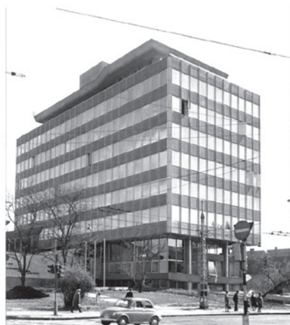
A Pest Megyei Bíróság frissen elkészült Thököly út 97–101. sz. alatti épülete 1973-ban.