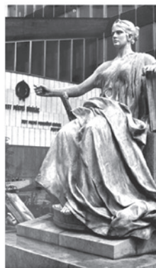
Stróbl Alajos Justitia szobra, amely eredetileg a Hauszmann Alajos által tervezett, 1893 és 1896 között a Magyar Királyi Kúria számára épült budapesti igazságügyi Palota csarnokait díszítette, majd hosszú vándorlásának egyik állomása a Pest Megyei Bíróság Thököly úti épülete előtti térrész lett. Itt 1979 és 1984 között volt látható, majd a Maróty István 16. sz. alja, a 1. legfőbb bíróság (eredetileg az igazságügyi Minisztériumnak készült) épületének előcsarnokába került, ahol ma is megtalálható.

89. Közlemény egyes helyi bíróságok elnevezésének megváltozásáról. [Igazságügyi Közlöny, 1989. (március 31.) 3. sz. 193. p.]