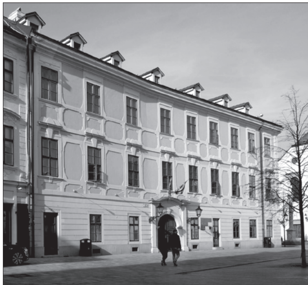
A Helytartótanács egykori palotája a mai pozsonyi főtéren 44

generale számára alakítják át. Ennek megfelelően el is indult a tervezés, de 1783 szeptemberében Hillebrandt Ferenc Antal udvari főépítész közölte Tallher József kamarai alépítésszel, hogy a „rendház épületei más célra vétetnek igénybe s hogy az ezzel kapcsolatos átalakítások terveinek kidolgozására ő – Hillebrandt – kapott az uralkodótól megbízást”, aminek – ahogy Marczali is utalt rá – az volt az oka, hogy Budán, az ország középpontjában összpontosítják „az ország felsőbb fokú” igazgatását. Ez azt jelentette tehát, hogy az „addig Pozsonyban székelt m. kir. helytartótanács, a magyar udv. kamara, a magyarországi főhadparancsnokság, valamint III. Károly király uralkodása idején Pest székhellyel felállított királyi és hétszemélyes tábla voltak azok a szervek” – miként Paulinyi Oszkár tanulmányában fogalmazott –, amelyek Budára kerültek. 51