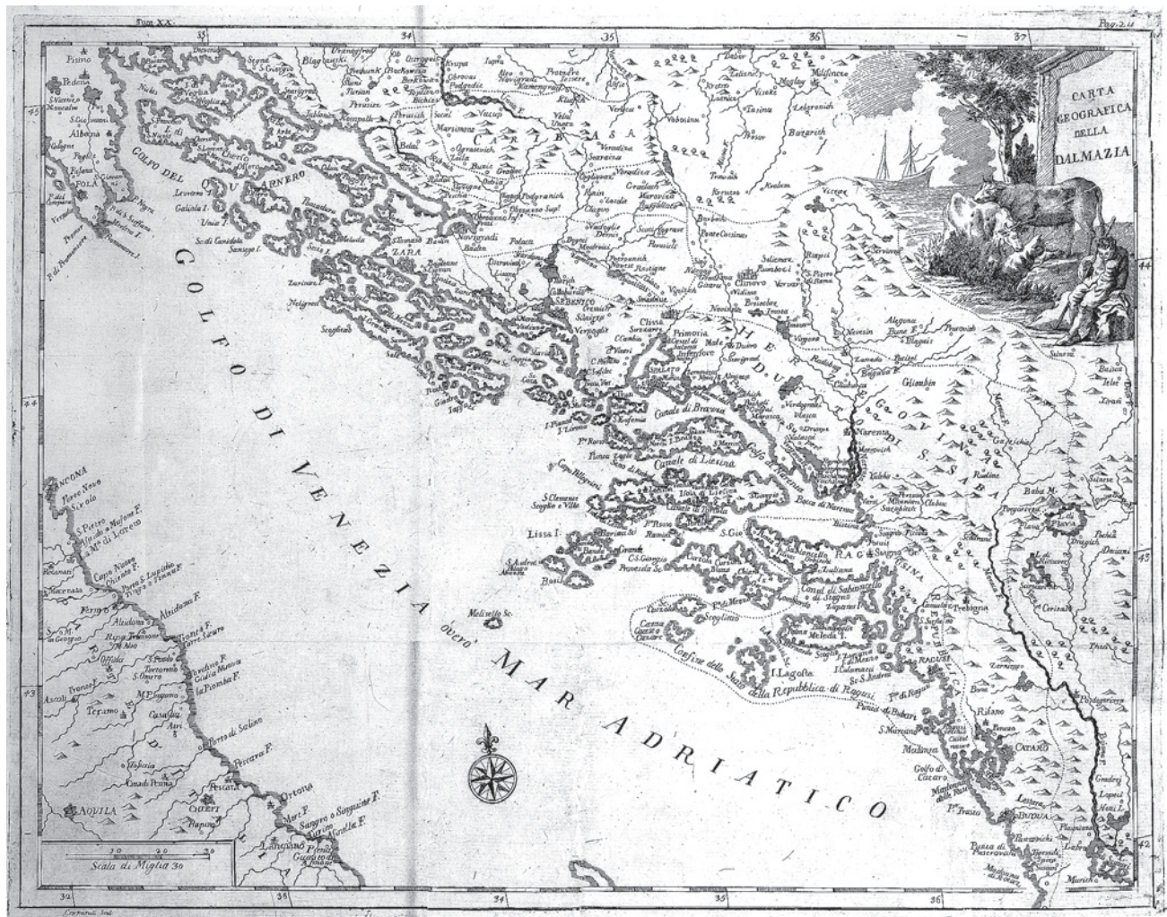
Dalmácia térképe 1