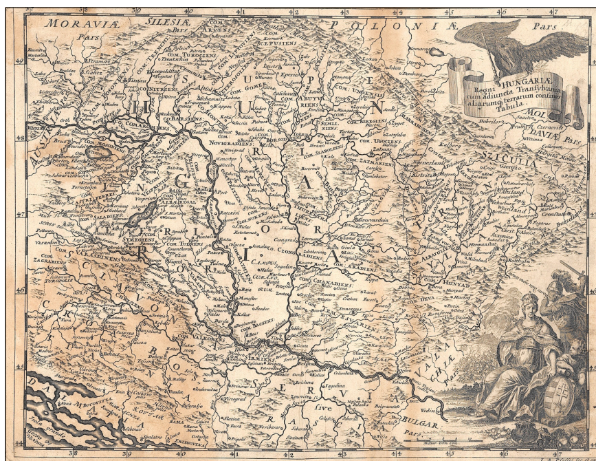
9. ábra. Johann Andreas Pfeffel: Regni Hungarie (OSZK Térkép-, Plakát- és Kisnyomtatványtár, TR 386)

A fentiek alapján tehát valószínűbb, hogy a térképet eredetileg Pfeffel