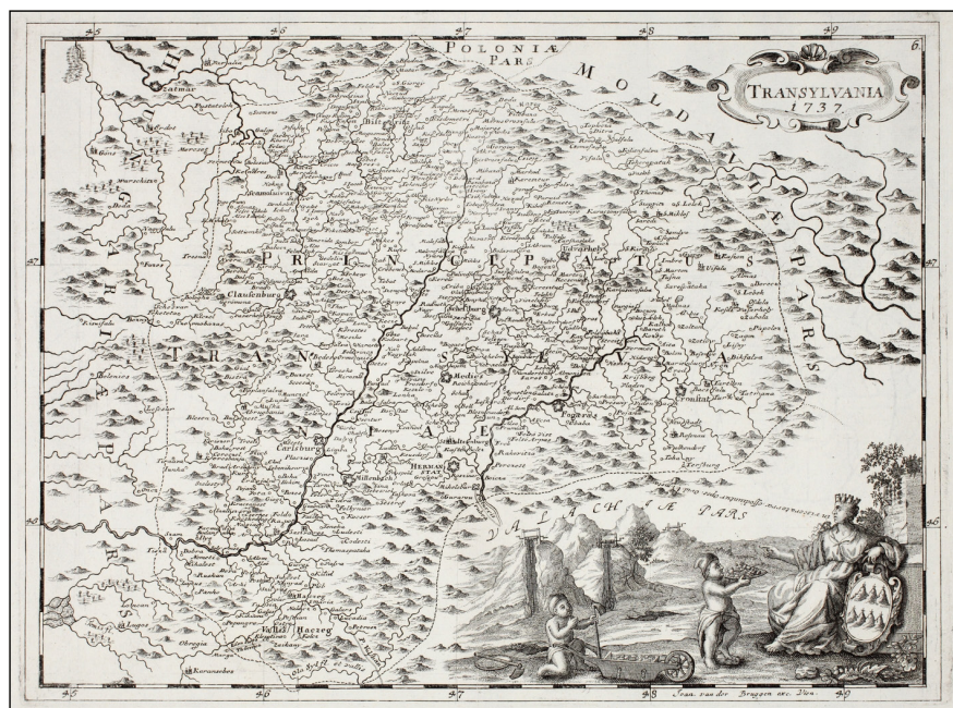
5. ábra. Johann van der Bruggen: Transylvania, 1737 (OSZK Térkép-, Plakát- és Kísnyomatványtár, TA 101 A-6)

tartalmi leírását: XIII. Hęc Tabula XIII Continent omnes supra nominatas Tabulas duodecim cum situ cujus libet proprio Stylo moderno.