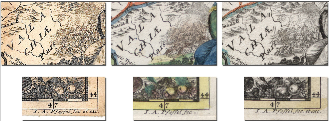
13. ábra. A Regni Hungariæ kiadásainak összehasonlítása