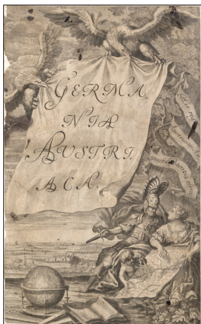
1. ábra. A Germania Austriaca díszes címlapja (OSZK Törzsgyűjtemény, 403.205)

Pffeffel 1711-ben visszatért Augsburgba, ahol kiadóvállalatot alapított. Jóllehet hírnevét térképek metszésével alapozta meg, kiadói tevékenysége során térképkiadással már csak elvétve foglalkozott, feltehetően Matthäus Seutter (1678–1757) kartográfiai művekre szakosodott, szintén augsburgi kiadóvállalatának sikeres tevékenységének hatására. 3