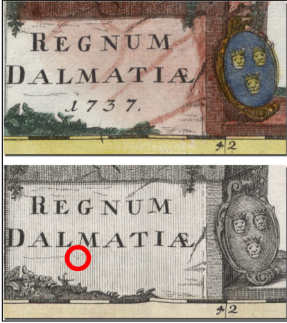
11. ábra. A Dalmácia-térképek összehasonlítása

mint ahogy a korábbi változaton volt. Havasalföld elválasztott feliratába az elválasztást jelölő két vessző került (VALA CHLÆ és VALA., CHLÆ), valamint az Æ betű mellé a csatázók két zászlós lándzsája.