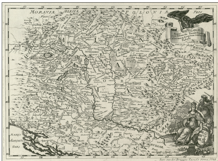
2. ábra. Johann van der Bruggen: Regni Hungariæ , 1728 (MZK, Moll-0003.191)