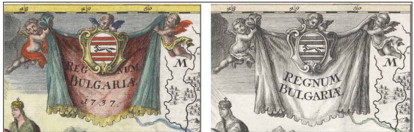
16. ábra. A Regnum Bulgariæ kiadásainak összehasonlítása