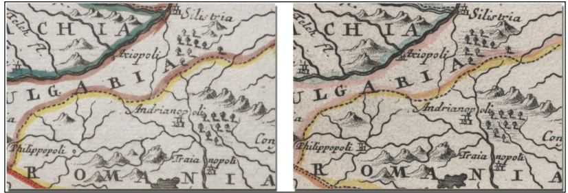
15. ábra. A Regnum Hungariæ, in quo continentur Regiones kiadásainak összehasonlítása