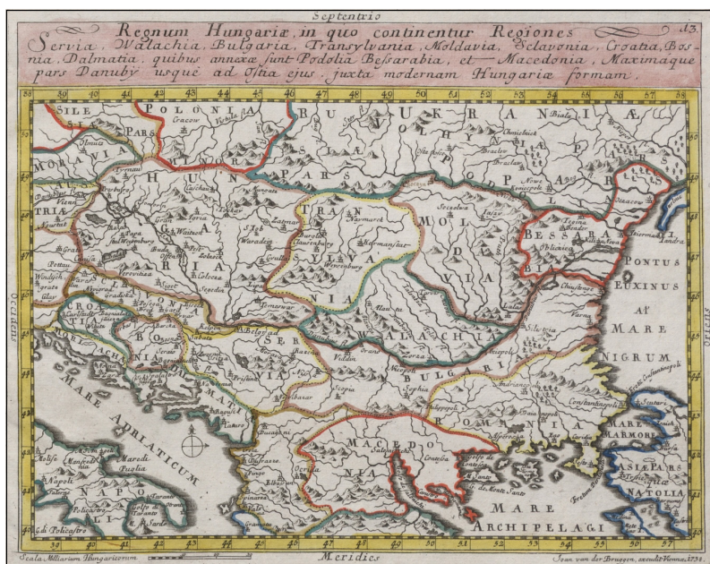
7. ábra. Johann van der Bruggen: Regnum Hungarię, in quo continentur Regiones, 1738 (OSZK Térkép-, Plakát- és Kísnyomatványtár, TA 99 A-13)