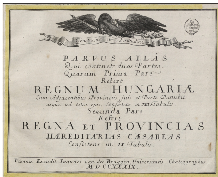
8. ábra. A Parvus atlas bécsi kiadásának címlapja. 1739. (OSZK Térkép-, Plakát- és Kisnyomtatványtár, TA 105)

7. Regni HUNGARLÆ / cum adiuncta Transylvania / aliarumq' terrarum confinÿs / Tabula. / I. A. Pfeffel fec. et exc. Kevés biztosat állíthatunk a térkép keletkezésével kapcsolatban. Az egyik, amit fontos kihangsúlyozni, hogy a térkép sorszám nélküli, és jelenleg nem