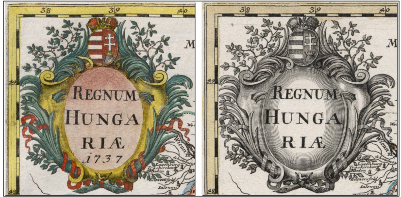
14. ábra. A Regnum Hungariæ kiadásainak összehasonlítása