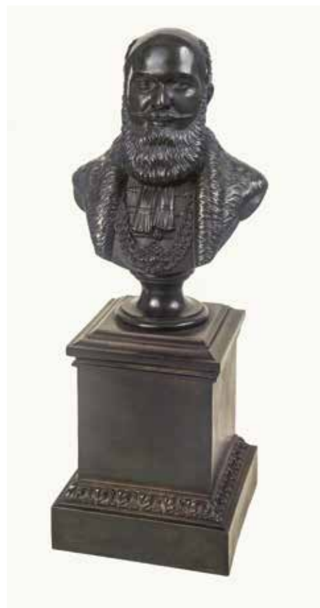
14. kép. Schönborn-Buchheim Károly mellszobra, MNM Rákóczi Múzeuma, ltsz. 2014.2.398.1.