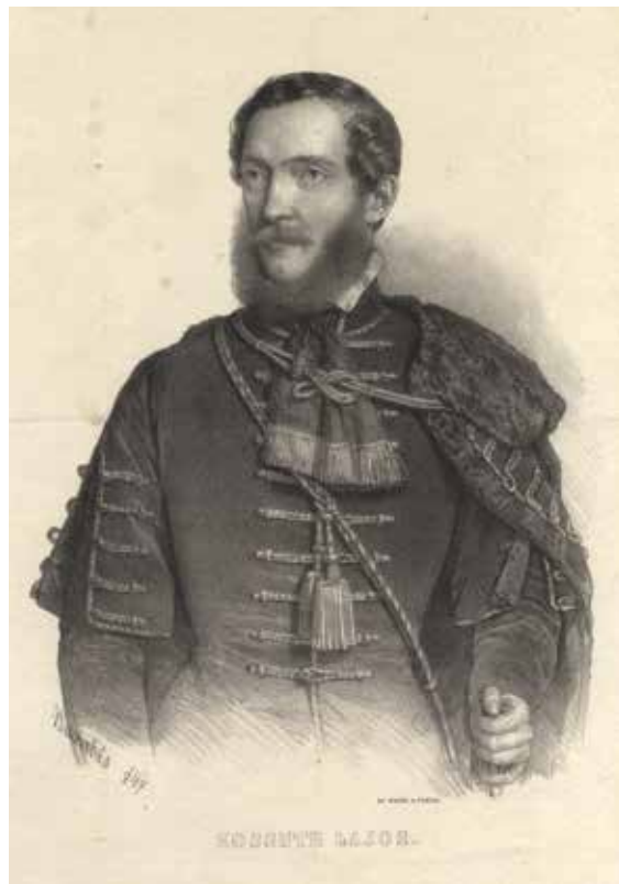
5. kép. Barabás Miklós rajza alapján készült litográfia Kossuth Lajosról, 1847, Magyar Nemzeti Múzeum, Történelmi Képcsarnok, ltsz. 84.9.

Brunnerhez, hogy férje érdekében szót emeljen, amikor azonban meglátta a felakasztott Kossuth-szobrot, egyszerűen nyakon vágta a császári tisztet. Brunner állítólag felháborodás helyett az asszonynak ajándékozta a szobrot, akitől aztán később rokonai örökölték. 60 A családi legenda történeti igazsága persze megkérdőjelezhető, de a hasonló családi mítoszok hitelessége többnyire nem abból táplálkozik, hogy minden részletükben valós, megtörtént eseményeket mesélnek el, hanem abból, hogy a családi identitás kifejeződései. Éppen ezért a fenti történettel kapcsolatban csak annyit érdemes megjegyezni, hogy a legenda egy másik változata szerint a Kossuth-szobor felakasztására a munkácsi várban került sor, miután a kormányzón a halálos ítéletet nem tudták végrehajtani. Ezt a szobrot a fegyházörök megvesztegetésével Riedel Ignác kereskedő segítségével egy Kovács Lőrinc nevű 48-as honvéd