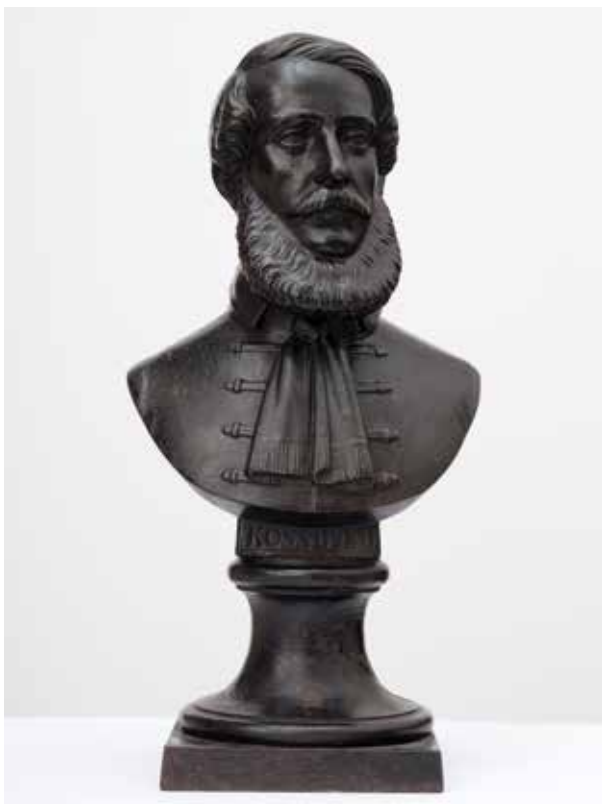
4. kép. Kossuth Lajos öntöttvas mellszobra munkácsi gyárjelzéssel, Magyar Nemzeti Múzeum, Vegyes Gyűjtemény I., ltsz. 1974.40.