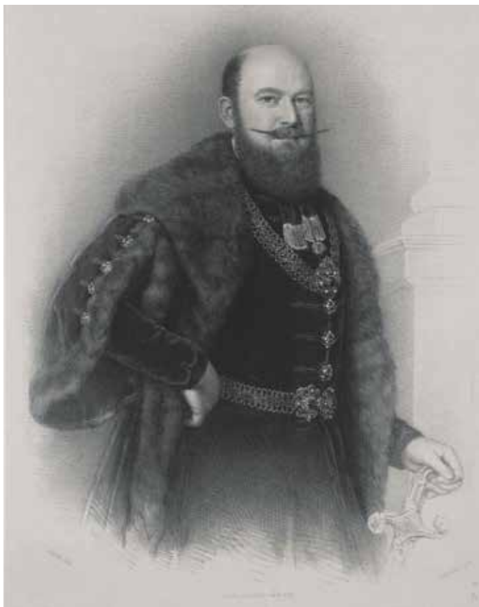
13. kép. August Prinzhofér litográfiája Schönborn-Buchheim Károlyról, Anton Einsle festménye után, Österreichische Nationalbibliothek, Portätsammlung