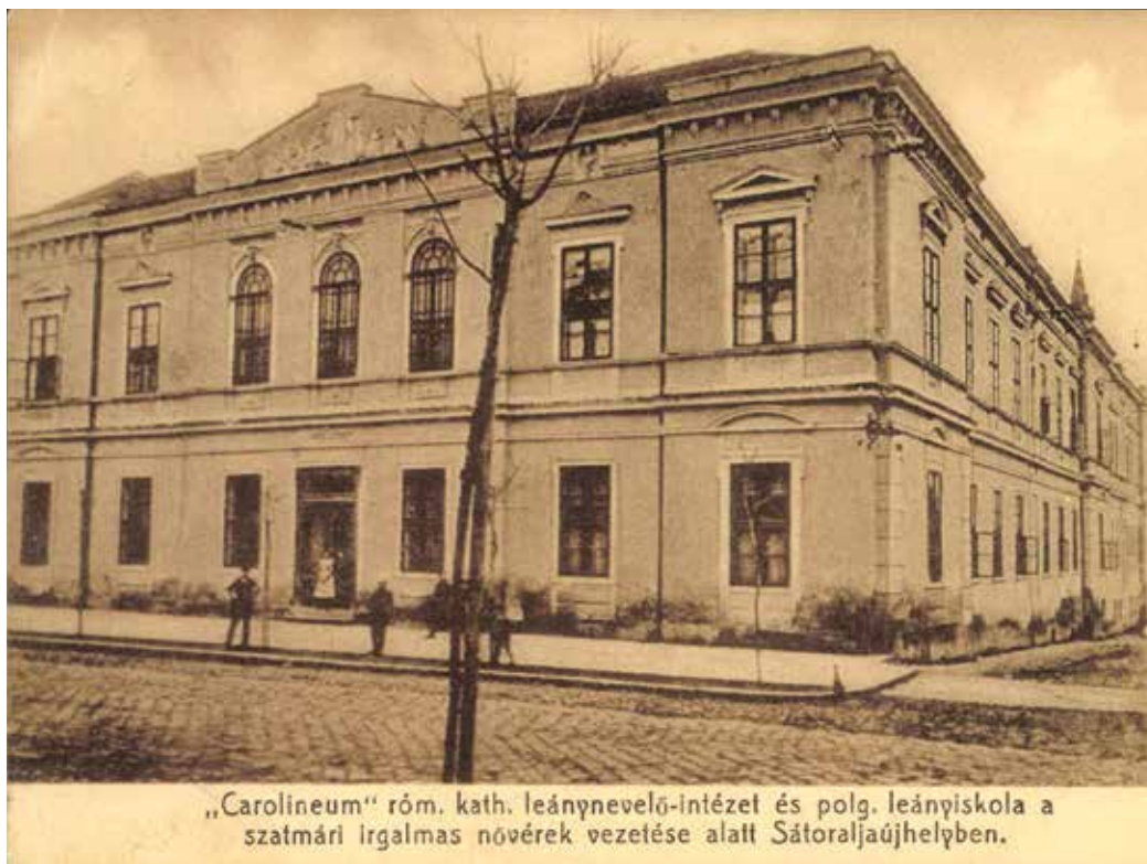
22. kép. A sátoraljaújhelyi Carolineum, képeslap, 1910-es évek, Zempléni Múzeum

ket készítsen. Schossel májusban egy hónap szabadságot kapott a bécsi jószágigazgatóságtól, hogy a sátoraljaújhelyi munkát elvégezze, majd azt időközben bekövetkezett és a munkát hátráltató betegsége miatt 14 nappal meghosszabbították. A Carolineum régi fényképein még kivehető a lányokat tanító apácákat ábrázoló oromzatszobor, illetve a tetőpárkány alatti kör alakú reliefek, de ezeket az 1940-es években eltávolították (22. kép). 100 A fenti példák, továbbá egy 1869-ből származó görögkatolikus egyházi ajánlás alapján feltételezhető, hogy Schossel más hasonló egyházi és világi megrendelésekre is készített díszítő és egyéb szobrászati munkákat, ezek feltérképezése azonban még várat magára. 101