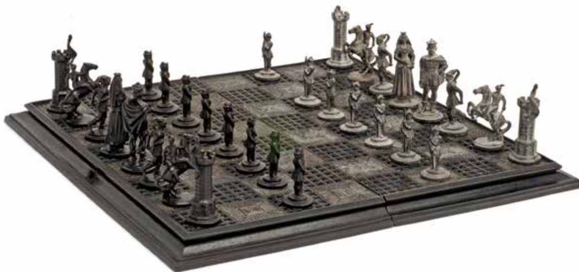
2. kép. Sakkjáték a munkácsi vasgyárból, Iparművészeti Múzeum, Ötvösgyűjtemény, ltsz. 52.2673.1.