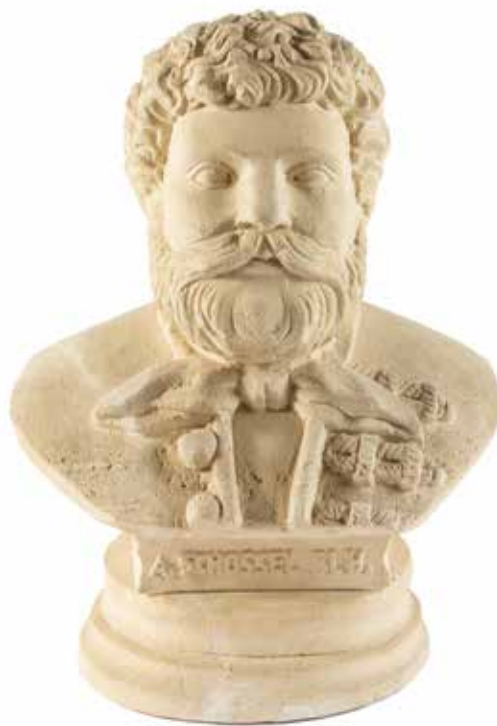
20. kép. Schossel András mellszobra, MMKM Ganz Ábrahám Öntödei Gyűjtemény

A ránk maradt fényképen egy kétalakos szobortorzó látható. Az egyik alak fél térdre ereszkedve hátrafelé dől, és jobb kezére támaszkodik, bal kezét behajlítva maga elé emeli, eredetileg talán szablyát vagy zászlót tartott. Sujtásos dolmányt, vállán átvetve köpenyt, fején süveget visel. A másik bajszos alak terpeszben mögötte áll, teste enyhén hátradől, hiányzó jobb karjával talán a térdelő alakot támogatta, bal karja szintén hiányzik. Prémhajtókás dolmányt és sujtásos süveget visel.