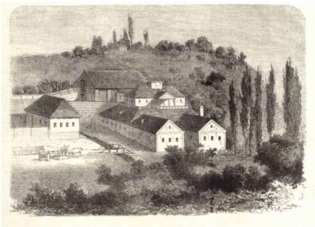
1. kép. A munkácsi vasgyár, rajz a Vasármapi Ujság 1863-as évfolyamából

A hegy szomszédságában alacsony, de mégis emeletes épület áll, amely még abban is különbözik a többi házaktól, hogy feltűnően sok ablaka van. Mintha