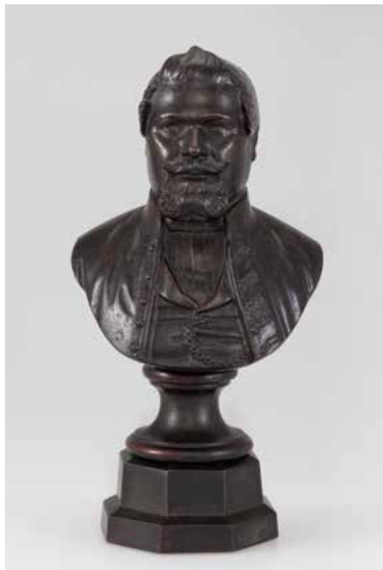
6. kép. Klinkárt Frigyes öntöttvas mellszobra, 1854, Magyar Nemzeti Múzeum, Vegyes Gyűjtemény I., ltsz. 1975.4.

őrnagy szerezte meg az abszolutizmus idején, akinek Nagybányán élő özvegyétől a kolozsvári Országos Történelmi Erekllyemúzeumba került. 61 Egy harmadik híradás szerint pedig a munkácsi Kossuth-szobor egy példánya az emigrációban a volt kormányzó asztalát díszítette. 62 Mindenesetre már Ádámfy József felhívta rá a figyelmet, és azóta közgyűjteményeink is tanúskodnak róla, hogy a szabadságharcot több munkácsi Kossuth-szobor is túlélte. 63