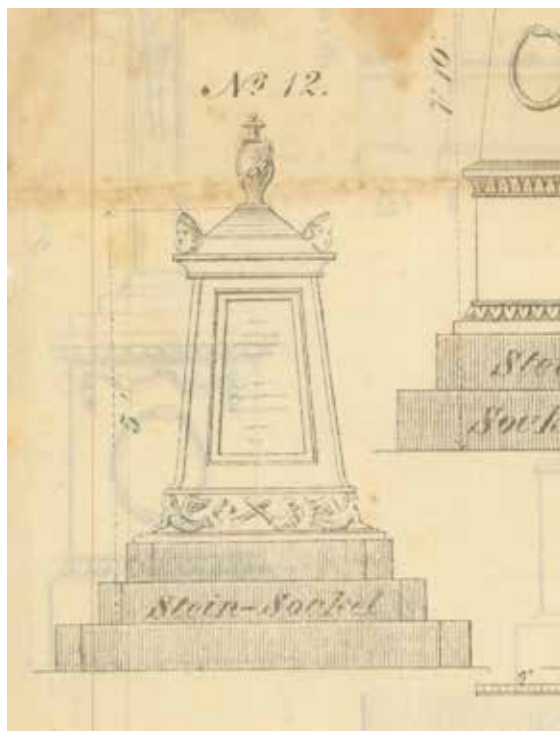
17. kép. Öntöttvas síremlék vázával a munkácsi vasgyár 1863-as mintalapjáról, Magyar Építészeti Múzeum és Műemlékvédelmi Dokumentációs Központ, gy. sz. 856.

1871. évi mintalapok adnak teljes képet. 91 Annyi bizonyos, hogy semmilyen forrás nem utal arra, hogy Schossel ezek tervezésében részt vett volna, de kizárni sem lehet, hogy akár csak egy-egy díszítőelem tervezését, mintázását – a síremlékekhez, kályhákhoz vagy lépcsőkhöz hasonlóan – ő végezte.