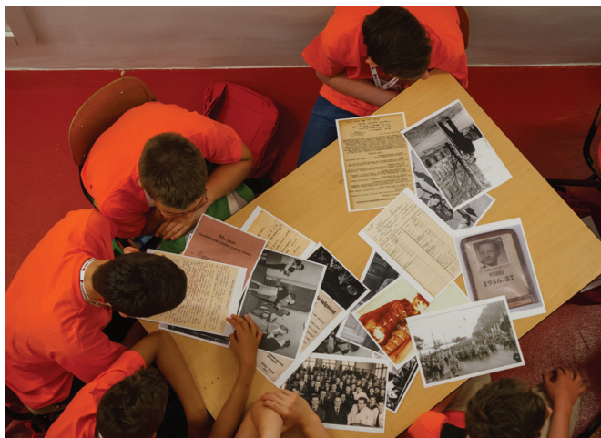
1. ábra 11

Ebben a rendezvénysorozatban találta ki programját és szerezte meg főbb levéltár-pedagógiai tapasztalatait intézményünk is, ahová a foglalkozás keretében kb. 100 gyermek jut el évente. 10 Eddigi foglalkozásainkon az iratokkal való közvetlen találkozás reményeink szerint olyan többletet biztosított a gyerekek számára, amely élményszerűvé tette az ismeretszerzést mind a Műegyetemről, mind az érintett történelmi korokról és eseményekről, valamint fejlesztette a kritikai gondolkodást és a szövegértést. A táborban való részvételünknek éppen ez volt az egyik célja. A bekapcsolódásunk egyúttal a fenntartó egyetem számára is jelzés, hogy a levéltár természetes része az intézménynek, teljes mértékben beintegrálódik a szervezetébe és ott van a mindennapokban, munkánkban és szolgáltatásainkban pedig nemcsak közvetlenül az egyetemi szervezeti egységek felé, hanem a társadalom felé is látható a hasznosulása.