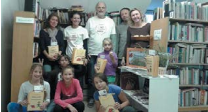
11. ábra. 2016. október 7., Vértesszőlös. A KSZR online ökoetélkedő döntője