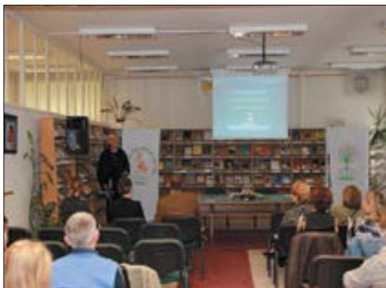
16. ábra. 2016. október 3., 45. Könyvtári Hét, Tatabánya JAMK. A Zöld Könyvtár prezentáció

2017 novemberében pedig meghívást kaptunk Nyíregyházára a Szabolcs–Szatmár megyei Könyvtáros Egyesület konferenciájára zöld témáink bemutatására.