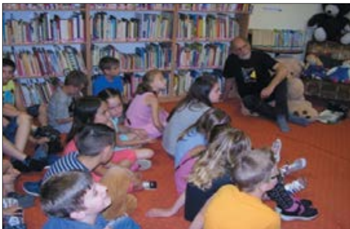
14. ábra. Környezetvédelmi Világnap, 2017. június 9., Komárom Jókai Mór Városi Könyvtár gyermekkönyvtára

náraik részvételével közösen meglekintették a Vad Magyarország - A vizek birodalma című filmet (amely egyébként Könyvtármozis film is), és játékos formában feldolgozták az ott látottakat. A film a legfontosabb hazai tájainkat mutatta be az állat- és növényvilágon keresztül az évszakok változásában. Nyelvi játékokon, fejtörőken keresztül az élővilággal kapcsolatban hívtuk fel a figyelmet hazánk természeti értékeire és a környezetünk megóvására.