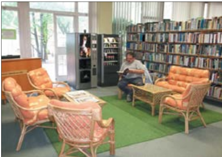
2. ábra. Ökosarok – öko olvasótér

Ökosarokként külön kis olvasótér lett kialakítva a könyvtáron belül. A tágabban értelmezett ökológia témaköreiből a jelenlegi kínálat mintegy 7000 kötet könyv és 30 folyóirat. Ebből kb. 1500 kötet a szabadpolcon is megtalálható. Könyvválasztékunk nemcsak a kimondottan természettudományos munkákat tartalmazza, hanem a más tudományterületek ökológiát érintő, keresztező alkotásait is.