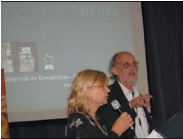
13. ábra. 2015. június 16–17., Zsolna. Rajecfördő ökoprezentáció

2015. április 13-án az érsekújvári Anton Bernolák családi-városi könyvtár meghívására és képviselőjében előbb Érsekújváron egy baráti találkozó keretében, majd nyár elején, Zsolnán és Rajecfördön (június 16–17.) kétnapos nemzetközi könyvtáros konferencián vehettünk részt, ahol bemutattuk könyvtárunk ökotevékenységét. 2017-ben a Nyitrai Karol Kmetko Kerületi Könyvtárban, V4-es körben, lengyel, szlovák, magyar részvétellel mutatkoztunk be egy lehetséges közös projekt terveinek keretében.