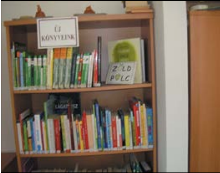
9. ábra. Zöldpolc Naszályon