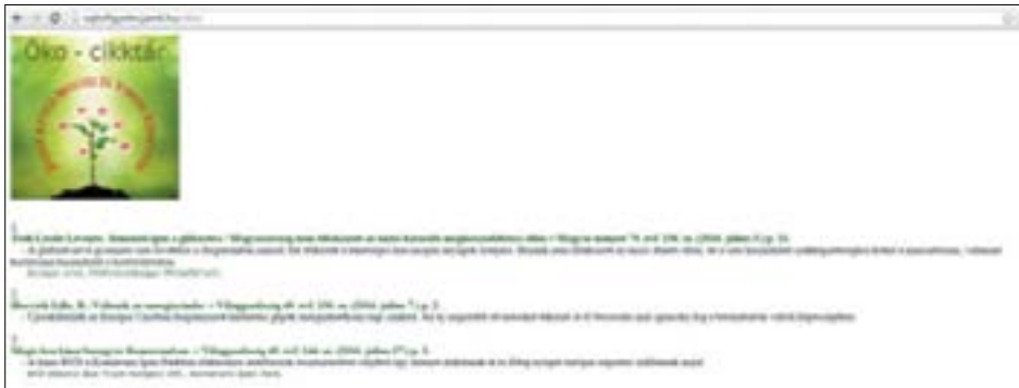
4. ábra. Az öko-cikktár és elérhetősége: http://sajtofigyeles.jamk.hu/oko