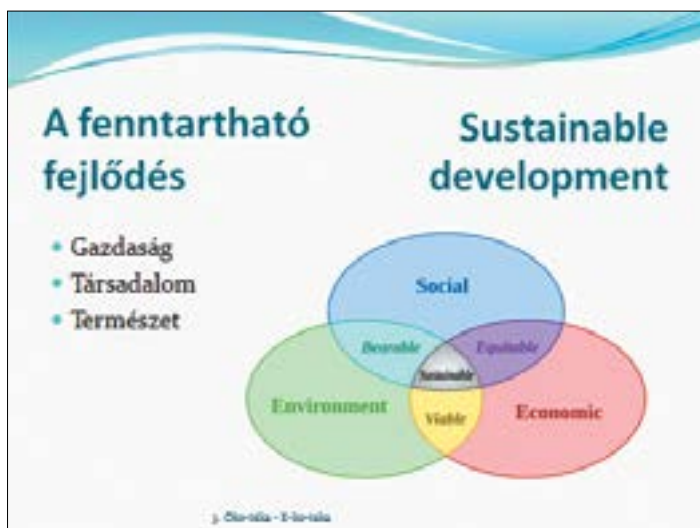
19. ábra. Azért, hogy a világunk elviselhető, igazságos, életképes, fenntartható lehessen

Be kell ruházni az oktatásba, a kultúrába, így a tudástárakba, a könyvtárakba is. A tudatosság a záloga egy szerethető, élhető és fenntartható világnak. A környezettudatosítás helyi szinten, helyi megoldásokkal, helyi példákkal a leghatékonyabb. A kihívásokra a holisztikus megközelítések adhatják a legjobb válaszokat, amelyek a társadalom minden rétegét képesek megszólítani.