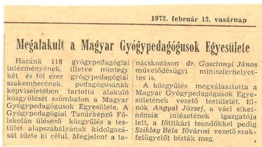
1. kép. Népszabadság 1972.február 13. (Forrás: MAGYE archívum).