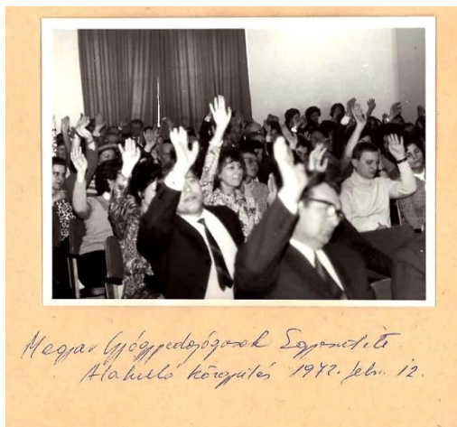
1. kép. Szavazás.