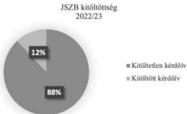
2. ábra. Járási szakértői bizottsági kitöltöttség (saját szerkesztés).

Összességében nagyon pozitív visszajelzéseket kaptunk az egyes kérdéseknél (dominánsan négyes és ötös értékeléseket) mindkét szakfeladaton, de körvonalazódtak a kiemelő és fejlesztendő kérdéskörök is. A „nincsen információ” mindenképpen felhívó jelleggel bírt és átgondolást kívánt, főleg a 10. kérdésnél LO szakfeladaton („Gyermelem érdekében a szakember konzultált más szakemberekkel is”), illetve a 13. kérdésnél JSZB szakfeladaton („Megfelelő segítséget kaptam gyermekem problémájának otthoni kezeléséhez”). A nagyszámú „nincsen információ” válasz miatt ezeket a kérdéseket nem relevánsnak ítéltük meg. A szakfeladati kérdéseket egyenként elemezve megállapítottuk, hogy vannak területek, ahol fejlődnünk kell (pl. tájékoztatás a vizsgálatl kapcsolatban, megfelelő körülmények, a szakemberek a jól érthető tájékoztatást preferálják, a terápia folyamatáról mindig alapos tájékoztatásban részesülök stb.). Az egyéb, szülő által megfogalmazott észrevételeknél döntően pozitív, akár személyre szóló értékeléseket összesítettük a negatív tartalmú észrevételekkel együtt.