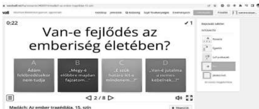
6. sz. segédanyag. Párosítás (saját szerkesztés a Wordwall oldalon).

A 6. sz. segédanyag tetszés szerint elkészíthető akár a Wordwall felületén, az alábbiak szerint. Kösd össze a párokat, értelmezd a mondatokat, kérdéseket. Az összekötés által létrejött kérdéseket válaszold meg a mű alapján. Vagy – akár – teljes órás feladatnak is megfelelő. A szövegből ki lehet a sorokat keresni, egyszerűsítve ezzel a feladatot – szükség esetén.