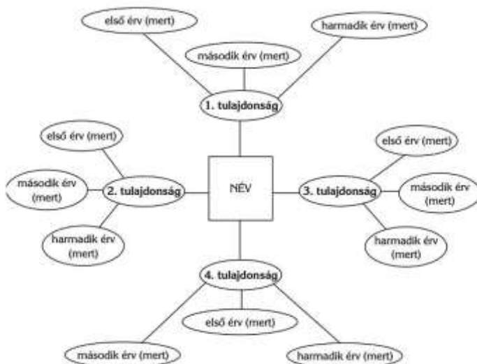
2. sz. segédanyag. Pókháló ábra (Pethóné, 2005, p. 248.).

Eltérő ütemű haladás esetére: A YouTube -on meghallgatható a szín 16 perc alatt, ha valaki nem olvasta volna el, így pótolni tudja. Közben egy meghatározott feladat elvégzése kérhető tőle (tőlük). ld. 2. sz. segédanyag.