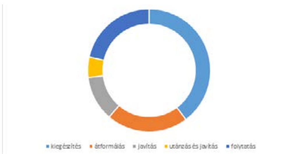
3. ábra: A gyermeki beszédprodukcióra adott reakciók

A kisgyermeknevelők válaszait a 3. ábra összegezi. A nevelők körében a gyermek által elmondottak kiegészítése volt a legnépszerűbb és legdominánsabb módszer, ezt követte a gyermek által mondottak folytatása, majd az átformálás, az új struktúra felkínálása. Meglátásunk szerint az átformálás (újrafogalmazás) módszerét célszerű lenne gyakrabban alkalmazni, hiszen ez a módszer egyrészt segítheti a megértést, másrészt változatosabbá teheti, bővítheti és színesítheti a gyermek nyelvhasználatát.