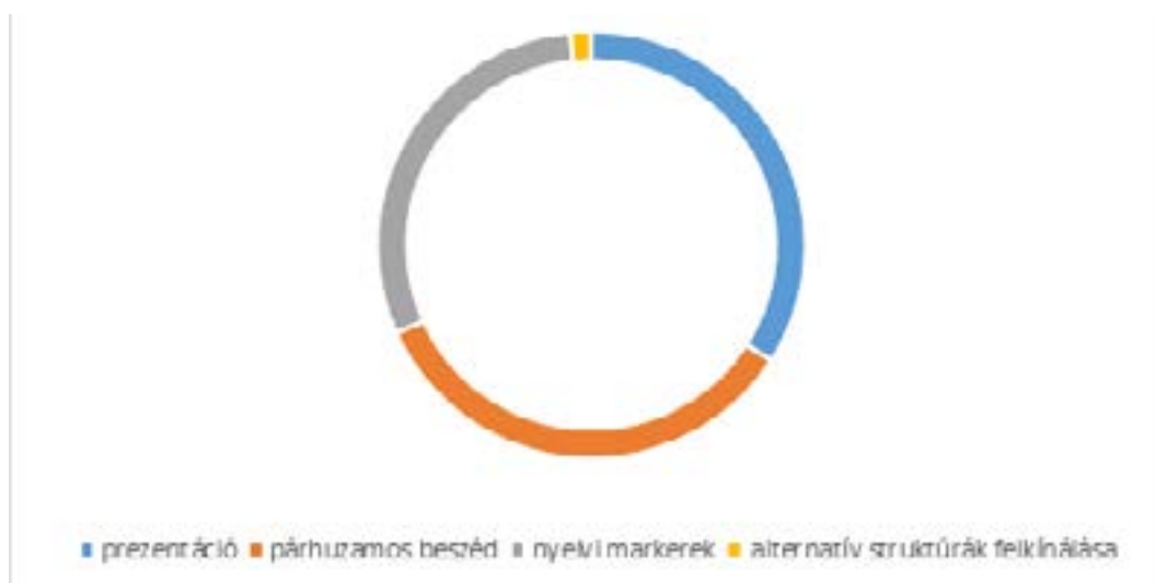
2. ábra: Nyelvi eszközök alkalmazása a beszédfejlesztésben

Megvizsgáltuk, hogy a kisgyermeknevelők milyen formában reagálnak egy-egy gyermeki megszólalásra. A kérdőívben erre vonatkozóan az alábbi válaszlehetőségeket adtuk meg: