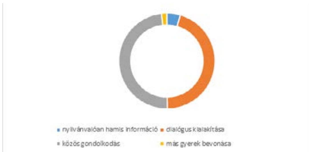
4. ábra: A gyermeki beszéd motivációjának eszközei

jól ismerik, és gyakran alkalmazzák. Sajnos kevesen élnek a közösség adta kommunikációs lehetőségekkel. Nem vonnak be újabb gyermekeket egy-egy beszélgetésbe, hogy aztán hátra húzódva, segítő szerepben ösztönözzék őket az önálló párbeszédre és társalgásra. A hamis információk beépítését alig jelölték. Úgy tűnik, hogy ez a stratégia aggodalmat kelt a nevelők körében, holott a gyermekek nagyon élvezik. Jókat nevetnek az általuk felismert „butaságok” hallatán, és egymással versenyezve igyekeznek kijavítani a téves információkat. A humor hatását ebben az esetben az ismereti források (tapasztalat, logika) ellentmondása váltja ki a gyermekben. Hátterében, az esztétikai élményhez és a játék öröméhez hasonlóan, az ún. kollatív tulajdonságok állnak, például szokatlanság, kétértelműség, változás, inkongruitás, összeférhetetlenség (Séra, 1983). Ezek a jellemzők erősen vonzzák a figyelmet, érdekesnek és szokatlannak találja őket a gyermek. Érdemes még kiemelni a humoros közlések élményjellegét, a társas kapcsolatokra gyakorolt pozitív hatását. Természetesen a közlések megértésnek fontos előfeltétele a megfelelő szintű kognitív és nyelvi érettség.