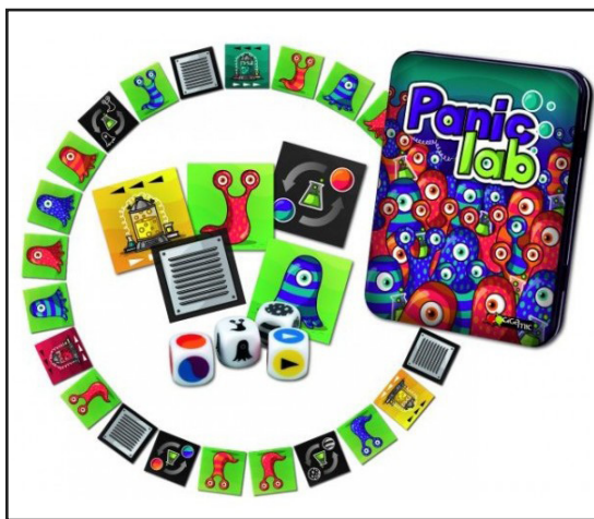
1. ábra: Panic Lab

A játék egy történet köré épül, mely szerint a játékosoknak különböző laboratóriumokból megszökött, szellőzőrácsok mögött bujkáló és menekülésük során különböző átalakulásokon áteső amőbákat kell megtalálniuk. Az amőbák formájuk szerint egy- vagy kétszeműek lehetnek, mintájuk alapján csíkosak vagy pöttyösek, a színük pedig piros vagy kék. Így 2 \cdot 2 \cdot 2 \cdot 2 = 8 különböző amőbánk van, és a játékban mindegyik két példányban jelenik meg. A játék tartalmaz további lapokat is: 3 labor-, 3 mutációsszoba- és 3 szellőzőrácskártyát, valamint négy dobókockát. A laborkártyák (piros, kék, sárga) egyetlen szerepe a kiindulás helyének megjelölése. A mutációs szobák mindegyikében egy-egy átalakuláson esik át az amőba: megváltozik a formája (szemeinek száma), a mintája vagy a színe. A szellőzőrácskártyák egyformák, és a pálya bizonyos szakaszait iktatják ki a keresés során (lásd az 1. ábrát 1 ).