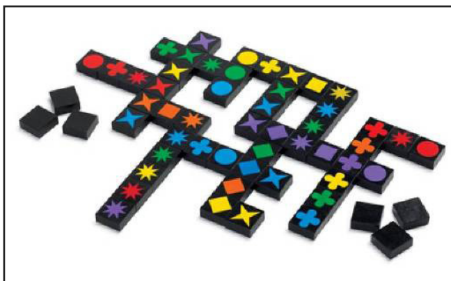
3. ábra: Qwirkle

A játékszabály hasonló a Scrabble játékszabályához: egyszerre egy követ vagy sorozatot játszhatunk ki úgy, hogy annak már letett kőhöz (esetleg kövekhez) kell kapcsolódnia valamint vízszintesen és függőlegesen is illeszkednie kell azokba a sorozatokba, amelyekhez hozzáér. Egy sorozat vagy azonos színű és különböző formájú köveket tartalmaz, vagy azonos formájú és különböző színűeket. (Tehát egy sorozat legalább 2, és legfel-