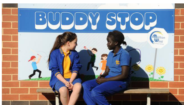
2. ábra: „Pajtás pad” a Melton West Primary Schoolban

A csoportos mentorálás sokszor megalapozza azt a viszonyt, amelyet a személyes mentorálás megkíván. Ilyenkor a mentoráltak kis csoportban találkoznak a mentorokkal, sokszor valamilyen konkrét aktivitással egybekötve. Az alsó-felső tagozat közötti vagy iskolaváltásnál jól bevált módszer a „kezdők” ilyen támogatott bevezetése az új közegbe.