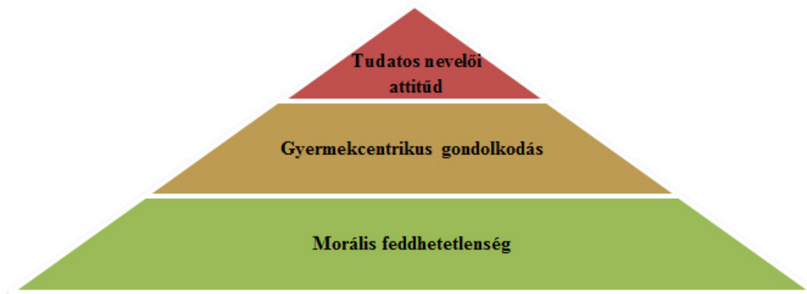
4. ábra: Elvárások a kisdedónővel/gyermekkertésznővel szemben (1880-as évek)

az a törvény 1 , mely először rendelkezett a kisdedovárról (1891. évi XV. törvénycikk a kisdedovárról). Meghatározásra kerültek a kisdedóvodák (vagy menedékhelyek) állításának feltételei, a nevelés célja és feladata, a felvehető gyermekek köre és maximális létszáma. Először szabályozták a képesítésre vonatkozó követelményeket, a kinevezés feltételeit és az óvók javadalmazását is megszabták.