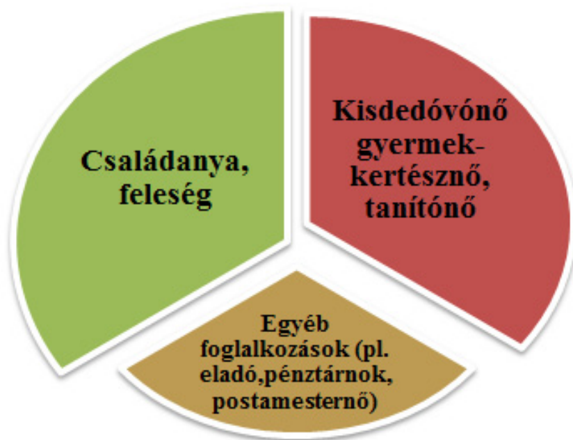
1. ábra: Kívánatos női szerepkörök megoszlása a XIX. század végi cikkekben

A nők foglalkoztatásával a Kisdedóvók és Gyermekkertésznők lapja is foglalkozik, bár nem olyan mélyrehatóan, mint a másik kettő. Ahol „Képzett férfiak nem kellettek, – jók lettek az olcsóbb nők” ( Vegyések , 1882. 12. o.) – olvasható ez a sokatmondó megállapítás. Ezen túlmenően a falusi gyermekmenhelyek kapcsán – olyan helységekben volt szükséges az állítása, hol kisdedóvó nincsen – is írtak a nőkről, mint a kívánatos munkaerőről, mégpedig a következő módon: olyan személyek alkalmasak erre a feladatra, akik „18–30 év közötti, életkedvvel rendelkező, gyermekké válni képes, türelmes és képes maga iránt tiszteletet ébreszteni” ( Kobány , 1882). Ugyan olcsó munkaerőnek tartották őket és nem olyan szakképzettnek, mint a férfiakat, mégis magas elvárásokat támasztottak velük szemben, mind erkölcsi, mind a felkészültség és nevelői magatartás tekintetében, ami a morális életükkel kapcsolatban is többször leírásra került.