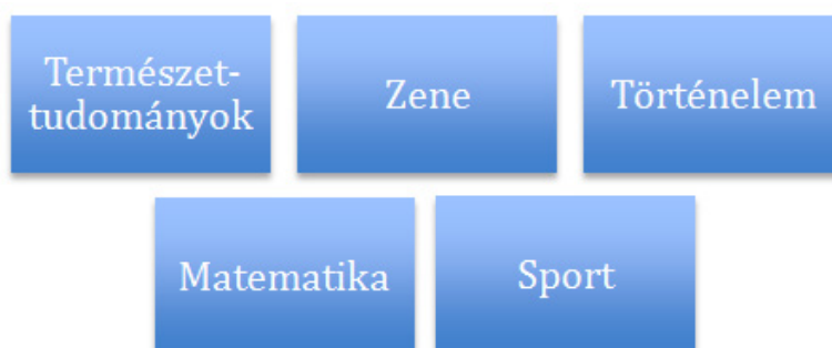
3. ábra: A második félév témái