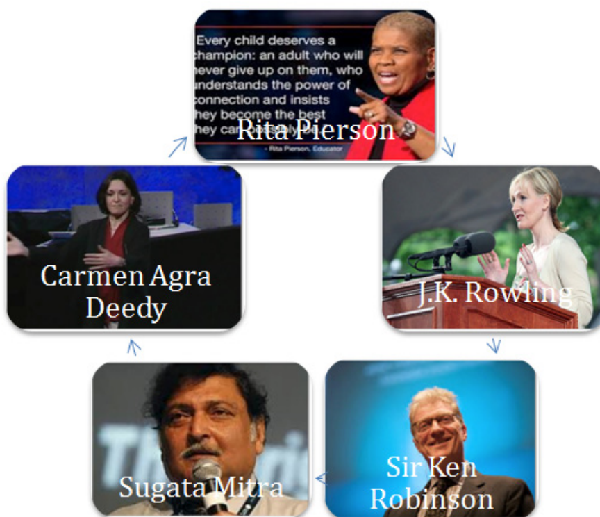
6. ábra: TED-előadók

A TED-előadásoknak az előadói készségek szempontjából való vizsgálata készíti fel a hallgatókat arra, hogy a félév végén hétperces előadást tartsanak az úgynevezett 'TED-napon'. Ennek során minden hallgató tart egy előadást, melyhez bármilyen triviális témát választhat; a lényeg a hatásos, élvezetes előadásmód, önálló beszéd, néhány vizuális illusztráció. Szemléltetésül néhány előadócím az előző tanévből: Gyűjtómánia, Kedvenc receptem, A válás hatása a gyerekekre, Pinterest stb. Ugyanúgy, mint a TED-előadások felvételén, a diákok egymás után adnak elő, melyet egy-két perces visszacsatolás követ.