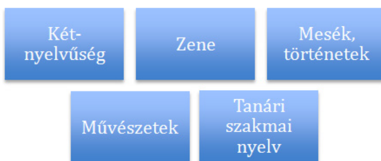
2. ábra: Az első félév témái

A nyelvi előkészítő témaközpontú tematika alapján épül föl. A kétnyelvű általános iskolák tantervének vizsgálata alapján összegyűjtött (környezet, rajz, ének, testnevelés, technika, természetismeret/biológia, földrajz, ITK, országismeret) alapján választottam ki a kurzus témáit, melyek a két félévre lebontva a következők: zene, mesék/történetek, művészetek, természettudományok/környezetismeret, földrajz, matematika és a civilizációhoz kapcsolódóan a történelem. A kurzus bevezető témája a kétnyelvűség lett (2. és 3. ábra).