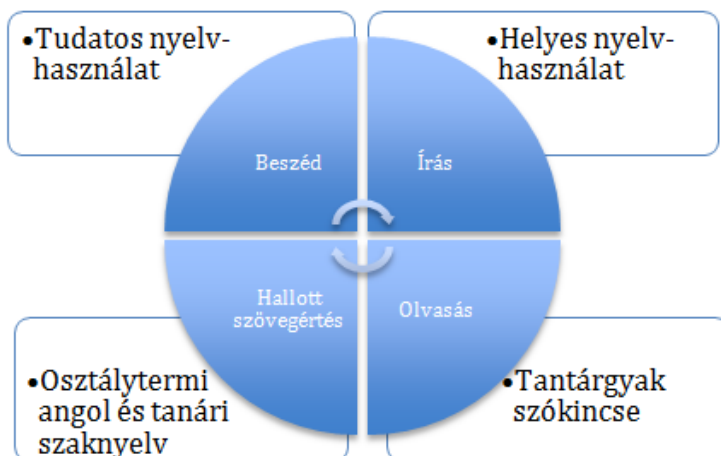
1. ábra: Nyelvfejlesztési célok

A nyelvi előkészítő témaközpontú tematika alapján épül föl. A kétnyelvű általános iskolák tantervének vizsgálata alapján összegyűjtött (környezet, rajz, ének, testnevelés, technika, természetismeret/biológia, földrajz, ITK, országismeret) alapján választottam ki a kurzus témáit, melyek a két félévre lebontva a következők: zene, mesék/történetek, művészetek, természettudományok/környezetismeret, földrajz, matematika és a civilizációhoz kapcsolódóan a történelem. A kurzus bevezető témája a kétnyelvűség lett (2. és 3. ábra).