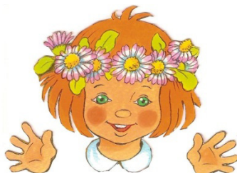
2. kép: Az óvoda logója