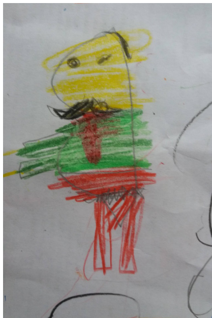
5. ábra: Férfi alak