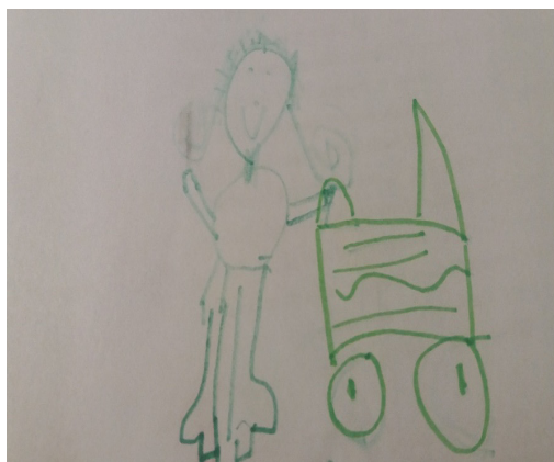
1. ábra: Lány – Anya képe

A legnagyobb fiú azonnal belefogott a történet vázolásához: „ Papa ki van dőlve. Filmet