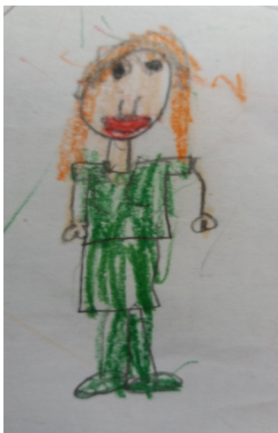
4. ábra: Női alak