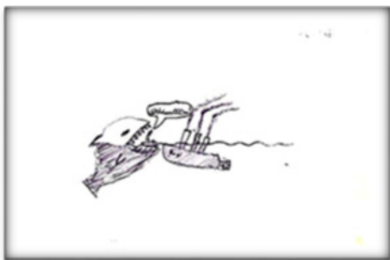
3. ábra: Süllyedő hajó

A 3. ábrán lévő képet egy 14 éves fiú készítette. Két hajó is látható rajta. Az egyik egy háromkéményes óceánjáró, amelyik félig a víz alatt van, csak a kéményei lógnak ki a víz vonala fölé. A másik egy kicsi mentőcsónak, amiben egy pálcikaember áll és kiabál. (a szóbuborékban olvasható felirat: WohhoooOOOoo!) A kis csónak mellett egy kitátott szájú, nagyméretű hal látható hegyes fogakkal. A rajz formai és tartalmi jegyei, mind pedig a rajzoló önértelmezése bizonytalanságról, veszélyeztetett érzésről, erős szorongásról árulkodnak. A rajzoló így mutatja be a képet: Én nem a süllyedő hajón vagyok, hanem a mentőcsónakban! Azt meg bekapja egy cápa. Segítségért kiabálok.