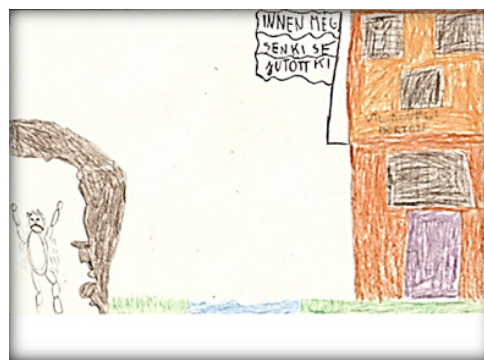
5–6. ábra: Ház a dzsungelben, Világvégi börtön

A 6. ábra egy 14 éves roma fiú rajza. A kép és a felirat is azt tükrözi, hogy a rajzoló a hajótörés, vagyis baj esetén milyen védelemre, milyen menedékre számít. Az épületen látható felirat szerint ez a ház a szigeten egy „világvégi börtön”. Bejárata mellett zászló leng, melyen a következő szöveg olvasható: „Innen még senki se jutott ki” . A bal oldali feltartott karú emberalak a rajzoló szavai alapján ő maga. Egy barlangban áll és elmondása szerint sír. Mivel a fiú tágabb családjában és ismeretségi körében többen ültek már börtönben, így feltételezhető, hogy a rajzban a saját jövőképe is megjelenik.