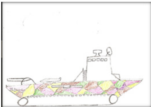
2. ábra: Lánctalpas hajó

A 3. ábrán lévő képet egy 14 éves fiú készítette. Két hajó is látható rajta. Az egyik egy háromkéményes óceánjáró, amelyik félig a víz alatt van, csak a kéményei lógnak ki a víz vonala fölé. A másik egy kicsi mentőcsónak, amiben egy pálcikaember áll és kiabál. (a szóbuborékban olvasható felirat: WohhoooOOOoo!) A kis csónak mellett egy kitátott szájú, nagyméretű hal látható hegyes fogakkal. A rajz formai és tartalmi jegyei, mind pedig a rajzoló önértelmezése bizonytalanságról, veszélyeztetett érzésről, erős szorongásról árulkodnak. A rajzoló így mutatja be a képet: Én nem a süllyedő hajón vagyok, hanem a mentőcsónakban! Azt meg bekapja egy cápa. Segítségért kiabálok.