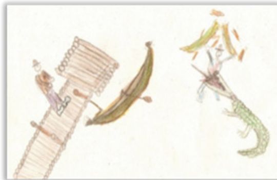
4. ábra: Kikötő krokodilokkal

így mutatja be a munkáját: A kikötő tele van krokodilokkal. Amikor el akartam indulni a hajómmal, akkor az egyik megtámadott. A hajót kettéharapta, engem felfal. A partról nézi egy ember, de nem segít.