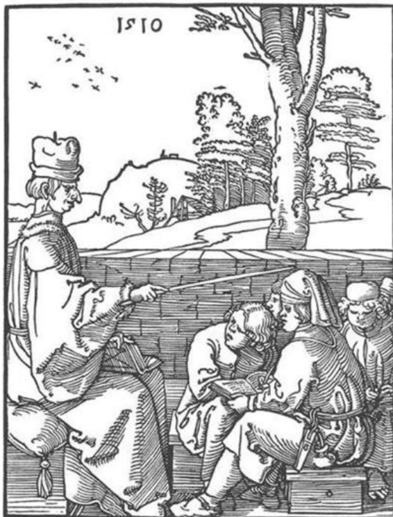
6. ábra: Albrecht Dürer (1510): Iskolamester, fametszet, British Múzeum, London