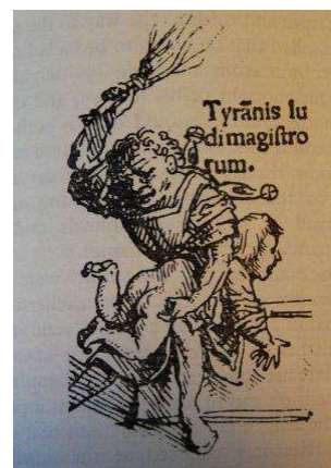
3–5. ábra: Rotterdami Erasmus (1515): A balgaság dicsérete, Ambrosius Holbein, 55. sz. illusztrációja, A szamár és a hárfa, toll és fekete tinta, Bázeli Szépművészeti Múzeum; ifj. Hans Holbein, 1. sz. illusztrációja Bolond a pulpituson, toll és fekete tinta, Bázeli Szépművészeti Múzeum; ifj. Hans Holbein, Az iskolamester tyrannisa, toll és fekete tinta, Bázeli Szépművészeti Múzeum