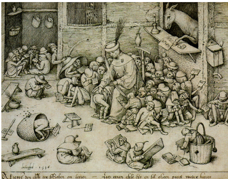
2. ábra: id. Pieter Brueghel: Szamár az iskolában, 1556., toll és tus, Staatliche Museum, Berlin

A humorosnak ható képet 1556-ban alkotta id. Pieter Brueghel. Az iskola és iskoláztatás ilyen típusú ábrázolásmódja azonban nem előzmény nélküli a 16. században, gondoljunk csak Holbein Erasmus ihlette iskolaábrázolására. Erasmus ugyanis azt vallotta, hogy a gyermek „állati alakot vesz fel, ha nem alkotunk emberi formát belőle” (Erasmus, 1529). Brueghel gondolatai a protestánsok szerint oly sürgető iskolareformok