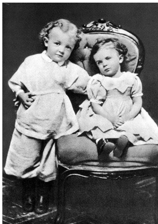
2. kép: A 4 éves Vlagyimir Uljanov, testvérével, Olgával. Szibíriában, 1874. (Fényképész: E. L. Zhakrzhevskaya) Forrás: https://www.marxists.org/archive/lenin/photo/family/012.htm .

A második fénykép az eredeti, amelyből kivágták Lenin portróját (az első fotót) – ez utóbbi, a gyermek Lenin képmása terjedt aztán el. A portré a festészettől örökölt műfaja a fotográfiának, a 19. század második felében a gazdagodó középosztály önnön jelentősége megörökítésére rendelt hasonló képeket, ami