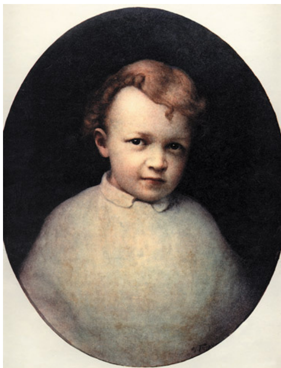
4. kép: Ivan Parkhomenko: V. I. Lenin 4 éves korában. (1920-as évek)

Magyar példa szintén említhető a hasonló irányú transzformációra: Endrődy-Nagy Orsolya hívja fel a figyelmet a folyamatra, melynek során a Petőfiről készült híres dagerrotípiá több lépésben átalakult Orlay Petrich Soma és Egerváry vásznán festményre ( Endrődy-Nagy , 2015. 74. o.). Általában a festményekről készített reprodukciók, fényképek jelezték a két médium közti átfordíthatóságot és ennek problematikáját ( Benjamin , 1966), az ellenkező irányú váltás (fotóból festmény) az eredeti történeti alak műalkotássá lényegülését jelentheti, egy másfajta, szakrális valóságba történő áthelyezést. Petőfi és Lenin személyisége, reprezentációs tere jól tükrözi a különböző szinteken való létezés lehetőségét, a valóságos és mitikus síkok egymásba folyását. A Leninről készített eredeti festmény a negyedik kép.