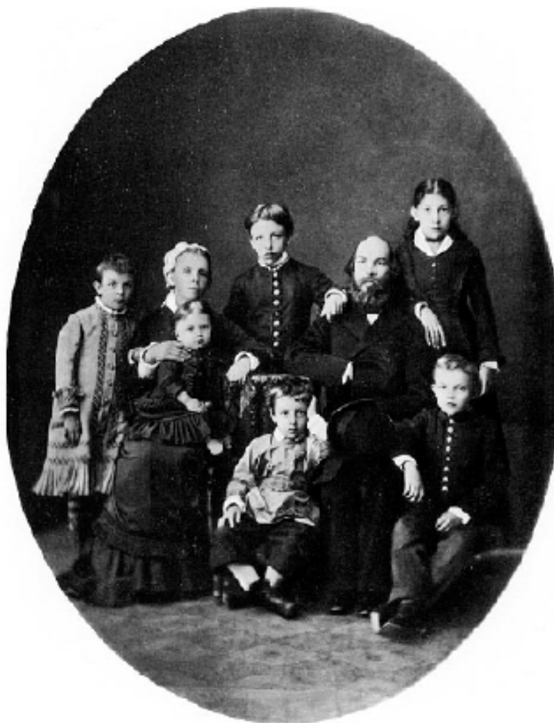
5. kép: Az Uljanov család: Maria Alexandrovna, Ilja Nikolajevics és gyermekeik: Olga, Maria, Alexander, Dimitrij, Anna, Vlagyimir. Szimbirszk, 1879. (Lenin jobb szélén ül).

Forrás: https://www.marxists.org/archive/lenin/photo/family/009.htm