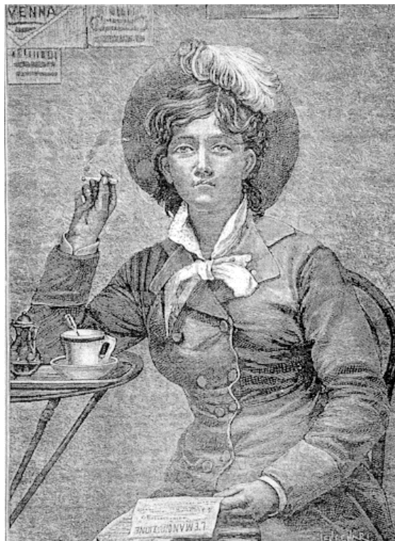
2–3. kép: Az elveszett turnőr;

— Nem vesztede el nagysád valamijét a nőgyelet közvacsoráján? mert én találtam ám valamit! — Karpereczem, fülbevalóm, melltám s minden egyéb értékes holmim megvan; a mit elvesztettem csekélység lehet. — Az ám, csekélység?! Akkora, mint egy madrac !!!