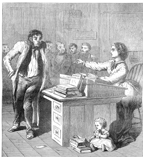
7. kép: Női békebíró Amerikában

fellépő újságírók és rajzolók kezében mindig az egyik legfontosabb ütőkártyát jelentette a gyermek sorsa feletti aggodás. A rajzolók véleménye szerint a feministák elveszítik nőies vonásaikat, nem törődnek gyerekeikkel, ruházatukkal és nagyon csúnyák. Ezzel a negatív nőábrázolással a rajzokon és az írásokban szembeállították a légiés, nőies, szép és bájos nő alakját, aki anya és feleség, és nincs „megrontva” az emancipátorok szellemiségével. Egyes írásokból is kiderül az, amit a rajzok is sugallnak, hogy csak „csúnya” nők és vénlányok lesznek a női jogok szószólóivá, mert a szép nők férjhez mennek, és férjük oltalmán kívül nincs szükségük „jogokra”.