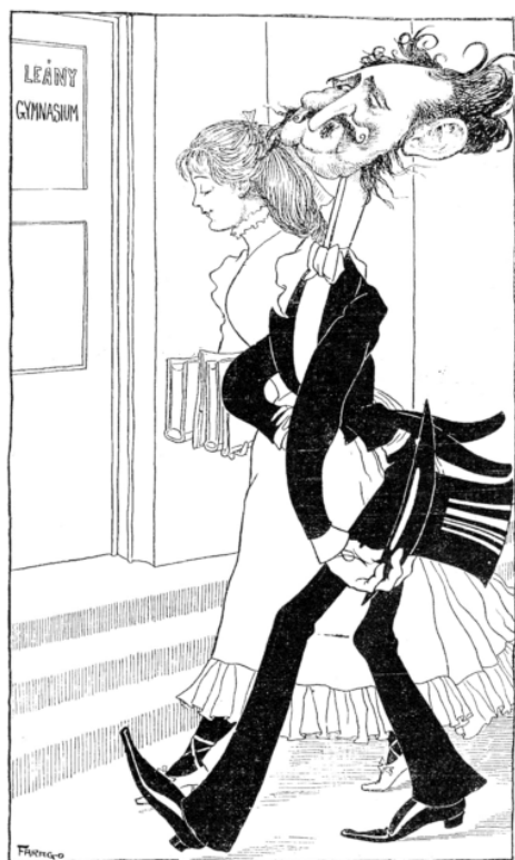
10. kép: A leánygimnázium felavatása

A leánygimnáziumok megnyitását, a lányok érettségi vizsgára bocsátását is számos gúnyrajz kísérte több országban, így hazánkban is. Az alábbi, a századvégen született rajz nem csupán az érettségi vizsgára vágyakozó nőket, hanem a gimnáziumi tanulás lehetőségét és több egyetemi kart előttük megnyitó Wlassics Gyula kultuszminisztert is kifigurázta (10. kép).