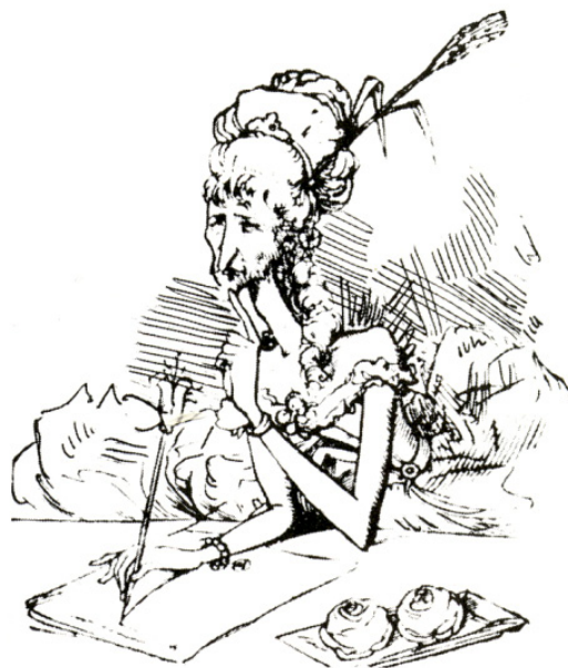
Lengenádfalvay Kotlik Zirzabella

A Borsszem Jankó gúnyos hangvételű „honleányi levelének” megfogalmazója talán nem is gondolt arra, hogy a nőies tevékenységekkel miféle „férfias” cselekedeteket állított szembe: a háztartást vezető, anyai hivatását betöltő nőkkel szemben a cikk (és sok más, hasonló tartalmú írás és kép) szerint az italozó, káromkodó, háborúzó férfiakat ábrázolta. Az Új Idők egy 1898-as, Faragó József által készített karikatúráján pedig még több „férfias” tevékenység közepette láthatjuk a nőt. Biliárdozik, iszik, parancsolgat és dohányzik, kártyázik, újságot olvas. Tulajdonképpen csak a szoknyája különböztetné meg a férfiaktól, ha nem lenne mellén egy szopó kisgyermek (6. kép).