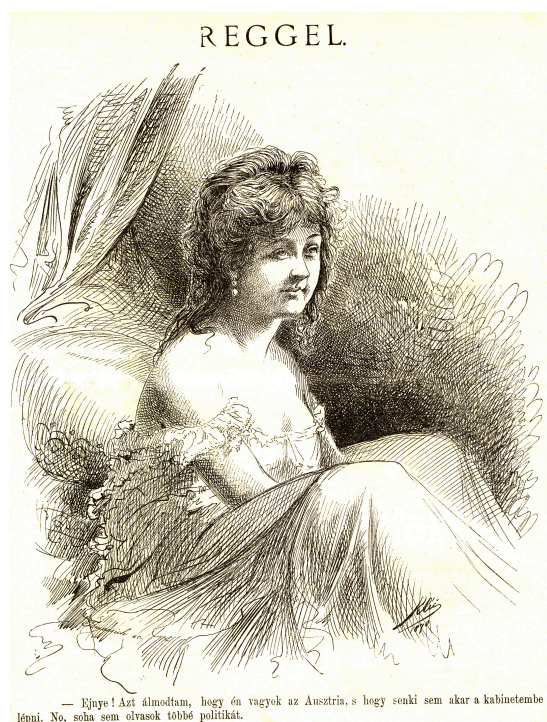
12–13. kép: Országközi rajzolatok II.; Reggel