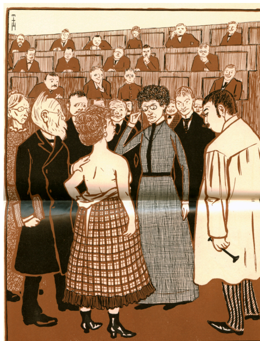
11. kép: Thomas Theodor Heine karikatúrája a Simplicissimus című egyik lap 1901-es számában

Az egyetemekre lépő nők még inkább a gúnyrajzok célpontjai voltak. Egy 1901-ben (az első német egyetem nők előtt történt megnyitását követően) született német karikatúrán a bemutatott medika nem csupán csúnya (mint a tanult és emancipált nők mind a legtöbb korabeli gúnyrajzon), hanem butácska is, aki nem tud kilépni női mivoltából, hiszen a vizsgálatra elé lépő páciensen nem a betegség tüneteit kutatja, hanem a ruházatára tesz megjegyzést (11. kép).