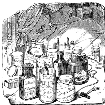
8. kép: Die Frau in der Karikatur...