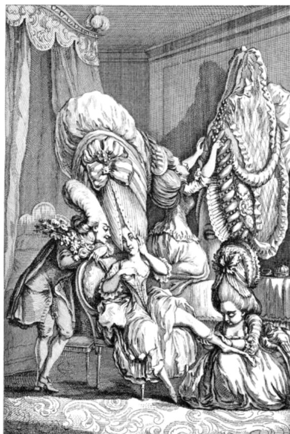
LA BRILLANTE TOILETTE DE LA DEESSE DU GOUT

A karikatúrák több csoportra oszthatók. Az ábrázolások egyik gyakori témája volt (már a középkortól kezdve!) a női ruha, a női divat. Az abroncsos szoknya, a fűző, a turnúr, a kalapok és frizurák kifigurázása állandóan megihlette a rajzolókat, akik a női külsőt, azaz a külsőségekre túl sokat adó nőt tették így mulatságossá (l. erről például: Kybalová, Herbenová és Lamarová , 1977) (1. kép és 2. kép).