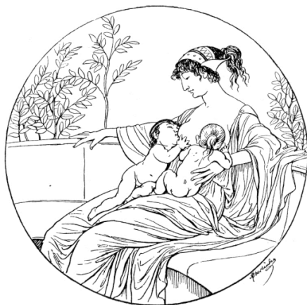
Lebensbilder aus Alt-Athen und Spar-Athen: Die Ernährung

A karikatúrák között külön csoportot alkotnak a tanuló (tanulni vágyó), magukat művelő lányokról, nőkről készült korabeli gúnyrajzok. Egy 19. század végén készült német karikatúra készítője (a „régis és modern Athén” rajzsorozat darabjaként) összevetette a nőnevelés hagyományos (háziasszonyi szerepekre felkészítő) eszményeit az új, magán-nevelőintézetbe járó lányok képével, akik divatos ruháikban járni is alig tudnak, és a kép felirata szerint (mint a században közülük oly sokan) zenét tanulnak (9. kép).