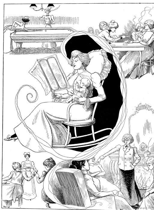
6. kép: Asszonyok klubja

A gyermek az egyik 1872-es magyar lapban ábrázolt, amerikai hölgy mellett is ott ült már, míg ő éppen bírósági tárgyalást vezet. Hazánkban akkoriban az efféle foglalkozás nők számára elképzelhetetlen volt (7. kép). Több karikatúra fejezte ki azt a közvélekedést is, hogy az emancipált nők nem lesznek jó anyák, és gyermekeiket egyáltalán nem fogják szoptatni (ha véletlenül szülnek). A régi és az új Athént mutatja be az a német karikatúra, amely a 19. század vége körül keletkezett, és a természetes, anyatejes táplálást állítja szembe a 19. századi ’modern’, (gyógy) tápszeres babaetetéssel (8. kép).