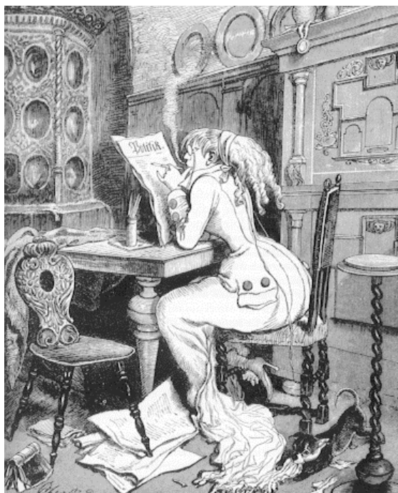
4–5. kép: Német emancipált nő egy angol karikatúrán; Honleányi levél Egloffstein bárónéhez