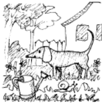
Van egy kutya a kertben.