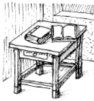
Van két könyv az asztalon.

There _____ one desk in the classroom. There _____ five chairs in the classroom. There _____ a cat in the garden. There _____ two children at the bus stop. There _____ milk in the fridge. There _____ three apples on the table.