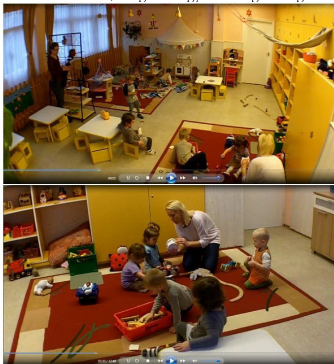
1. ábra: A bölcsődei csoportszobában használt két videokamera képe

Kérdés, hogy az így nyert két videofelvételt hogyan érdemes használni az elemzéskor. Egy lehetséges megoldás, hogy a két felvételt