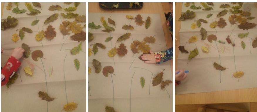
12–14. ábra A mi fánk