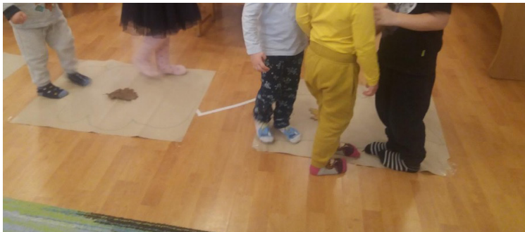
6. ábra Csoportban