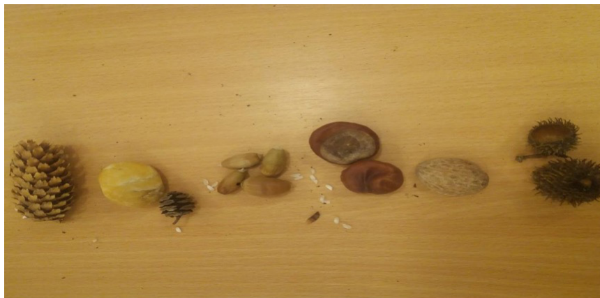
7–11. ábra Kincskeresés