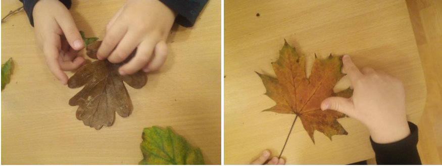
3–4. ábra Kézügyesség