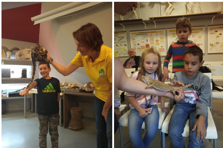
2–5. kép Állatsimogatás