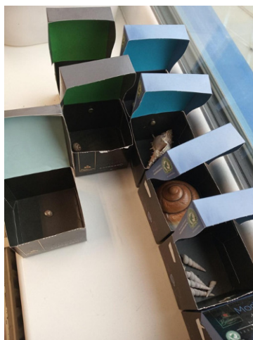
10. kép Csigaházgyűjtemény

Az új ismeretszerzést előzetes gyűjtőmunkával (különbéle csigaházak kiállítás, rendszerezése), előismeretek mozgósításával és felhasználásával támogatjuk. (10. kép)