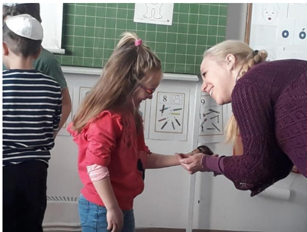
9. kép Szeretnéd megérinteni?

Az új ismeretszerzést előzetes gyűjtőmunkával (különbéle csigaházak kiállítás, rendszerezése), előismeretek mozgósításával és felhasználásával támogatjuk. (10. kép)