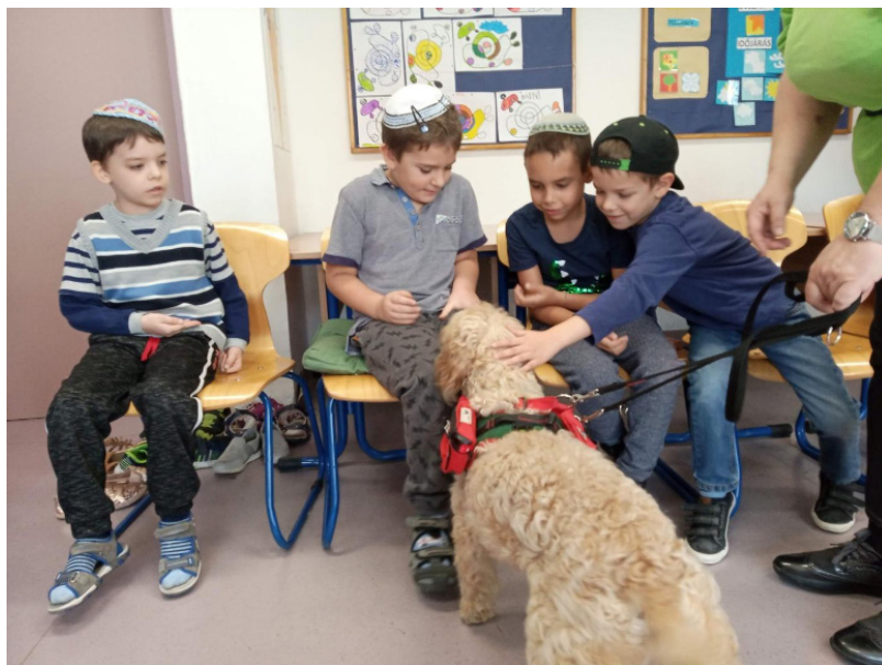
1. kép Érzékenyítő nap