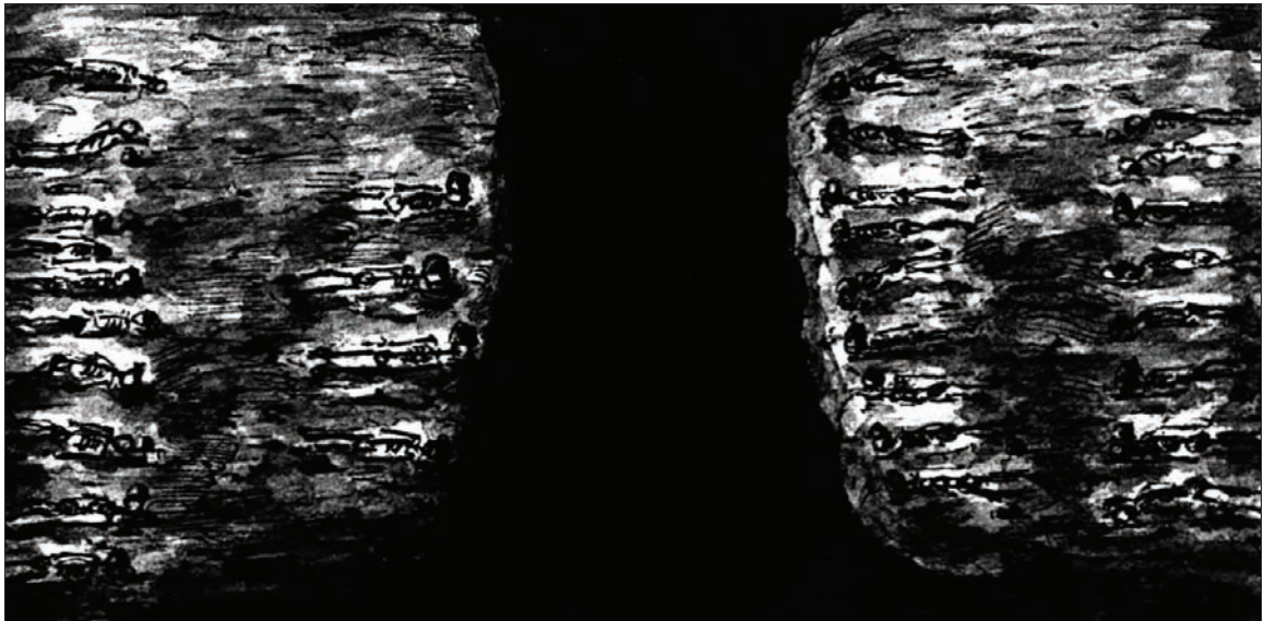
6. kép. A Temetkezési folyosó sírjai (NYÁRY 1881, III. tábla, Temetkezési folyosó alaprajza).

Csak Nyáry Jenő első ásatásaiból közel 70 egyén maradványaira utaló feljegyzéseket számolhatunk össze: 41 sír + 26 állkapocs és koponya (6. kép).