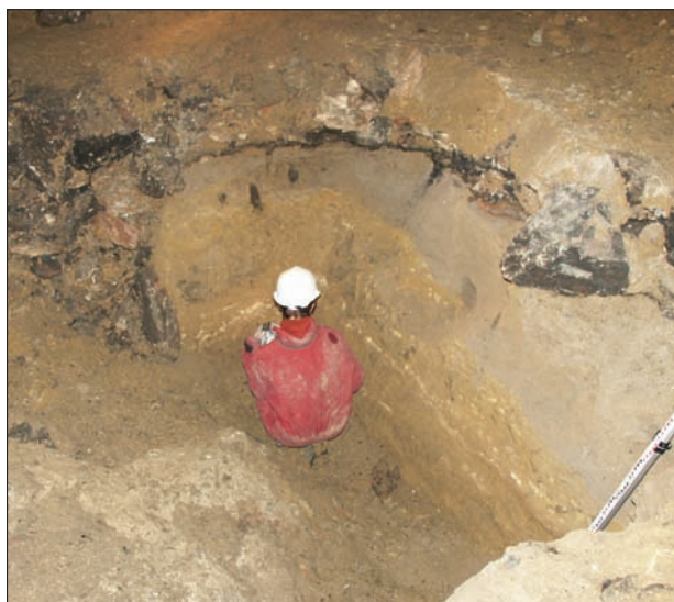
3. kép. Egykori régészeti feltárás gödre a barlangban. Fig. 3. Former archaeological excavation pit in the cave.

az alapjai a bükki kultúra „barlangi települése” toposzának. 15 Noha a Baradla rendkívüli mennyiségű újkőkori leletet szolgáltatott, és a kiépített turistautak mentén ma is szép számmal találhatóak cölöpnymok, többretegű tüzelőhelyek, 16 nincs olyan egyértelmű adat, amely azt támasztaná alá, hogy az újkőkori folyamán funkcionálisan települési térként használták volna a barlangot (3. kép). Ez természetesen rövidebb-hosszabb időre, egy-egy rendkívüli esemény (időjárás, háborús konfliktus) kapcsán nem tartható kizártnak, ám inkább csak kivételként értelmezhető. De hogyan magyarázható akkor a barlangból előkerülő nagy mennyiségű tárgyi lelet és a felsorolt objektumok?