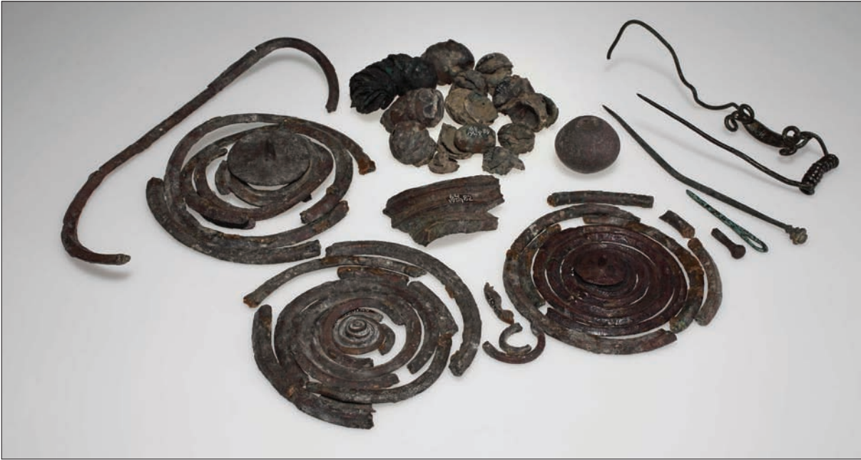
9. kép. Tompa Ferenc feltárásának leletei, égett bronztárgyak. Fig. 9. Findings of Ferenc Tompa's excavation, burnt bronze objects.

szögelléséből került elő, de valószínűleg föld alá volt temetve. Összetétele és helyzete alapján alapos okunk van feltételezni, hogy nem egyszerűen egy elrejtett kincsről, hanem áldozati adományról van szó. 57