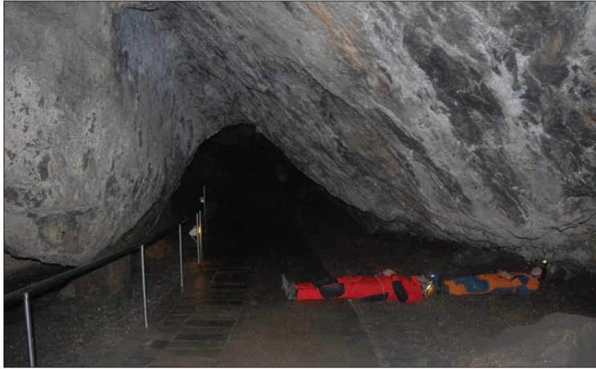
7. kép. A Temetkezési folyosó valós mérete.

szerint azonban az egyik olyan koponya, amely igen nagy biztossággal köthető a Nyáry-ásatásokhoz 36 a konvencionális 14 C kor szerinti 2908±32 BP (1190–1030 cal BC) eredményt hozott, ami jól korrelál az ismert Kyjatice-dátumokkal.