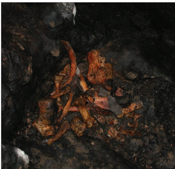
4. kép. Emberi maradványok, Hangversenyterem. Fig. 4. Human remains, Concert Hall of cave Baradla.