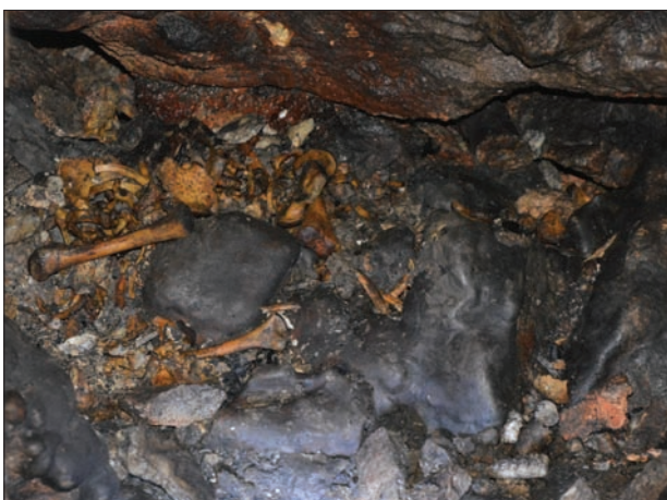
5. kép. Emberi maradványok, Róka-ág. Fig. 5. Human remains, 'Fox' branch of cave Baradla.

tő, hogy már lebomlott állapotban helyezték el a halottakat. Egy esetben talákoztunk ennek a kormeghatározásnak ellentmondó adattal: a Matyó rojtnál talált egyik csonton rézoxid okozta elszíneződést említ a leírás. 23 Az előadás elhangzása és a tanulmány megjelenése közötti időben azonban 14 C vizsgálatokra került sor, így most már tudjuk, hogy a Róka-ágban talált két vázmaradvány biztosan nem az újkőkorhoz, hanem a tatárjárás korához köthető!