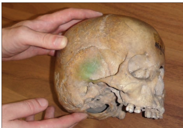
8. kép. A 31-es leltári számú koponya (Magyar Természettudományi Múzeum, Embertani Tár). Fig. 8. Skull, Inv. No. 31 (Hungarian National History Museum, Department of Anthropology).

Nyáry megfigyelésein túl további bizonyítékaink is vannak arra nézve, hogy rituális cselekmények történtek a barlangban. 1929-ben Tompa végzett feltárást a Csontház-teremben, ahol többek között egy bronzkincslet is előkerült: ívelt élű bronz lándzsahegy, bronz hárfafibula, keresztrovátkás bronz karkötő, egy kézfejtető bronztekercs és más bronztárgyak. A kincsleten egyértelműen felfedezhetőek voltak az égés nyomai (9. kép). A bronztárgyak előkerülési helyéhez közel egy csontvázás sírra bukkantak. A sírban a halott ujján egy lapos, bronzhuzalból készült, spirális gyűrűt találtak. 52 Noha a két lelet összetartozására nincs bizonyíték, és a Tompa által felvetett „harcos” sírja feltevés is több sebből vérzik (a Tompa által páncélpitykéknek gondolt maradványok biztosan nem azok), az égés- és szándékos rongálásnyomok az egyes darabokon egyértelműen rituális cselekményre utalnak.