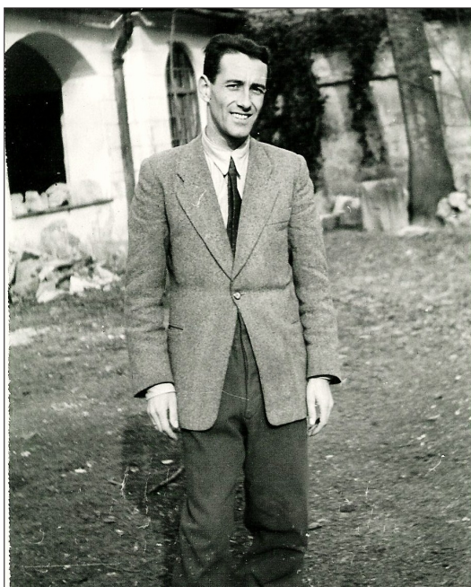
Fig. 3. In the courtyard of the Museum of Visegrád, 1953.

scholars and of the interested public to the significance of the Danube bend limes. 2 On account of the XIth International Limes Congress, which was organized in 1976 in Hungary, he presented the finds and objects of his excavations of 25 years at the temporary exhibition „Roman fortification system in the Danube bend” in the Salamon tower of the King Matthias Museum (Mátyás Király Múzeum) at Visegrád.