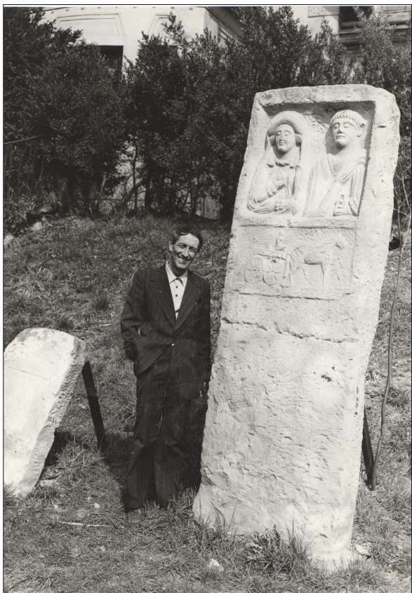
Fig. 7. At one of the tombstones of the Roman Lapidary at Szentendre, 1974.

Soproni started the excavations of one of the most prominent inner fortifications of Valeria, i.e., the fort of Alsóhetény in the 1960s. In the 90s, he participated in the research of the Roman bridge head at Bölcske. Besides studying the limes, he was dealing with Roman stone relics with inscriptions as historical sources, and also with the geographical and settlement relations of ancient Pannonia. He was an author of the fifth volume of the series „Die römische Inschriften Ungarns” publishing Roman stones with inscriptions from Szentendre and its surroundings (Fig. 7).