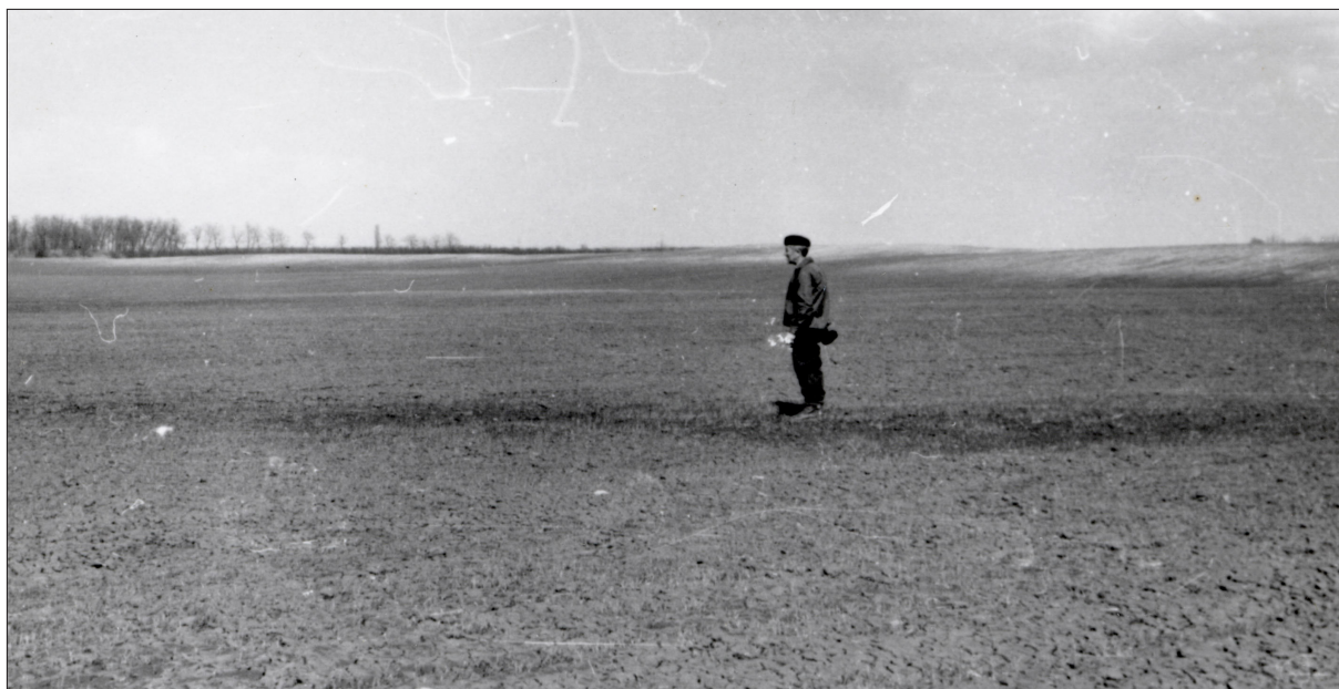
Fig. 6. At the site survey of the Csörsz ditch.

Besides his research on the Danube bend, Sándor Soproni also participated in the study of the linear ditches of the Hungarian plain, together with Éva Garam and Pál Patay ( Fig. 6 ). 5