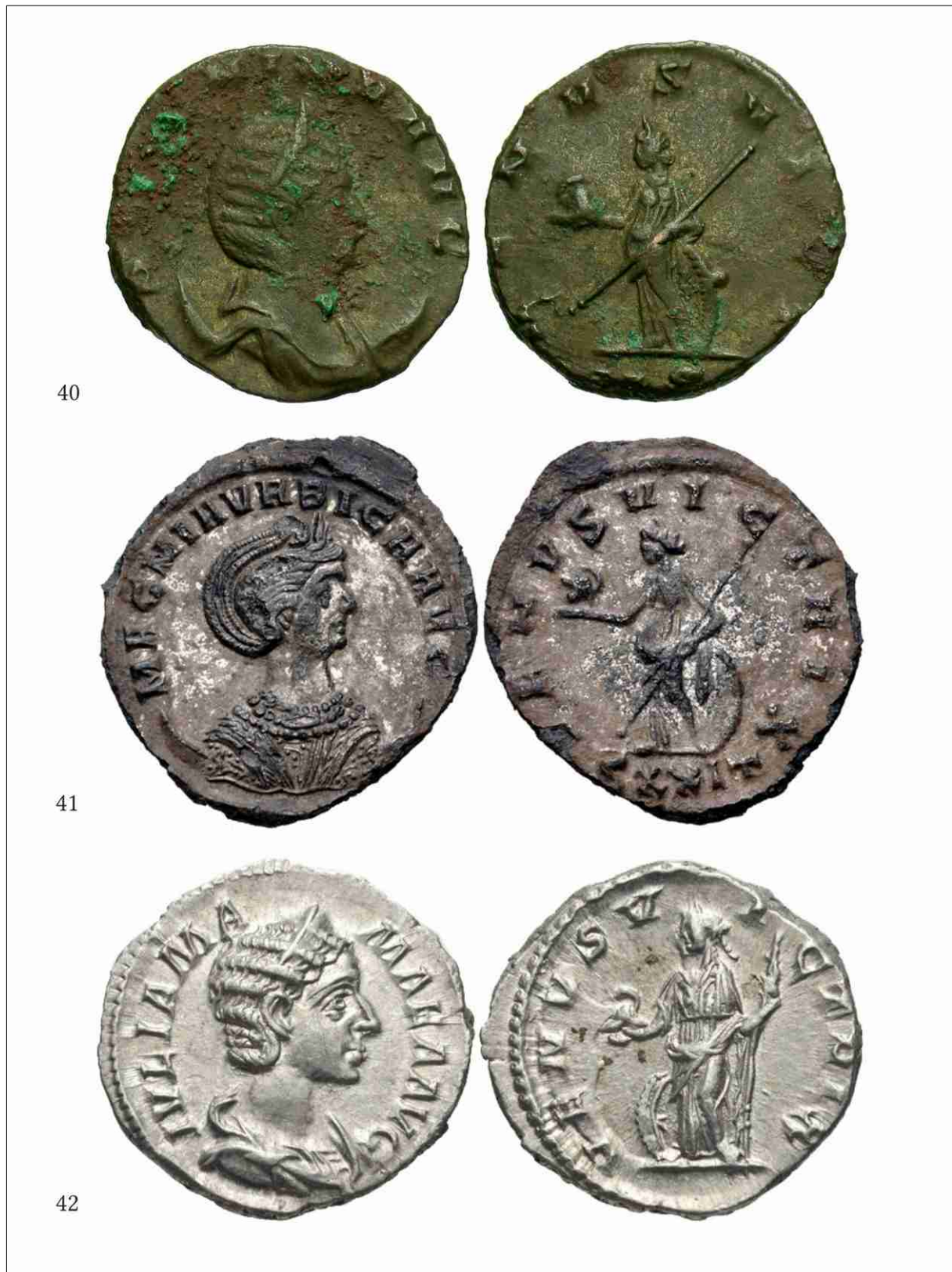
Fig. 14. 40. Saloninas Antoninian, Mediolanum, während der Alleinherrschaft des Gallienus, RIC V/1 198.67. ( http://www.coinproject.com/siteimages/33-salo-049-zzz-obv.jpg und 3-salo-049-zzz-rev.jpg , 2014.08.27.); 41. Antoninian von Magnia Urbica, Ticinum, während der Regierung des Carinus, RIC V/2, 185.347. ( https://www.cngcoins.com/Coin.aspx?CoinID=264902 , 2014.08.27.); 42. Denar der Kaiserin Iulia Mamaea, Rom, während der Regierung des Severus Alexander, RIC IV/2, 99.358. ( https://www.cngcoins.com/Coin.aspx?CoinID=148706 , 2014.08.27.).