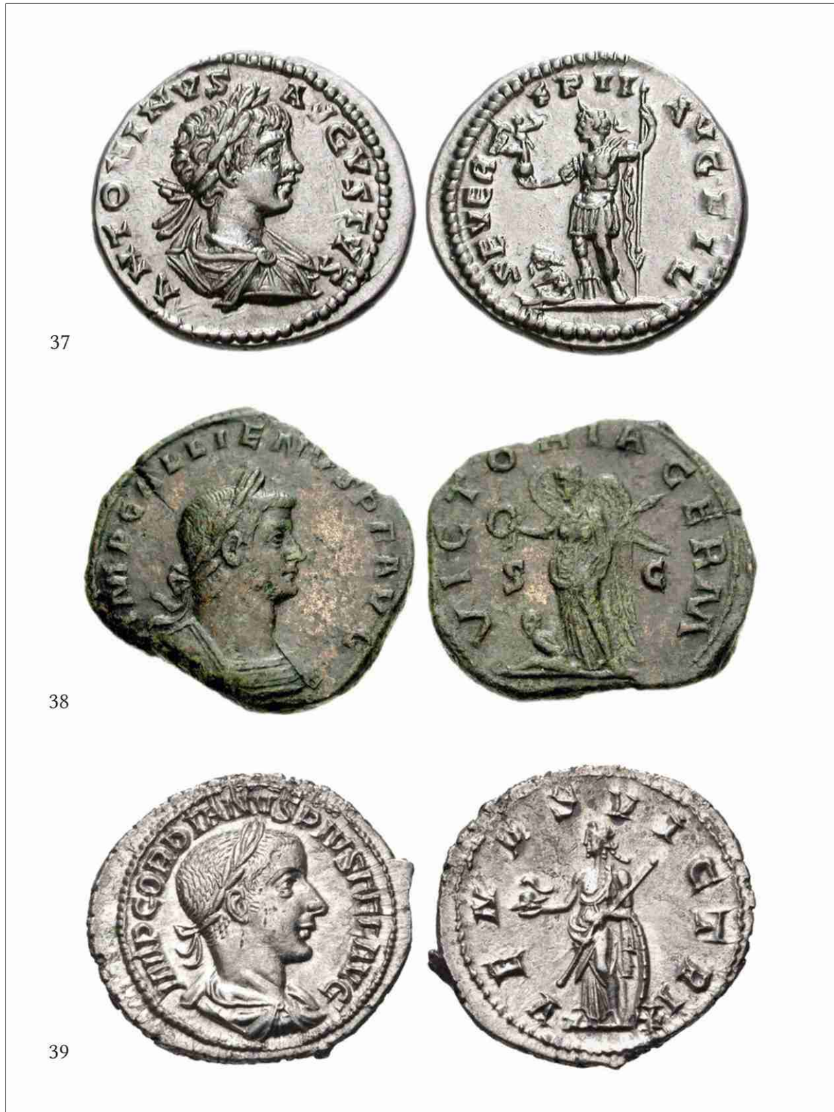
Fig. 13. 37. Caracallas Denar, Rom, während der Regierung des Septimius Severus, RIC IV/1, 219.45. ( https://www.cngcoins.com/Coin.aspx?CoinID=130674 , 2014.08.24.); 38. Sesterz des Gallienus, Rom, während der Alleinherrschaft des Gallienus, RIC V/1, 165.400. ( https://www.cngcoins.com/Coin.aspx?CoinID=85464 , 2014.08.24.); 39. Denar des Gordianus III., Rom, während der Regierung des Gordianus III., RIC IV/3, 28.131. ( https://www.cngcoins.com/Coin.aspx?CoinID=217494 , 2014.08.27.).