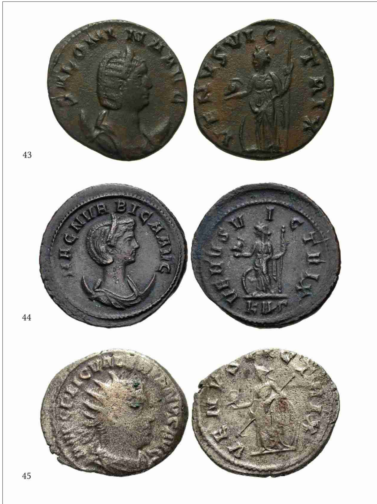
Fig. 15. 43. Saloninas Antoninian, Rom, während der Alleinherrschaft des Gallienus, GöBL 2000, Tab. 17/618. ( http://www.coinproject.com/siteimages/33-salo-121-zzz-obv.jpg und 33-salo-121-zzz-rev.jpg , 2014.08.27.); 44. Antoninian von Magnia Urbica, Rom, während der Regierung des Carinus, RIC V/2, 184.343. ( https://www.cng-coins.com/Coin.aspx?CoinID=217511 , 2014.08.27.); 45. Antoninian des Valerianus, Viminacium, während der Samtherrschaft des Valerianus und des Gallienus, RIC V/1, 55.222. ( http://www.coinproject.com/siteimages/70-23073q00.jpg , 2014.08.28.).