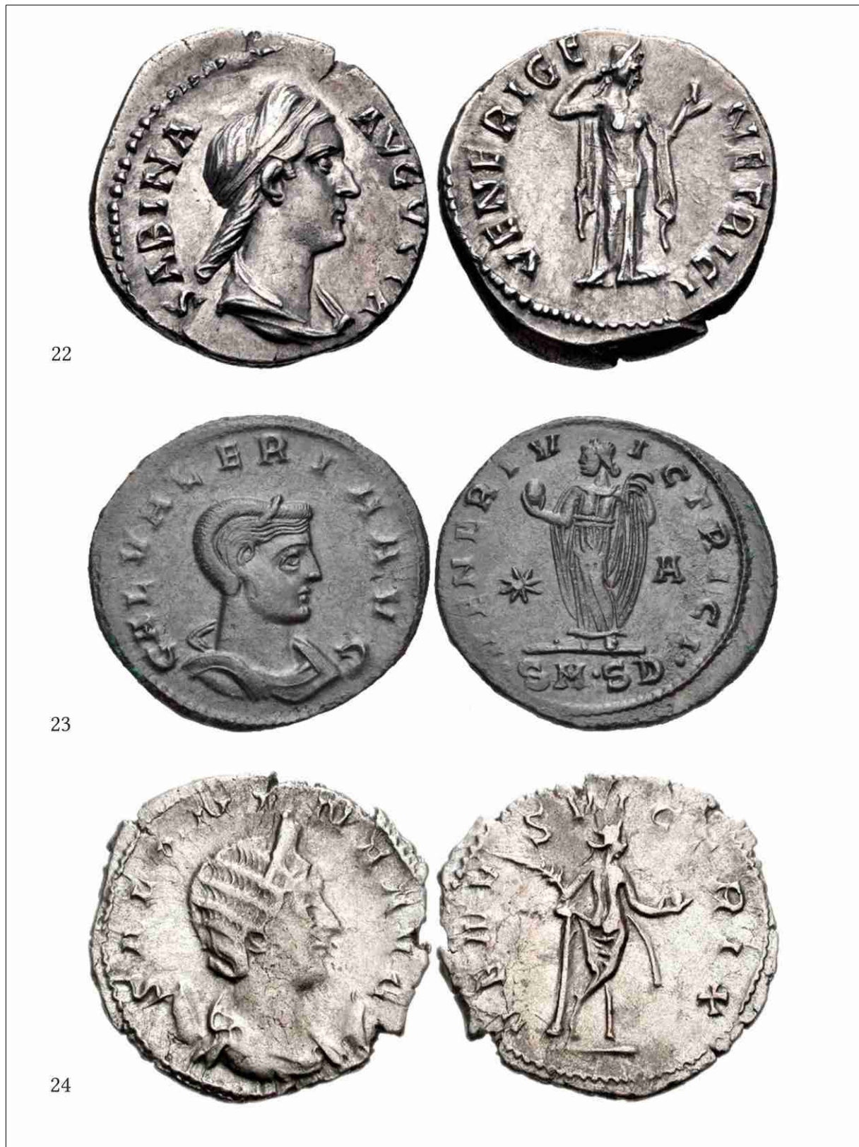
Fig. 8. 22. Sabinas Denar, Rom, während der Herrschaft des Hadrianus, RIC II, 387.396. ( https://www.engcoins.com/Coin.aspx?CoinID=249945 , 2014.08.23.); 23. Follis von Galeria Valeria, Serdica, in den Jahren 307-308, RIC VI, 500.41. ( https://www.engcoins.com/Coin.aspx?CoinID=150042 , 2014.08.23.); 24. Saloninas Antoninian, Colonia Claudia Ara Agrippinensium, während der Samtherrschaft des Valerianus und des Gallienus RIC V/1, 108.8. ( https://www.engcoins.com/Coin.aspx?CoinID=118699 , 2014.08.23.).