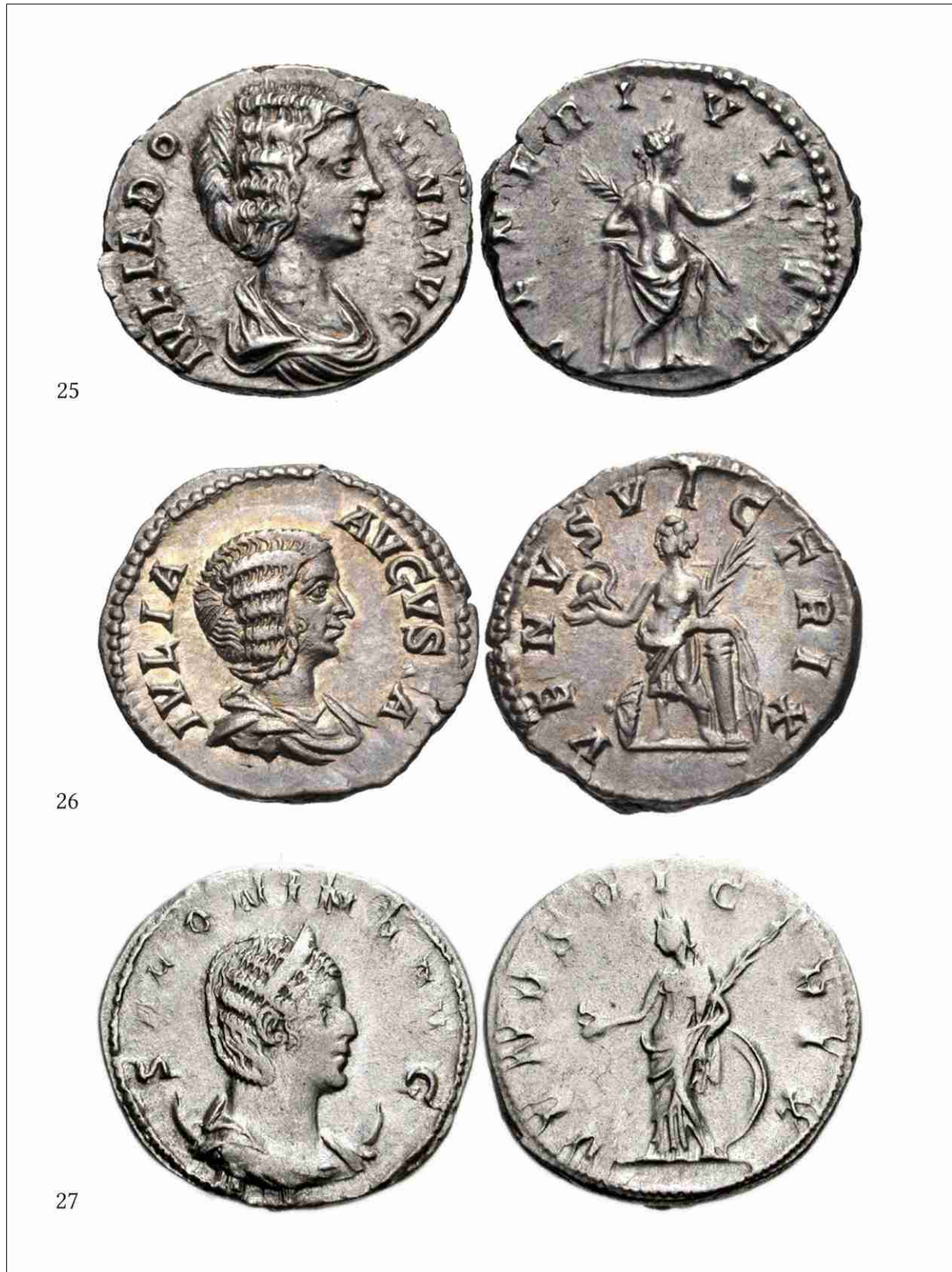
Fig. 9. 25. Denar von Iulia Domna, Rom, während der Herrschaft des Septimius Severus. RIC IV/1, 165.536. ( https://www.cngcoins.com/Coin.aspx?CoinID=166645 , 2013.08.23); 26. Denar von Iulia Domna, Rom, während der Herrschaft des Septimius Severus, RIC IV/1, 171.581. ( https://www.cngcoins.com/Coin.aspx?CoinID=202532 , 2014.03.17); 27. Saloninas Antoninian, Antiochia, während der Samtherrschaft des Valerianus und des Gallienus, RIC V/1, 115.68. ( https://www.cngcoins.com/Coin.aspx?CoinID=118695 , 2014.08.23.).