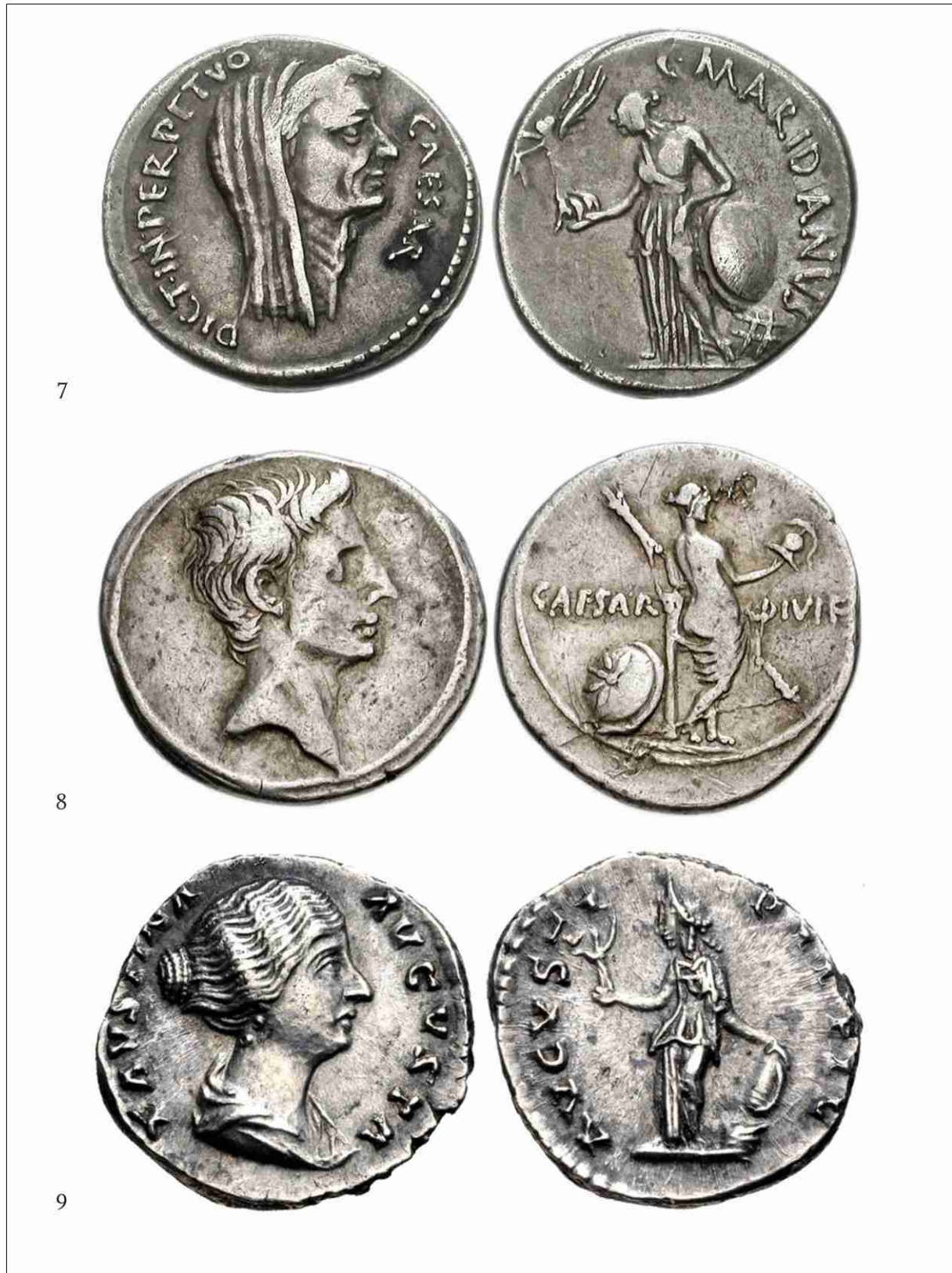
Fig. 3. 7. Republikanischer Denar, Rom, 44 v. Chr., CRAWFORD 1991, 490.480/15. ( https://www.cngcoins.com/Coin.aspx?CoinID=131696 , 2014.08.21.); 8. Denar des Octavianus, unbestimmte Münzstätte in Italia, 32–29 v. Chr., RIC I (2), 59.250a ( https://www.cngcoins.com/Coin.aspx?CoinID=123970 , 2014.08.22.); 9. Denar Faustina, der Jüngeren, Rom, während der Regierung des Antoninus Pius, RIC III, 93.495. ( https://www.cngcoins.com/Coin.aspx?CoinID=251895 , 2014.08.22.).