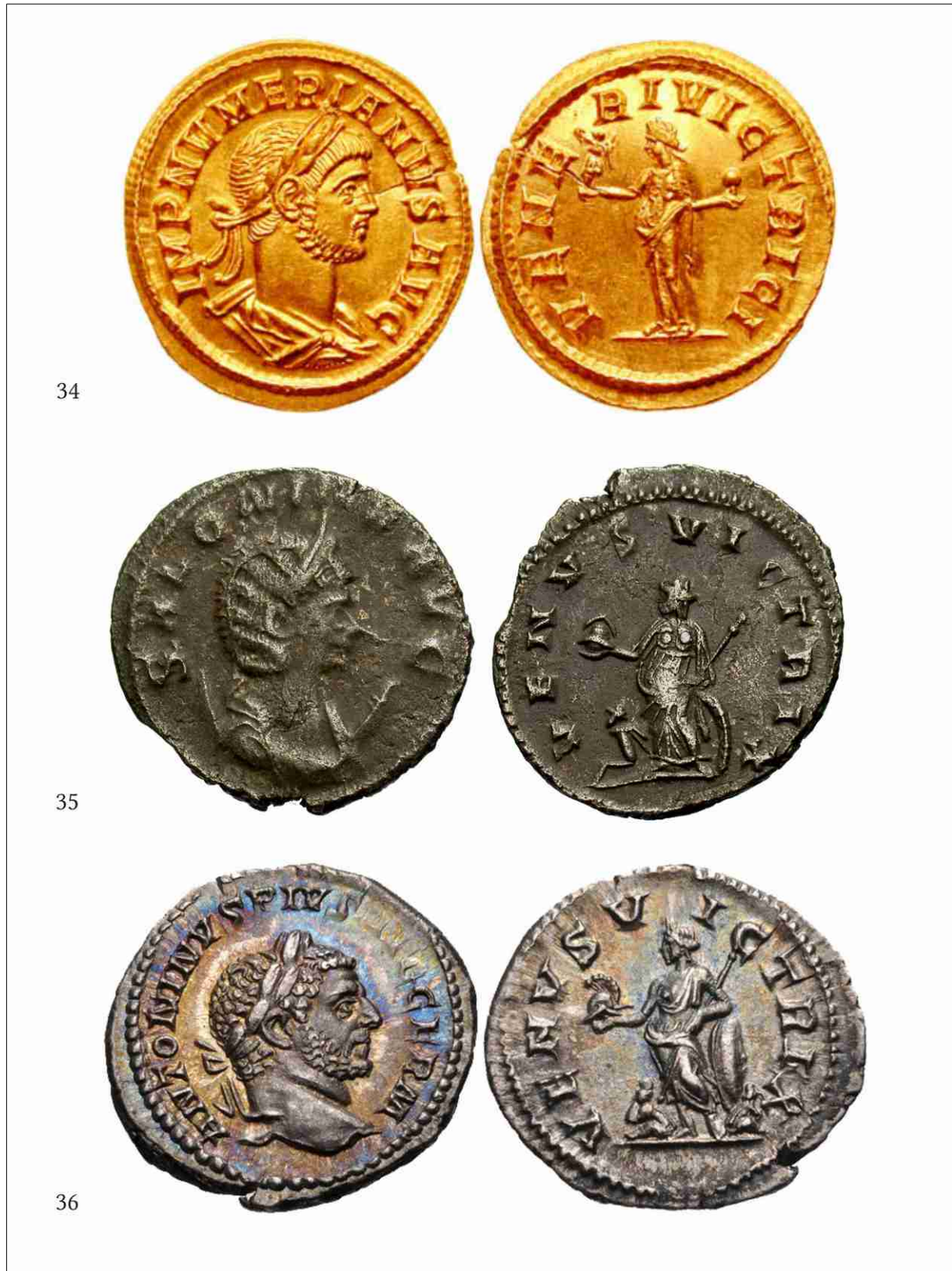
Fig. 12. 34. Aureus des Numerianus, Rom, während der Regierung des Numerianus, RIC V/2, 195.405. ( http://wildwinds.com/coins/ric/numerian/RIC_0405.jpg , 2014.08.23.); 35. Salonina Antoninian, Rom, während der Alleinherrschaft des Gallienus, GöBL 2000, Tab. 13/506. ( http://www.coinproject.com/siteimages/33-salo-080-zzz-obv.jpg und 33-salo-080-zzz-rev.jpg , 2014.08.24.); 36. Caracalla Denar, Rom, während der Herrschaft Caracallas, RIC IV/1, 259.312d. ( https://www.cngcoins.com/Coin.aspx?CoinID=197662 , 2014.08.24.).