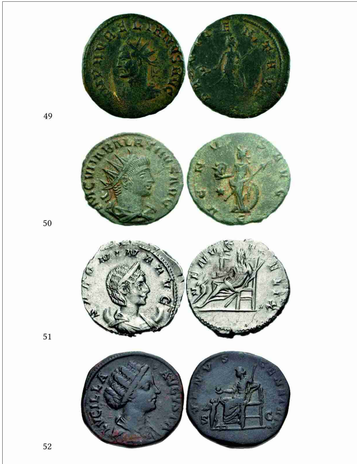
Fig. 17. 49. Antoninian des Aurelianus, Cyzicus, während der Herrschaft des Aurelianus, RIC V/1, 302.335. ( http://www.coinproject.com/siteimages/48-RI1311-Aurelian%20Cyzicus%20RIC%20335%20NMM.jpg , 2014.08.28.); 50. Antoninian des Vabalathus, während der Herrschaft des Aurelianus, RIC V/2, 585.5. ( https://www.cngcoins.com/Coin.aspx?CoinID=115406 , 2014.08.28.); 51. Saloninas Antoninian, Colonia Claudia Ara Agrippinensium, während der Samtherrschaft des Valerianus und des Gallienus, RIC V/1, 108.7. ( https://www.cngcoins.com/Coin.aspx?CoinID=118694 , 2014.08.28.); 52. Lucillas Sesterz, Rom, während der Regierung des M. Aurelius, RIC III, 355.1778. ( https://www.cngcoins.com/Coin.aspx?CoinID=207208 , 2014.08.28.).