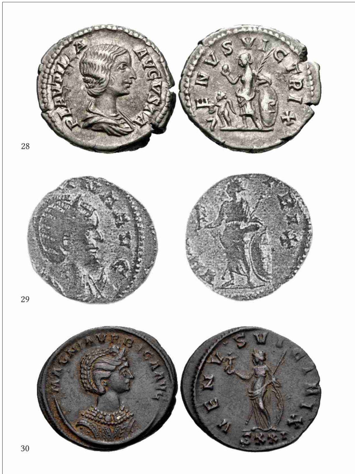
Fig. 10. 28. Plautillas Denar, Rom, während der Herrschaft des Septimius Severus, RIC IV/1, 270.369. ( https://www.engcoins.com/Coin.aspx?CoinID=168685 , 2014.08.23.); 29. Saloninas Antoninian, Siscia, während der Alleinherrschaft des Gallienus, GöBL 2000, Tab. 43/1471; 30. Antoninian von Magna Urbica, Ticinum, während der Regierung des Carinus, RIC V/2, 185.347. ( https://www.engcoins.com/Coin.aspx?CoinID=211580 , 2014.08.23.).