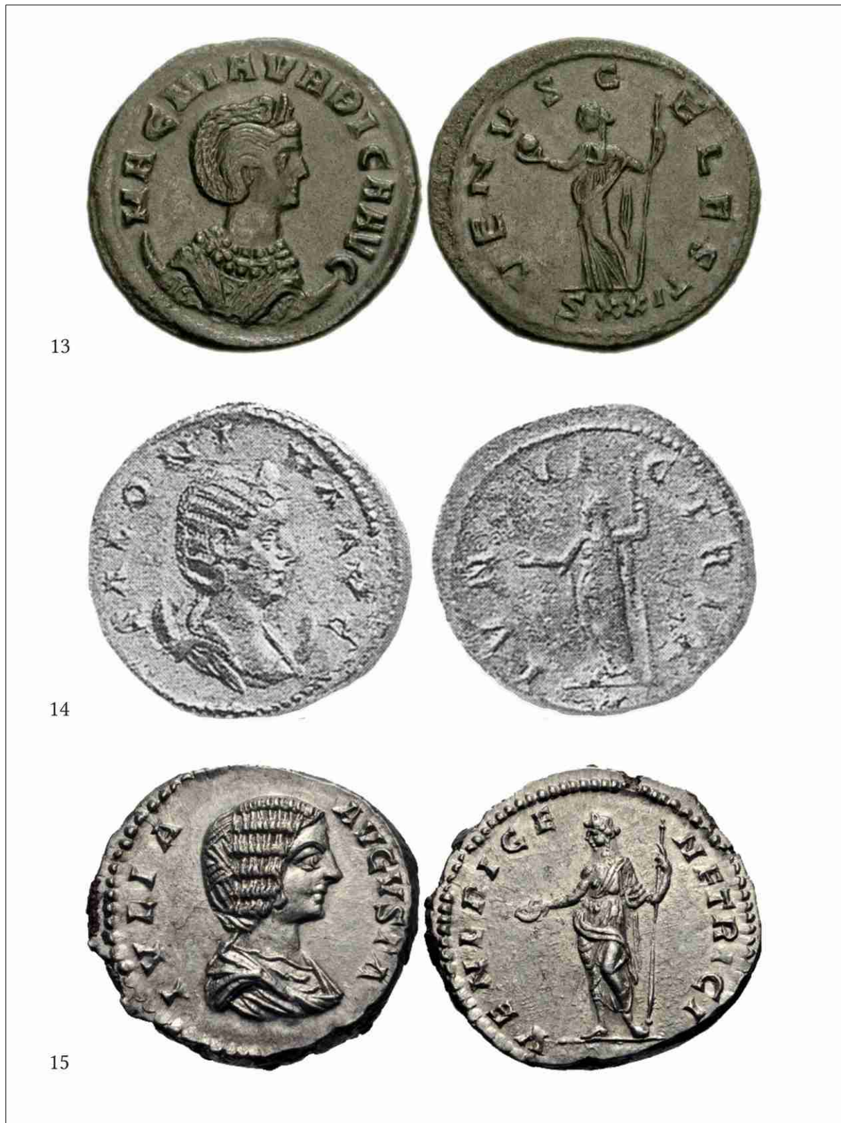
Fig. 5. 13. Antoninian von Magnia Urbica, Ticinum, während der Regierung des Carinus, RIC V/2, 185.345. ( https://www.cngcoins.com/Coin.aspx?CoinID=82199 , 2014.08.22.); 14. Saloninas Antoninian, Rom, während der Samtherrschaft des Valerianus und des Gallienus, GöBL 2000, Tab. 5/243; 15. Denar der Kaiserin Iulia Domna, Rom, während der Regierung des Septimius Severus, RIC IV/1 170.578. ( https://www.cngcoins.com/Coin.aspx?CoinID=156990 , 2014.08.22.).