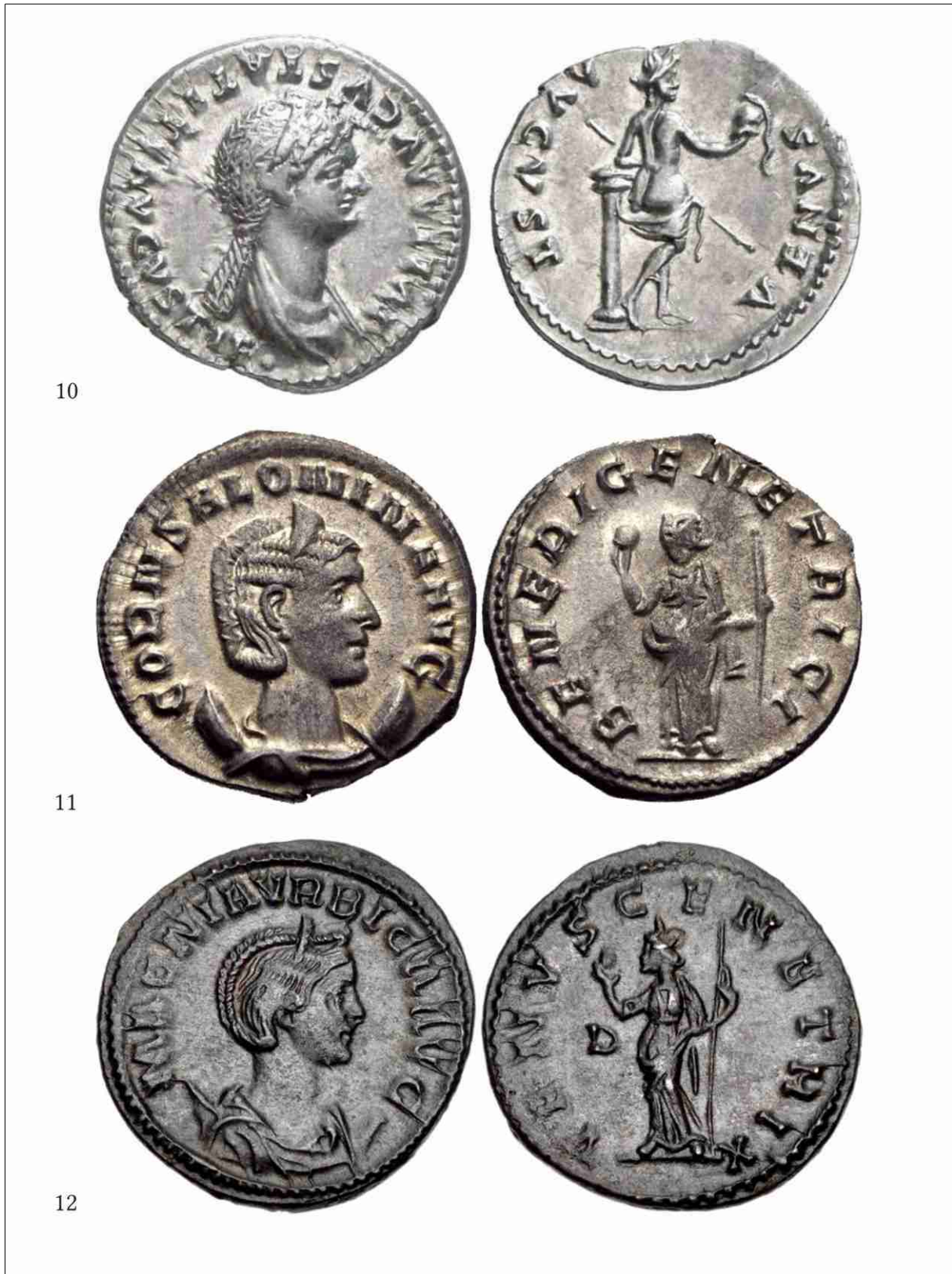
Fig. 4. 10. Denar der Kaiserin Iulia Titii, Rom, während der Regierung des Titus, RIC II, 122.56. ( http://www.lanzauctions.com/coin.php?b=erUiOPnwI4gCpkZCUDgzZP%2FVOxidwQZHQft2yNkT%2FOY%3D&a=axMT8TXcgF4iz2%2FrYq_Q7BT9u984k%2F%2B0WdwTO1aJXIOs%3D%23n3 , 2014.08.22.); 11. Saloninas Antoninian, während der Samtherrschaft der Kaiser Valerianus und Gallienus, RIC V/1, 114.61. ( https://www.cngcoins.com/Coin.aspx?CoinID=157074 , 2014.08.22.); 12. Antoninian von Magnia Urbica, Lugdunum, während der Regierung des Carinus, RIC V/2, 183.337 ( https://www.cngcoins.com/Coin.aspx?CoinID=242706 , 2014.08.22.).