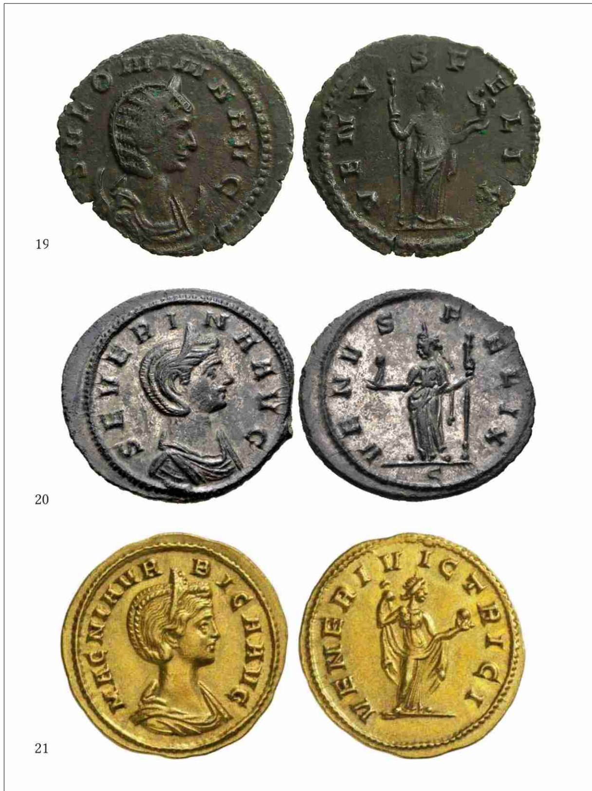
Fig. 7. 19. Saloninas Antoninian, Mediolanum, während der Alleinherrschaft des Gallienus, GöBL 2000, Tab. 33/1180 ( http://www.coinproject.com/siteimages/33-salo-103-zzz-obv.jpg und 33-salo-103-zzz-rev.jpg 2014.08.22.); 20. Severinas Denar, Rom, während der Herrschaft des Aurelianus, RIC V/1, 316.6. ( https://www.cngcoins.com/Coin.aspx?CoinID=213737 , 2014.08.23.); 21. Aureus von Magnia Urbica, Rom, während der Regierung des Carinus, RIC V/2, 184.340. ( http://wildwinds.com/coins/ric/magnia_urbica/RIC_0340.jpg , 2014.08.23.).