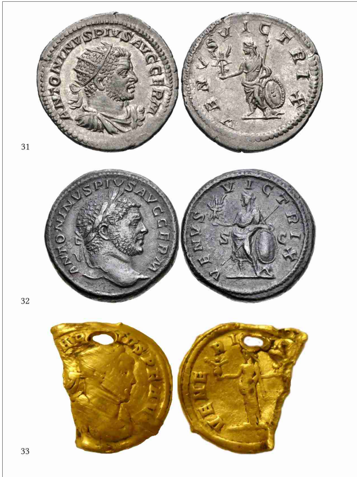
Fig. 11. 31. Caracallas Antoninian, Rom, während der Herrschaft Caracallas, RIC IV/1, 259.311. ( https://www.engcoins.com/Coin.aspx?CoinID=213078 , 2014.08.23.); 32. Caracallas As, Rom, während der Herrschaft Caracallas, RIC IV/1, 308.577. ( https://www.engcoins.com/Coin.aspx?CoinID=169872 , 2014.08.24.); 33. Aureus des Carinus, Rom, während der Regierung des Carinus, RIC V/2, 168.232. ( http://wildwinds.com/coins/ric/carinus/RIC_0232.jpg , 2014.08.23.).