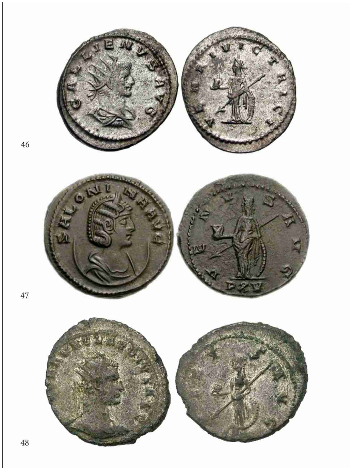
Fig. 16. 46. Antoninian des Gallienus, Antiochia, während der Alleinherrschaft des Gallienus, RIC V/1, 189.660. ( https://www.cngcoins.com/Coin.aspx?CoinID=37946 , 2014.08.28.); 47. Saloninas Antoninian, Antiochia, während der Alleinherrschaft des Gallienus, RIC V/1, 200.86. ( https://www.cngcoins.com/Coin.aspx?CoinID=69739 , 2014.08.28.); 48. Antoninian des Claudius II., Cyzicus, während der Regierung des Claudius II., RIC V/1, 232.245. ( http://www.coinproject.com/siteimages/70-34676q00.jpg , 2014.08.28.).