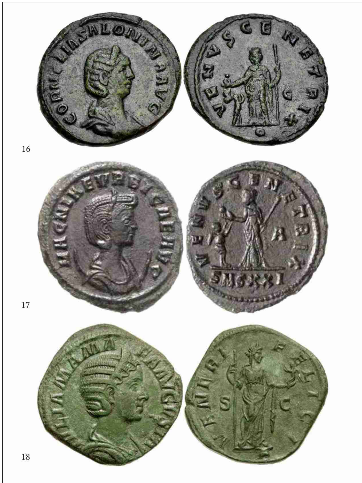
Fig. 6. 16. Saloninas As, Rom, während der Samtherrschaft des Valerianus und des Gallienus, RIC V/1, 113.55. ( https://www.ngcoins.com/Coin.aspx?CoinID=162970 , 2014.08.22.); 17. Antoninian von Magnia Urbica, Siscia, während der Regierung des Carinus, RIC V/2, 185.350. ( http://wildwinds.com/coins/ric/magnia_urbica/RIC_0350.jpg , 2014.08.22.); 18. Sesterz von Iulia Mamaea, Rom, während der Herrschaft des Severus Alexander, RIC IV/2, 126.694. ( https://www.ngcoins.com/Coin.aspx?CoinID=42130 , 2014.08.23.).