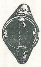
Mit 184 Holzschnitten.

(Diese Abtheilung ist Montag von 9—1 Uhr, an Wochentagen von 12—1 Uhr, und jeden dritten Sonntag von 10—1 Uhr geöffnet. — Nachmittag bleibt die Abtheilung geschlossen.)