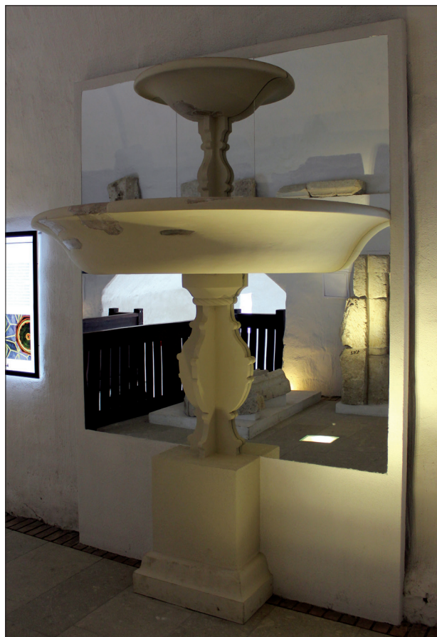
4. kép Reneszánsz díszkút rekonstrukciója a füzeri várban