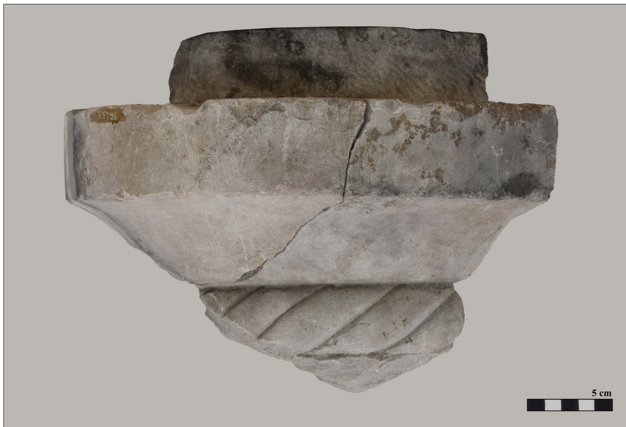
1. kép Reneszánsz díszkút töredéke Vácról (szembenézet) Fig. 1 Fragment of a Renaissance fountain from Vác (front view)

Sajnos a töredéket alkotó mindkét darab pontos lelőhelye ismeretlen. A nagyobbik (ltsz. 53.58.32.) lelőhelyeként Vác, Ferences zárda szerepel a múzeumi leltárkönyvben. Feltehető, bár egyértelműen nem igazolható, hogy az egykori püspöki székhely területén még 1912-ben végzett első ásítás alkalmá-