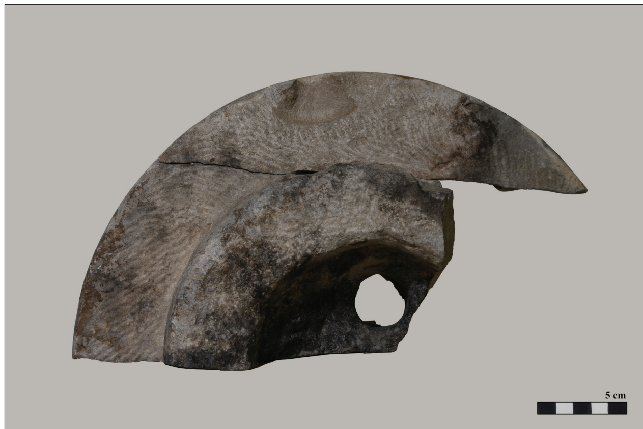
2. kép Reneszánsz díszkút töredéke (felülnézet) Fig. 2 Fragment of a Renaissance fountain from Vác (above view)

val került felszínre több egyéb reneszánsz faragvány-nyal együtt. Sajnos az ekkor előkerült leletek pontos azonosítása csak néhány nagyon egyértelmű esetben volt lehetséges, hiszen róluk csak rövid leírásokat tettek közzé. Ezek között szerepel egy, amely esetleg vonatkozatható az 53.58.32. ltsz. alatti töredékre: „601. Oszlopláb-töredék kötélfonatú párnataggal fehérre meszelt vörös homokkőből. Fejlett csúcsíves kor. XV. század” (Tragor 1912, 125). A kisebb darab (ltsz. 86.25.1.) a leltárkönyvi bejegyzés szerint a váci múzeum akkori épületének (Vác, Múzeum u. 4.) „udvarán virágágyás ásásakor került elő, a múzeum raktárának építésekor az udvarra kihordott, leltározatlan anyaghoz tartozik”. Tehát az egykori szerkezettel kapcsolatban, amelyhez tartoztak, csak annyi biztos, hogy a rendelkezésre álló adatok alapján Vácon, a püspöki székhelyen állhatott, de ennél közelebbi helye egyelőre meghatározhatatlan.