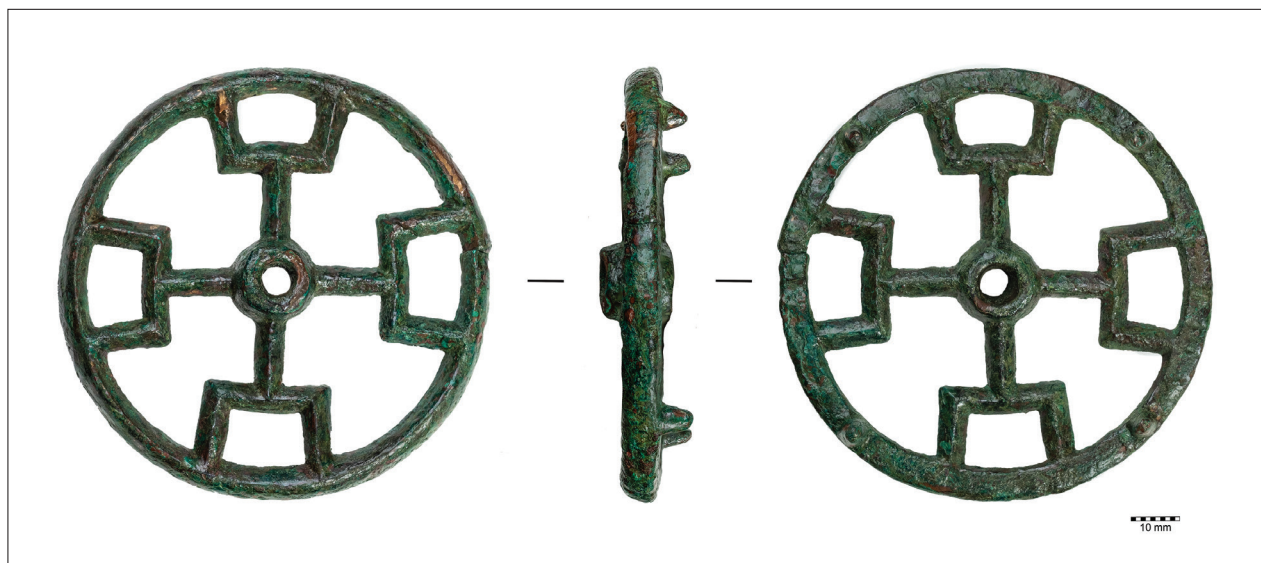
2. kép A kerék alakú, áttört „korongcsüngő” (Magyar Nemzeti Múzeum) Fig. 2 The wheel-shaped openwork “pendant” (Hungarian National Museum)