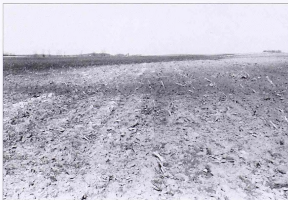
3. kép A Csikériára vezető 5501. sz. műút mentén, a 15. kilométerköttől északra a szántásban a sötét csík jelzi az Ördög árka egykori árkanak nyomát (délkelet felől fényképezve)

A sánc biztos nyomára a terepen – légifénykép útmutatása alapján – a Csikériáról Kelebiára vezető 5501. sz. műút mentén, a Csikéria és Tompa közötti községhatártól keletre kb. 350 m-re találtunk rá, ahol délkelet felől egy földút torkollik a műútra (2. kép). Itt a műút északi oldalán, tőle kb. 20 m-re, a szántóföldön sötétebb talajcsík alakjában jelentkezett, amely kelet felé haladva enyhén távolodik az úttól. Így a községhatártól kb. 600 m-re lévő dombháton már kb. 70–80 m-re volt tőle. Itt a nyomvonal, különösen a homokdombok hátán jól követhető volt (3. kép). Kelet felé újabb kb. 750 m-re, egy elhagyott major istállójának északi oldalán, kb. 20 m-re tőle (a műúttól mintegy 110 m-re) húzódott el. Innen azonban enyhe ívben visszakanyarodik a műút felé. Különösen jól látszott ott, ahol a műút kb. 100 m hosszan töltésen fut, és tőle délre két tanya is van.