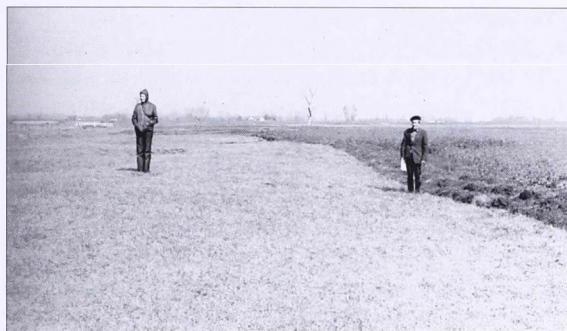
8. kép Kisszállás határában a Törökdombtól délre, az északnyugat-délkelet irányú csatornától északra (délkelet felől fényképezve)

Abb. 7 Auf der Weide in der Gemarkung von Kisszállás, südlich von der Straße, die vom Gehöft Torma zur Eisenbahn führt (vom Süden fotografiert)