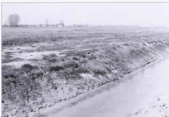
5. kép Az egykori árok nyoma Tompa határában a Körösér dülőben ásott csatorna déli oldalán (kelet felől fényképezve)

Abb. 5 Die Spur des ehemaligen Graberns in der Gemarkung von Tompa, an der Südseite des in der Feldmark Körösér gegrabenen Kanals (vom Osten fotografiert)