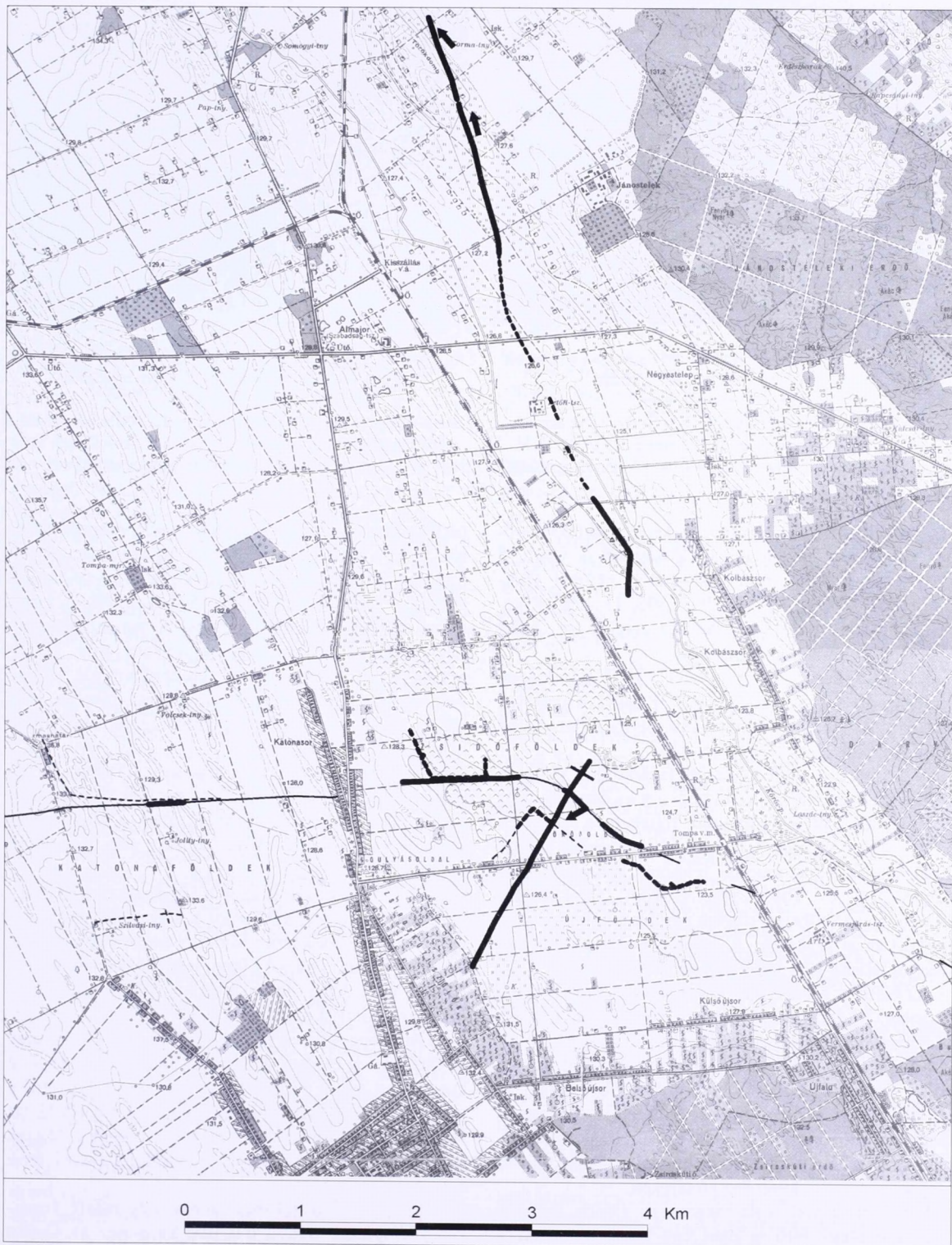
4. kép 2. térképszelvény Abb. 4 Kartenselung 2.