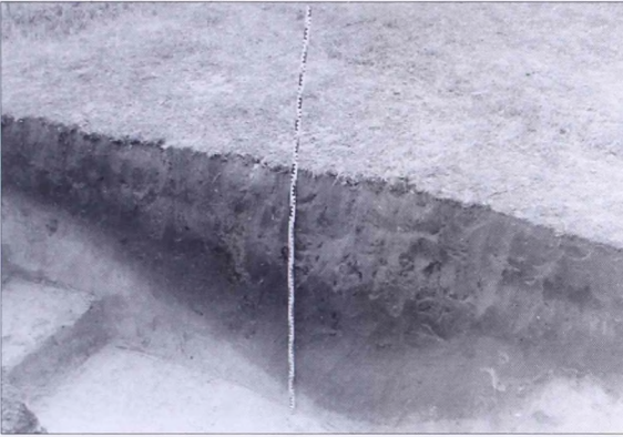
12. kép Az Ördög árkának profilja Harkakötöny határában, a félegyházi út mellett végzett átvágás nyugati falában (északkelet felől fényképezve)

Abb. 12 Das Profil von Ördög árok in der westlichen Wand des Durchchnitts an der nach Félegyháza führenden Feldweg in der Gemarkung von Harkakötöny (vom Südosten fotografiert)