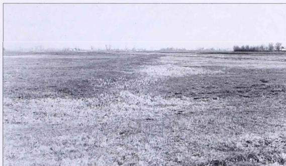
7. kép Kisszállás határában a Torma tanyától a vasút felé vezető úttól délre, a legelőn (dél felől fényképezve)

Abb. 7 Auf der Weide in der Gemarkung von Kisszállás, südlich von der Straße, die vom Gehöft Torma zur Eisenbahn führt (vom Süden fotografiert)