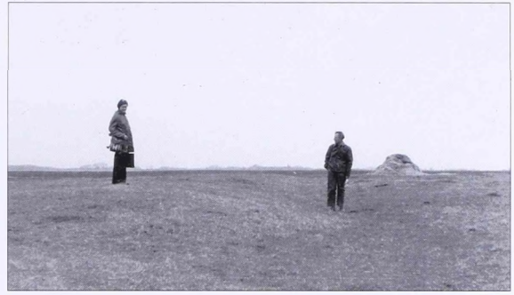
13. kép Harkakötöny határában a félegyházi út északi oldalán (délnyugat felől fényképezve)

A tó keleti oldalán a terepbejáráskor a víz egészen a mellette északnyugat-délkeleti irányba futó Dongér csatorna partját alkotó töltésig ért. De itt is belefutott –