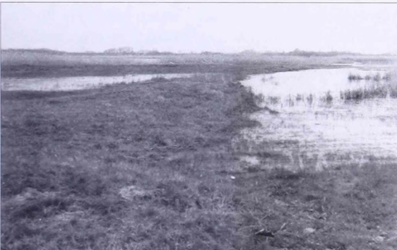
14. kép Az Ördög árok töltésének a Harka tó vízébe nyúló maradványa, a háttérben a tavat kettéválasztó gát (délnyugat felől fényképezve)

különbég a feltöltődött egykori árok és a lekopott töltés szintje között. A vízbe (amelynek tükre a terepbejárás idején jóval szélesebb volt, mint amilyent a térkép feltüntet), a sánc töltése hosszú földnyelvként nyúlik bele, míg ennek déli oldalán az egykori árkot víz tölti ki (14. kép). Egyébként a légifényképekről világosan kivethető, hogy a sánc a tó helyén egykor folyamatosan ki volt ásva.