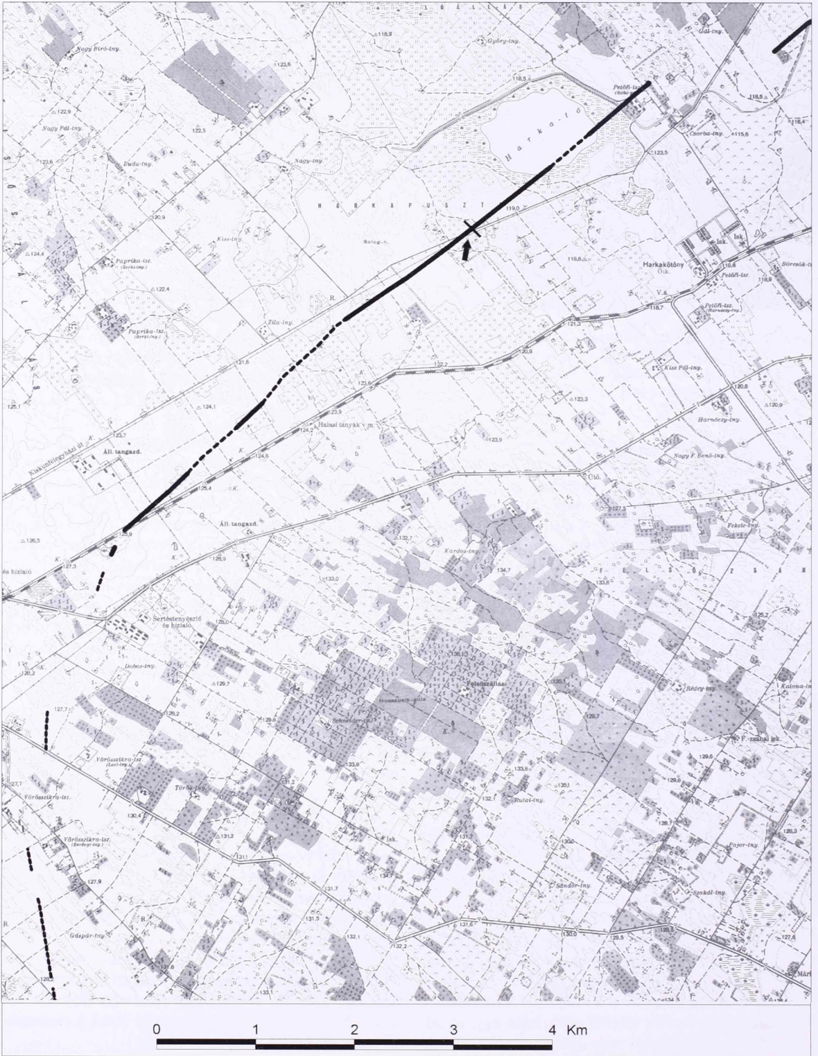
11. kép 4. térképszelvény Abb. 11 Kartenseng 4.