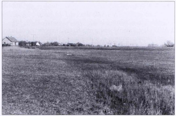
16. kép A Bodoglár melletti legelőn (délnyugat felől fényképezve)

A tanya gazdája maga is jól ismerte az Ördög árkat; az elbeszélése szerint a tanyája mellett haladt el. De is-