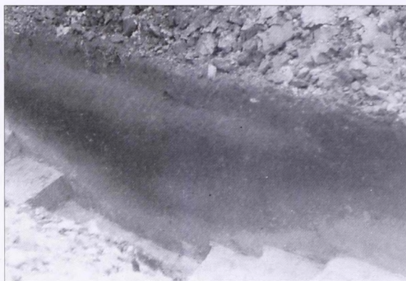
6. kép Az Ördög árkának profilja a tompai Zsidóföldeken végzett átvágás déli falában (északnyugat felől fényképezve)

Abb. 5 Die Spur des ehemaligen Graberns in der Gemarkung von Tompa, an der Südseite des in der Feldmark Körösér gegrabenen Kanals (vom Osten fotografiert)