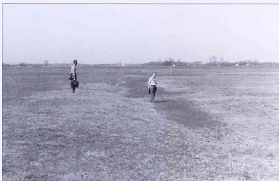
10. kép A kiskunhalasi Alsószállás dűlőben lévő tanyától keletre (dél felől fényképezve)

elérhet. Ezzel ez a Bácska-kiskunsági vonalnak legjobb, azaz legkevésbé lepusztult szakasza (10. kép).