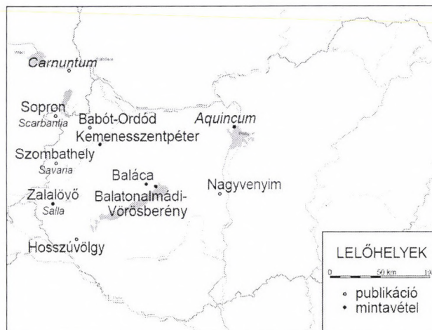
1. kép A vizsgált minták lelőhelyei és a szakirodalomban említett fekete bevonatos peremű edények lelőhelyei Fig. 1. Sites of the examined samples and findspots of the vessels with mouths coated with a black material mentioned in literature

nan származik a kátrány és milyen célból kenték be vele az edényt.