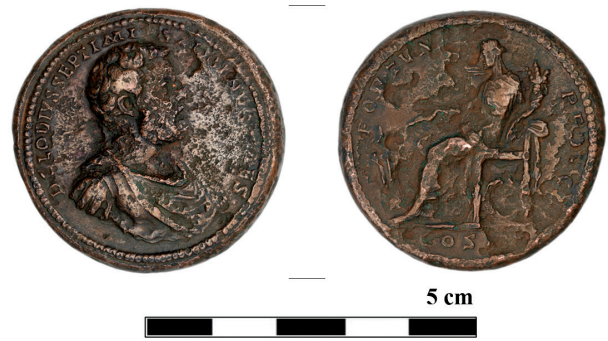
3. kép Clodius Albinus réz medalion (vétél: Újváry Béla, MNM-ÉT 15/1897 ltsz. alatt, fotó: Rosta József) Fig. 3 Copper medallion of Clodius Albinus (purchase: Béla Újváry, Inv. Nr. MNM-ÉT 15/1897, photo: József Rosta)

gyűjtött (római) érmekeket és még nagyobb eséllyel tisztában volt értékükkel is. A MNT-ba nem sokkal annak alapítása után már belépett (1913-ig rendes tag), érdeklődési körként egyedül a római érmekeket jelölte meg. Az akkor önálló gyűjteménnyel rendelkező MNT-t 1905-ben ajándékozás útján 1240 (!) tétellel, valamint köztársaság kori érmeutánszatokkal gyarapította, ezek későbbi sorsáról nem rendelkezünk bővebb adatokkal (Név nélkül 1905a, 23; Név nélkül 1905b, 56).