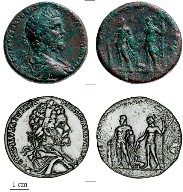
1. kép Septimius Severus réz medalion Dunaújváros területéről (Kat. 1, MNM-ÉT 97A/1907 ltsz. alatt,)