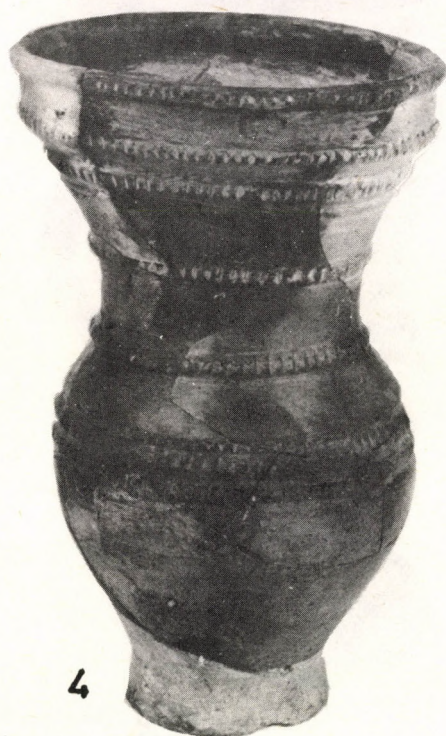
3. kép Mezőnyárad, Kossuth utca. Bepecsételéssel díszített cserépkancsók