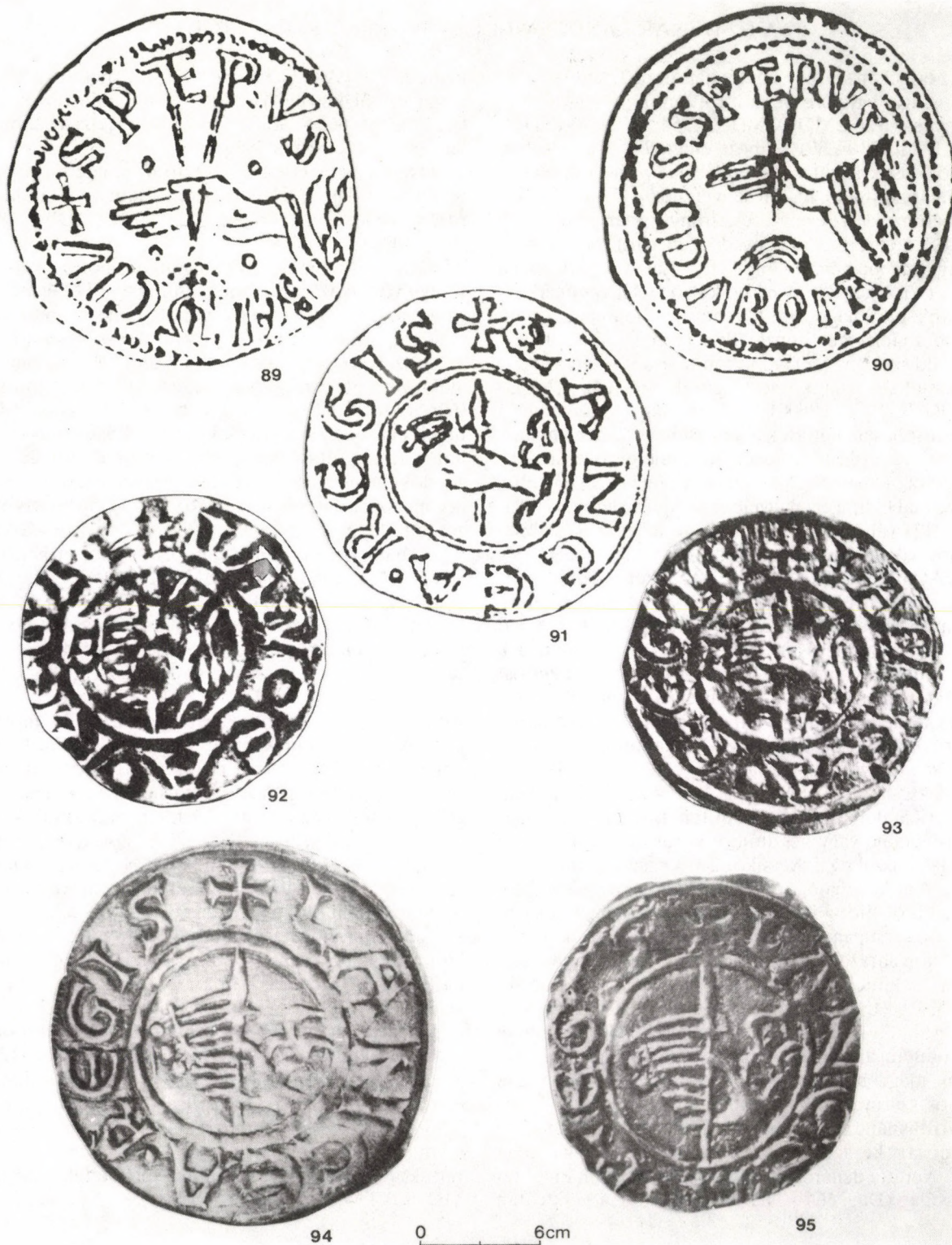
3. kép A ruhaujjból kinyúló, tárgyat tartó kéz ábrázolása: 89–90: trieri denárokon (Dbg. 475–476); 91–93: a H2a denárváltozat regensburgi, svédországi és kelci példányán; 94–95: a H2 denának a nagyharsányi kincs egy-egy eltérő veretpárral kivert példányán;