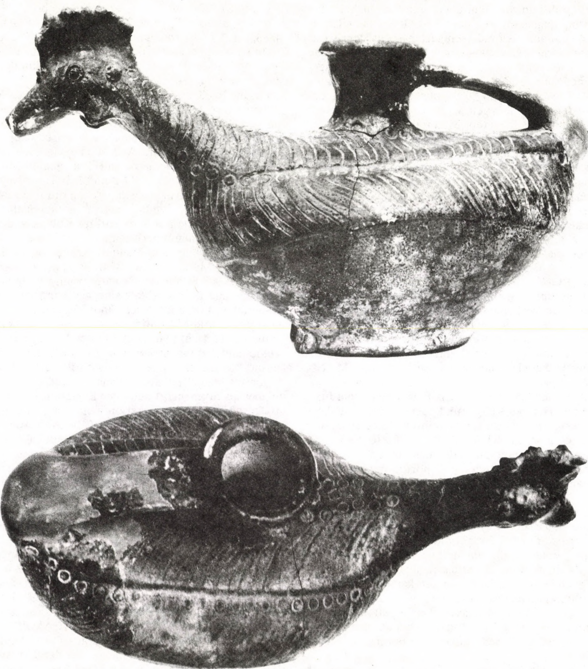
Abb. 1 Spätrömischer ascos aus Szentendre (verkleinert)