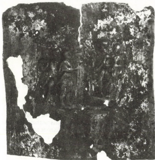
2. kép Az adlocutio val ellátott hüvelyveret Aquincumból (2:1)