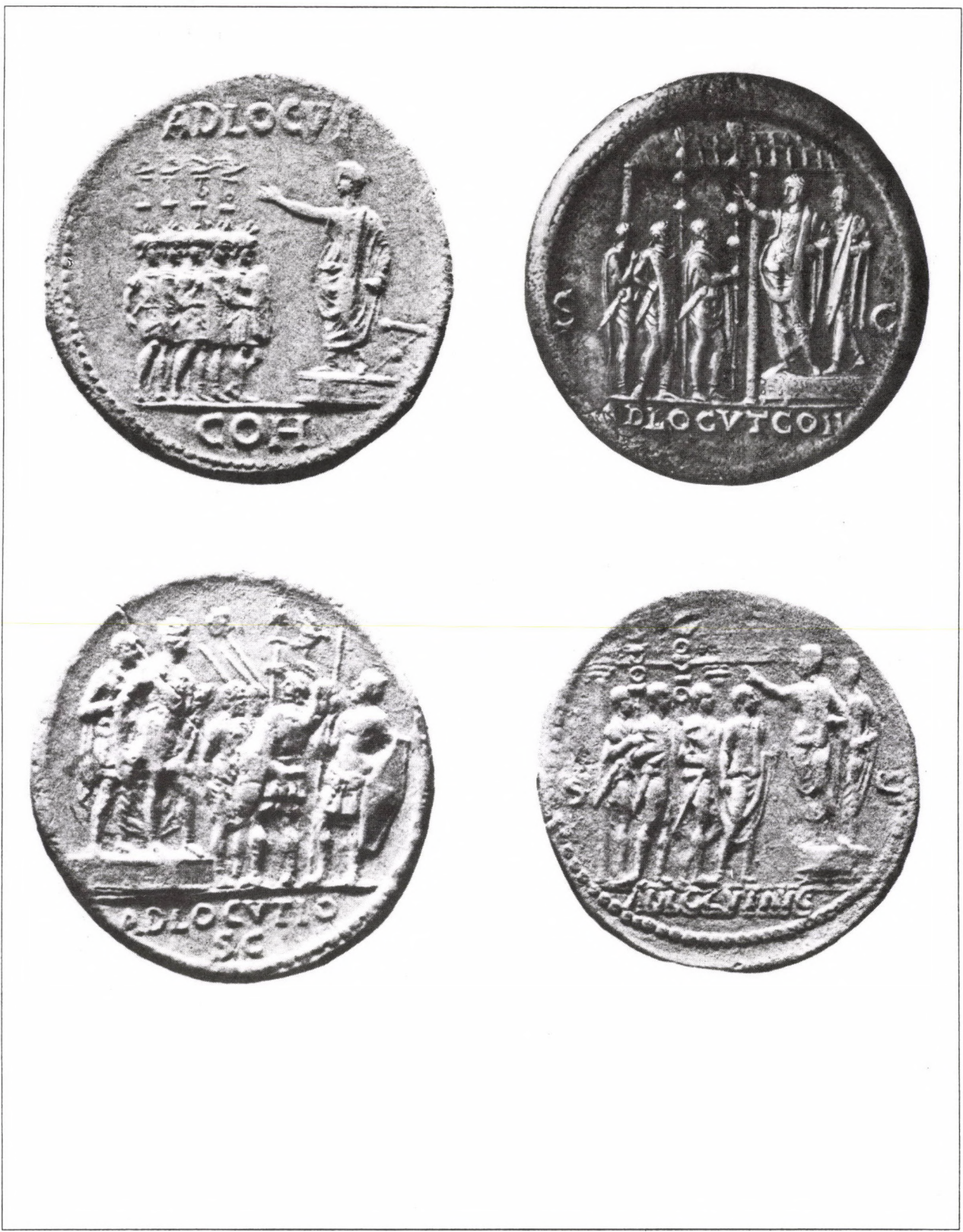
4. kép 1: Caligula érem adlocutio képével; 2: Nero sestertiusa adlocutio jelenettel; 3: Galba érem adlocutio ábrázolással; 4: Nerva sestertiusa adlocutio val Fig. 4 1: Caligula coin with adlocutio picture; 2: Nero sestertius with adlocutio scene; 3: Galba coin with adlocutio representation; 4: Nerva sestertius with adlocutio