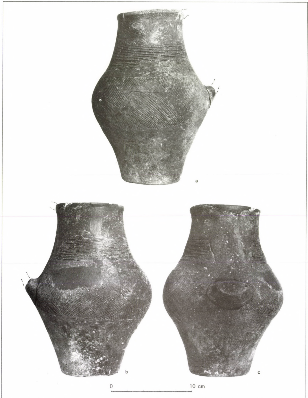
Abb. 1 Bátaszék-Dolinapuszta, kupferzeitlicher Krug