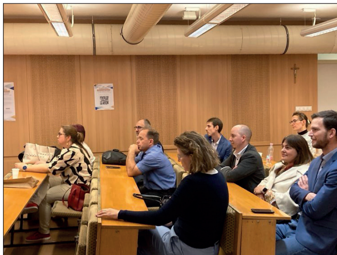
3. kép A közönség egy része

A két napon át tartó konferencián összesen 49 előadótól 41 előadás hangzott el. A tematika szerint a következő szekcióülésekre került sor: Kommunikáció, retorika, médiatudatosság; Digitalizáció és mesterséges intelligencia a kommunikációoktatásban; Kommunikáció, pedagógia és tanári szerepek; Kommunikációs készségfejlesztés lehetőségei; Kommunikáció és kapcsolódásai.