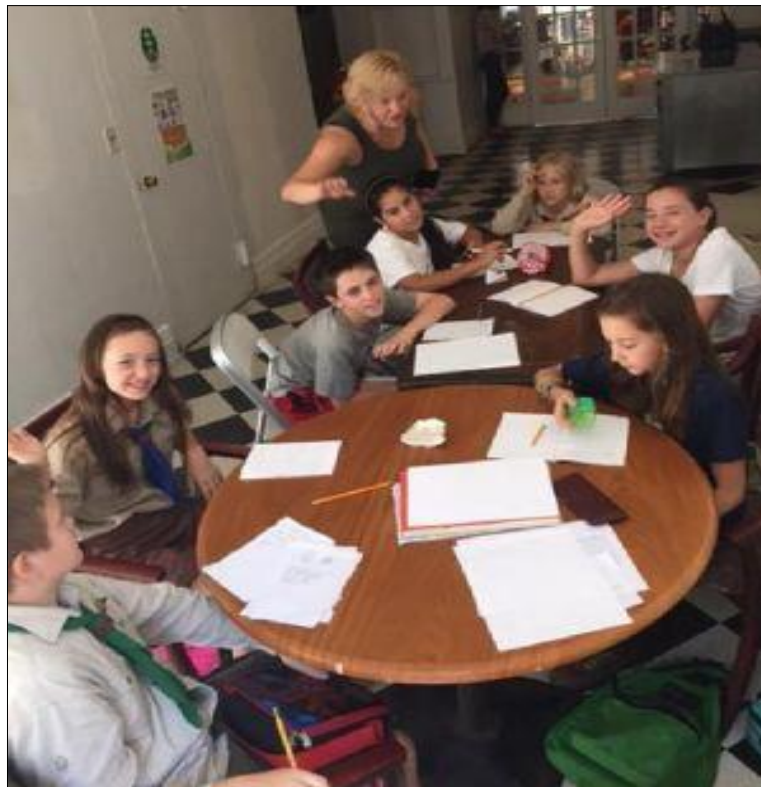
10. ábra A felsősök csoportjai