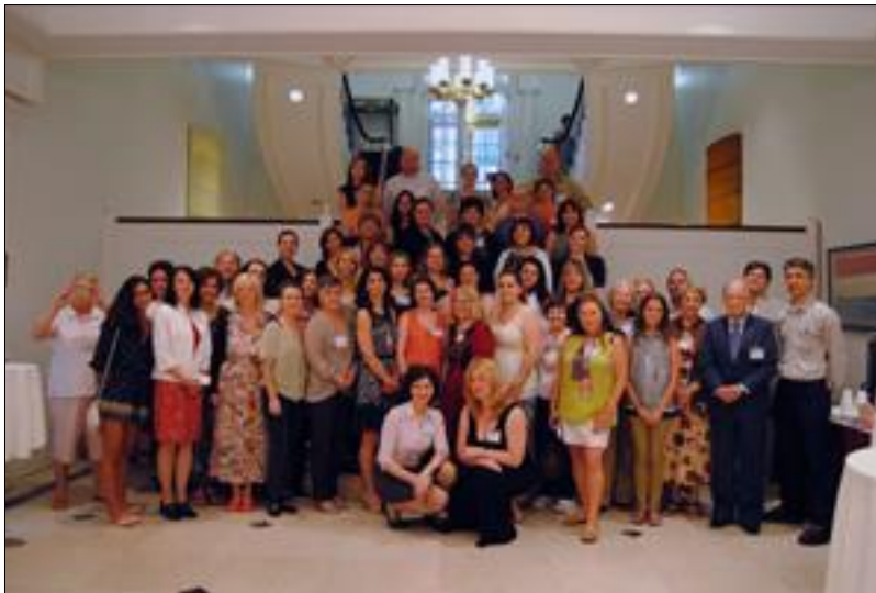
12. ábra A 2015-ben megrendezett AMIT résztvevői