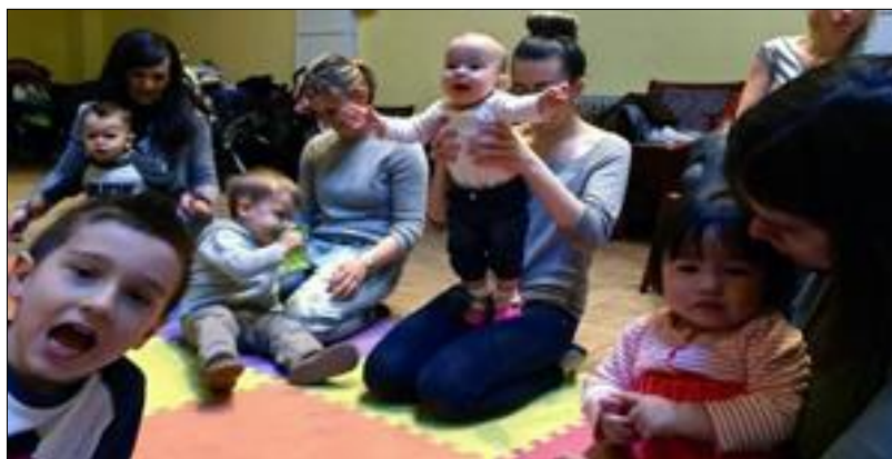
4. ábra Bóbita szülő-gyermek játszócsoport

Ez a sajátos generáció kivételes megközelítést igényel. A magyarországi, illetve az európai rendszerhez, nézetekhez képest eltérő életszemlélet alakul ki a tanulóknban, emellett az európai oktatási módszerek és a tananyag is különbözik az amerikai rendszertől. Mindezeket a szempontokat figyelembe véve alakítjuk ki a tananyagot, és igyekszünk olyan iskolai környezetet biztosítani, ahova a gyermekek örömmel jönnek, amely a tananyagon túlmenően közösségi élményt is nyújt a számukra. Idén szeptembertől a „Bóbita szülő-gyermek játszócsoport” is az AJMI részeként működik azzal a céllal, hogy a kisgyermekes családokat is bevonjuk az iskola közösségébe.