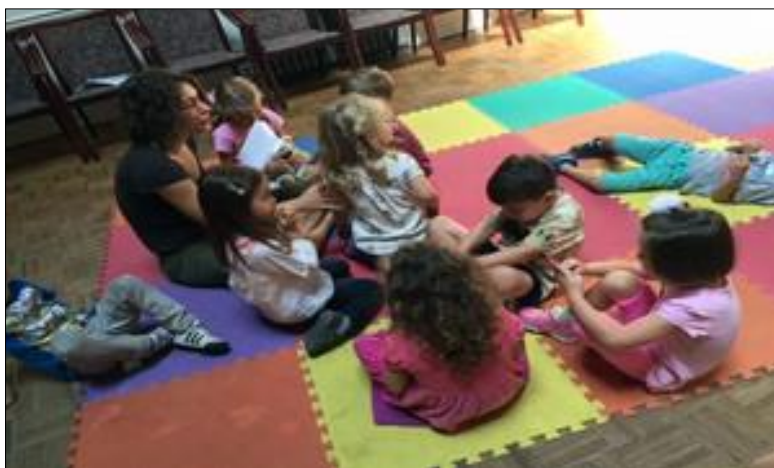
5. ábra Óvodai foglalkozáson

Jelenleg négy iskolás és három óvodás csoportja van az AJMI-nak. Az óvodai kiscsoport 3–4 éveseket, a középső csoport 4–5 éveseket, a nagycsoport pedig 5–6 éveseket fogad. A nagycsoport egyben iskola-előkészítő csoport is. A tudatos nyelvi fejlesztésen túl célunk a magyar irodalom meghatározó műveinek a bemutatása, a népi hagyományok megismertetése, megszerettetése és gyakoroltatása népdalokon, mondókákon és gyermekjátékokon keresztül.