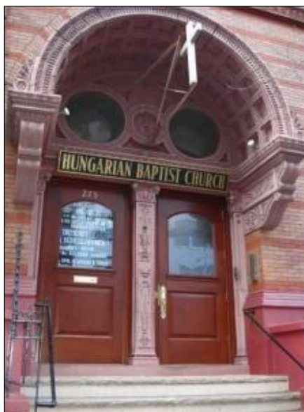
13. ábra A New York-i magyar baptista templom

A katolikus egyházközségek összevonásának következtében a New York-i Szent István-templom parókiája 2015 augusztusában megszűnt. A parókia korábban termeket biztosított az AJMI szombati tanóráira a templomhoz kapcsolódó amerikai katolikus iskola épületében. A megszűnés miatt az AJMI és a Saint Stephen of Hungary School közötti bérleti megállapodás is érvényét veszítette. A New York-i Magyar Ház és társszervezetei felkarolták az AJMI-t, biztosítják a helyszínt, ezzel is garantálva az intézmény folyamatos működését. 2015 szeptemberében további két termet kaptunk a New York-i Baptista Gyülekezet imaházában. A hozzávetőlegesen 75 fővel rendelkező Bóbita csoport, valamint az óvodai és az iskolai csoportok a Magyar Házban, illetve a baptista imaházban való további működtetése a megfelelő logisztikai megoldásokkal – ha nem is optimálisan, de – kivitelezhető.