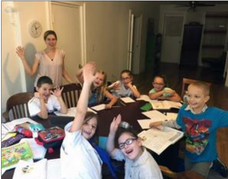
9. ábra Tanulás közben