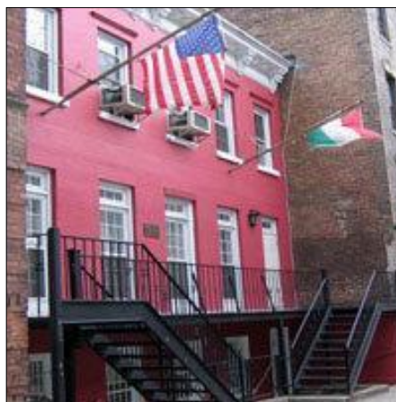
2. ábra A New York-i Magyar Ház épülete

A tanítás a New York-i Magyar Ház épületében (213 E 82nd St, New York, NY 10028) és a Baptista Gyülekezet (225 E 80th St, New York, NY 10075) két termében folyik szombat délelőttönként 9.30-tól 12.30-ig.