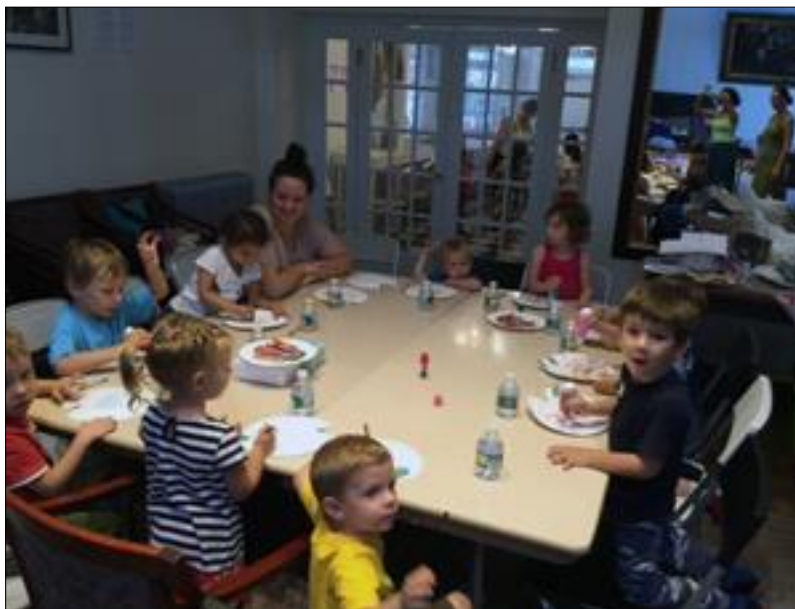
6. ábra Érdeklődő arcok