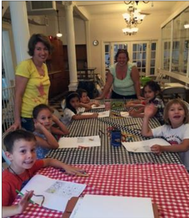
7. ábra A nagycsoport

A kisiskolások oktatásában leginkább a szépíráson és az olvasáson van a hangsúly. Erre az alapra építkezve egészül ki a tananyag további nyelvtani, irodalmi, történelmi és földrajzi alapismeretekkel. A felső tagozatosok tananyagát úgy állítottuk össze, hogy az egyben felkészítsen a Külföldi Magyar Cserkészszövetség (KMCSSZ) magyarságismereti vizsgájára is. A hagyományörzés fontos része a tanításnak: rendszeresen megemlékezünk a jeles magyar ünnepekről.