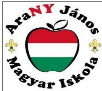
1. ábra Az iskola logója

Az Arany János Magyar Iskolát (AJMI) 1963-ban alapították. Az akkoriban egy maroknyi cserkészt és néhány lelkes fiatal tisztet számláló kezdeményezés mára 68 iskolás és óvodás korú gyermeket nevelő iskolává nőtte ki magát. Az Arany János Magyar Iskola egy olyan befogadó, nonprofit oktatási és közösségi szervezet, amelynek elsődleges célja a beszédkézség fejlesztése, a magyar nyelven történő olvasás, illetve a nyelvtani alapfogalmak elsajátítása, ezt kiegészítve az alapvető magyar történelmi és földrajzi ismeretekkel (1).