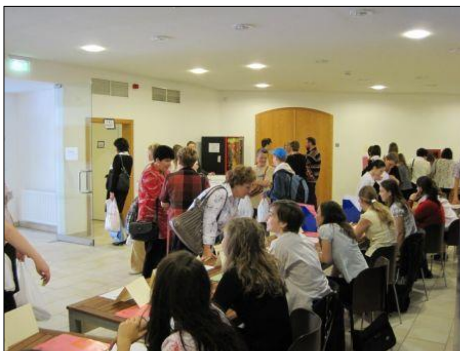
20. ábra Regisztráló hallgatók 2010-ben

A versenyt kísérő programok alkalmat adnak a külföldi és hazai felnőtteknek, gyermekeknek a személyes kapcsolatok építésére és ápolására is. A különböző iskolákból érkező diákok nemcsak magán