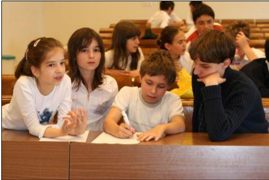
21. ábra Csapatjáték 2006-ban

a versenyen vannak együtt, hanem a kollégiumban, a kulturális programokon és a közösségi játékokon is. Ekkor gyakran szövődnek olyan barátságok, amelyek a verseny után is folytatódnak.