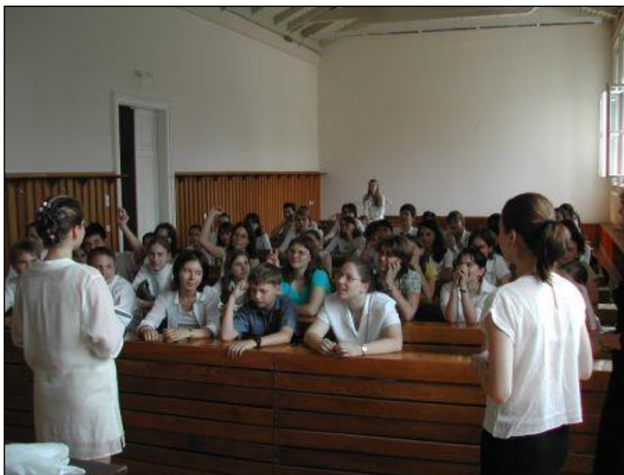
19. ábra Játékvezető hallgatók 2003-ban