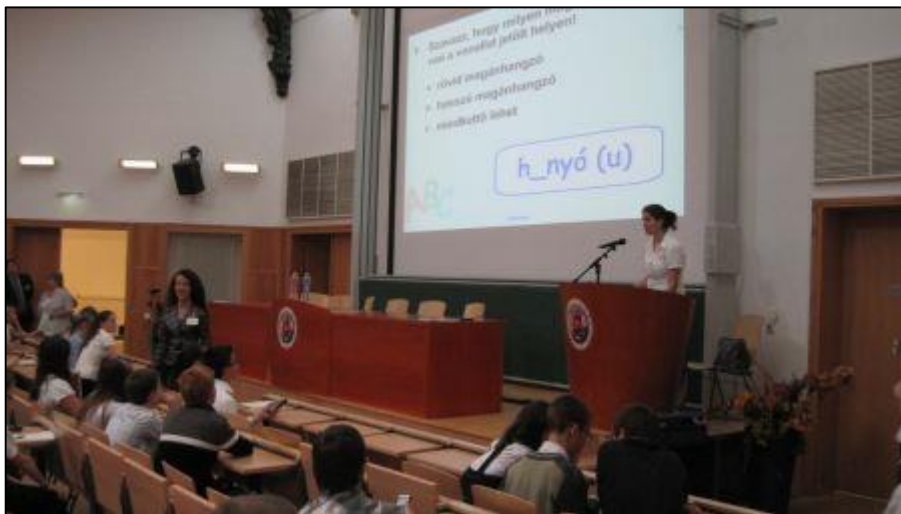
22. ábra Szavazógépes csapatverseny 2012-ben

A határon túli területekről érkező diákok és kísérőik május végén 2-3 napot töltenek Budapesten a Kárpát-medencei döntőn. Számukra a szervezők mindennap ellátást biztosítanak, a döntő napján pedig minden versenyzőt meghívunk egy közös ebédre. Ezek a közös étkezések is alkalmat nyújtanak a felnőtteknek és a gyermekeknek a jóízű beszélgetésekre.